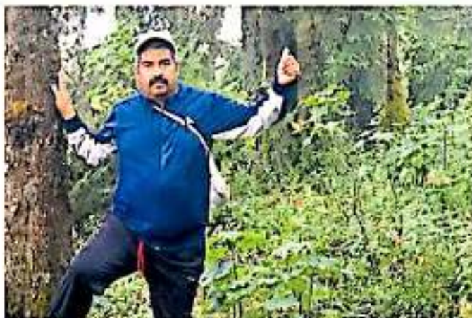
La desaparición de Homero Gómez González fue el pasado 13 de enero

De acuerdo a la FGE, en el caso de Homero Gómez "se continúa con su búsqueda permanente a la que se han sumado organismos como la Organización de las