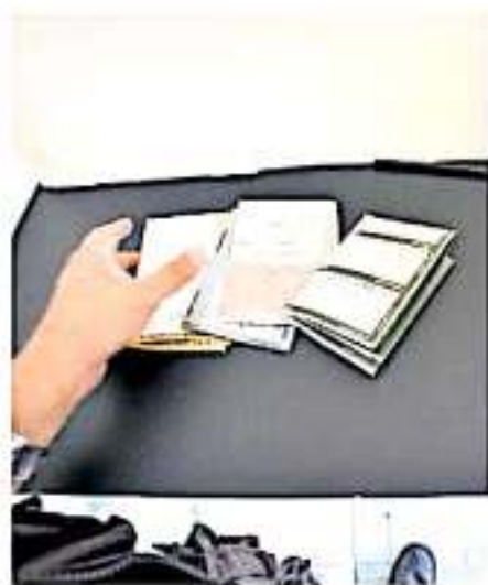
Este 2020 comenzarán las gestiones y primeras capacitaciones a más de mil funcionarios

En este contexto, insistió en la necesidad de borrar de hábitos y formas que interdicional o inconscientemente, promueven estereotipos y costumbres que tienen en formas de violencia y que limitan el desarrollo de las niñas y mujeres.