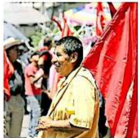
La organización tiene la intención de convertirse en un partido político a nivel nacional. Abreiva

Estamos trabajando junto con todos los compañeros y haciendo el trabajo interno de organización para constituir nuestro partido"