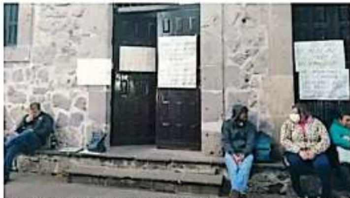
Autoridades universitarias presentaron una demanda contra el Sueum por las afectaciones de la tortura de víctimas. (IDEFESA)

"La autoridad quiere legitimar su mala actuación y el incumplimiento del pago de