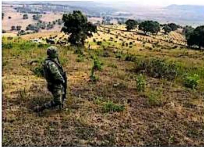
Las huertas de aguacate es uno de los principales motivos del cambio de uso de suelo. SEMACDET

Anunció que mientras se revisan las otras 45 denuncias se continuará con las acciones de desinstalación de huertas ilegales de aguacate en los municipios de Parícuti y Zacapu.