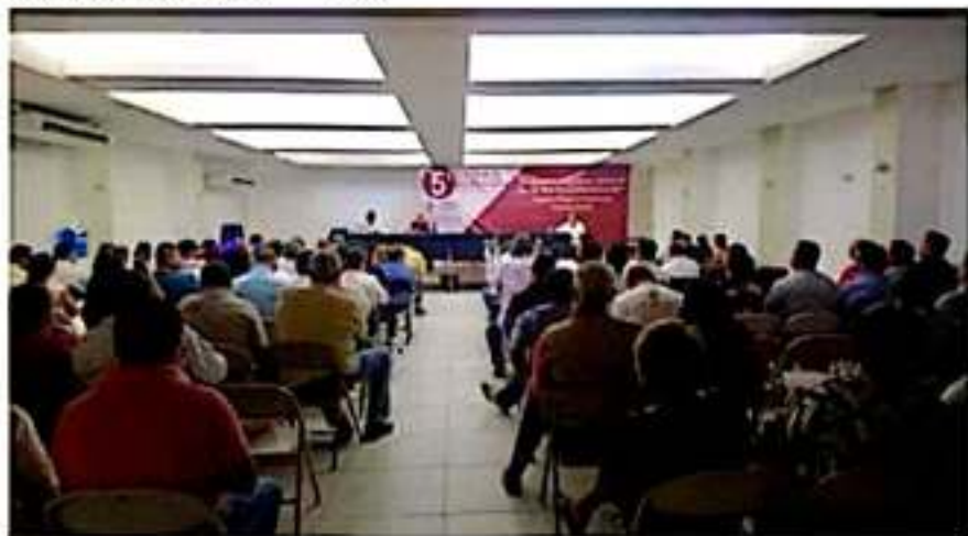
Aspecto de la buena asistencia que se tuvo en el Quinto Foro Laboral: El Nuevo Régimen Laboral de la Cuarta Transformación, celebrado aquí el fin de semana pasado.

Destacó que los contratos colectivos se harán con el principio de la bilateralidad entre los trabajadores y el patrón. "Ya no se negociará en lo oculto".