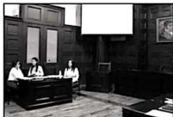
EL CMASC ES UN CENTRO HUMANISTA DONDE HAY LA POSIBILIDAD DE ACCEDER A LA JUSTICIA DE MANERA PRONTA, GARANTIZANDO LA REPARACIÓN DEL DAÑO.

Confirmó la entrevistada que, en procesos muy cortos, en menos de tres meses, se han recuperado inmuebles, llevado a cabo el pago de la reparación del daño en forma inmediata o puede ser diferida "... y con esto acortamos un desgaste económico, emocional y físico de acudir a un juicio oral bajo el nuevo sistema", agregó la Coordi-