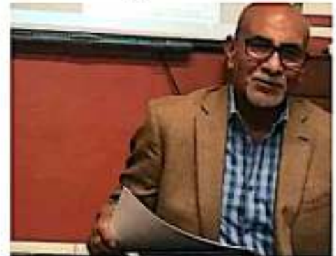
Resalta el Congreso que la falta de acuerdos a la CEDH debe ser superada con consenso, oficio político y capacidad. JORJANNA

"De que tienen perfiles que pueden hacer un papel decoroso, los tienen... en ese tema se deben complementar habilidades en tres áreas: el buen conocimiento de los derechos humanos, oficio político y capacidad de operación. Más que ponderar el tiempo, para mí la prioridad sería que vean los perfiles adecuados, así se van a tardar uno, dos o tres meses más", expresó. JORJANNA