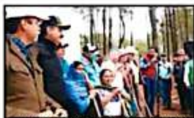
AUTORIDADES ASISTENTES REITERARON SU COMPROMISO CON EL CUIDADO DEL MEDIO AMBIENTE.