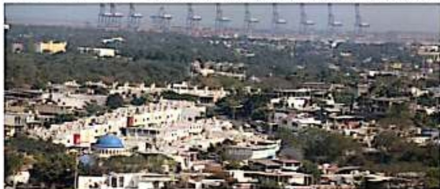
CD. LÁZARO CÁRDENAS, MICH.- Un 99.7 por ciento de la población mayor de 18 años de Lázaro Cárdenas identificó al menos un problema en el municipio, reveló la más reciente encuesta de ENSU.

del Instituto Nacional de Estadística y Geografía (Inegi), un 33.0% de la población respondió que experimentó algún acto de corrupción con personal de las dependencias de seguridad pública.