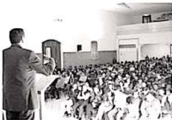
La Educación Ambiental provee a la población y a las instituciones de los mecanismos y las estrategias para la concientización sobre el deterioro de la naturaleza y la adopción de hábitos de vida sustentables.

Así, la Administración Estatal, genera, aplica y fomenta soluciones a los principales retos ambientales que enfrenta la entidad, como el cambio ilegal del uso del suelo forestal, la tala clandestina, los incendios de los bosques y selvas, la pérdida de la biodiversidad, la contaminación del aire, la degradación de los suelos y los mantos