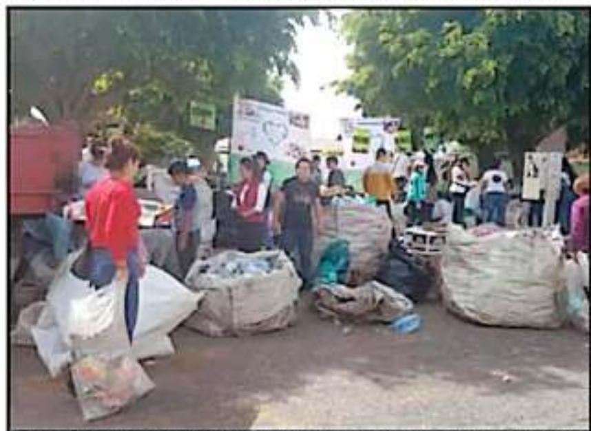
RECICLA POR AMOR ES LA AGRUPACIÓN QUE PROMUEVE RECICLAJE PARA AYUDAR A LOS GRUPOS ALTRUISTAS.