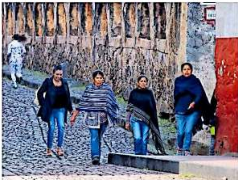
Autoridades insisten en acabar con estereotipos que promuevan la violencia contra

"Hace más de tres años se definió dicha agenda y hoy a cuatro años de nuestra gestión al frente del gobierno municipal podemos afirmar con resultados que Pátzcuaro