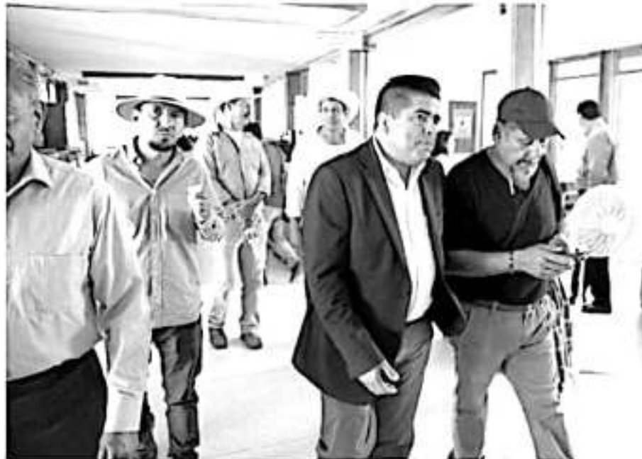
Inicio este lunes, operativo de pago de programas de Bienestar en Michoacán; discapacidad y Adultos Mayores aumentarán su pago.

Cabe agregar que, a partir del primer bimestre de este año, las pensiones para el Bienestar de las Personas Adultas Mayores y Personas con Discapacidad pasarán de 2 mil 550 pesos bimestrales a 2 mil 620 pesos, que continuarán llegando de manera directa a los beneficiarios, en el entendido de que la única autonomía efectiva es la que comienza por la autonomía económica.