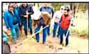
LA JORNADA DE AYER CONSISTIÓ EN DAR MANTENIMIENTO A LAS BRECHAS CORTA-FUEGO.