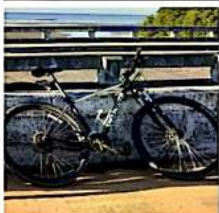
CD. LÁZARO CÁRDENAS, MICH.- Vehículos, casas habitación, bicicletas, motocicletas, son los principales objetivos de los amantes de lo ajeno en esta ciudad y puerto.