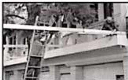
CONTINUA EL RETIRO DE LOS ANCLAJES QUE OBSTACULIZAN EL LIBRE TRÁNSITO EN LAS CALLES DE MORELIA.