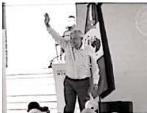
El presidente Andrés Manuel López Obrador dijo que las empresas que controlan el mercado de medicamentos se tienen acostumbrar a la nueva realidad.

No van a faltar las medicinas". Señaló que su gobierno ya se estableció el sistema de salud gratuita, aunque reconoció que no será fácil echarlo a andar porque hay resistencias.