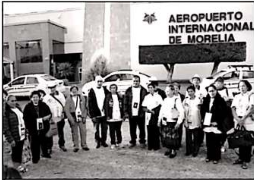
A TRAVÉS DEL PROGRAMA DE PALOMAS MENSAJERAS, PADRES DE FAMILIA SE REÚNEN CON SUS HIJOS EN LOS EUA.