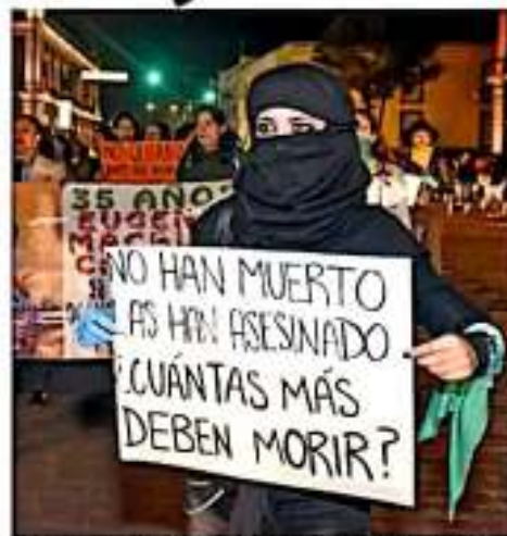
La impunidad es la falta de sanción ante una conducta impune que genera repercusión del país, del, adversativa a de derechos humanos.

cado a estudiar la impunidad, y el top 10 de impunidad lo integran Tlaxcala, Veracruz, Chiapas, Guerrero, Tamaulipas, Puebla, Coahuila, Sinaloa, Tabasco y Jalisco.