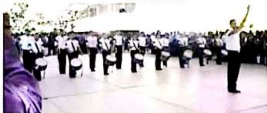
APATZINGÁN, MICH.- El evento se realizará a partir de las 10:00 horas en la explanada de la biblioteca pública "Benito Juárez".

Enfatizó que se contará con la participación de estudiantes de los CEBA de Aguilla, Coacimán, Buenavista, Mújica, La Huacana y Apatzingán, los cuales se han preparando para tener destacadas exhibiciones durante el evento que sirve para adentrar a los escolapios dentro de los valores cívicos que deben prevalecer, como es la Bandera Mexicana, el Escudo Nacional y las Bandas de Guerra, principales símbolos de nuestro país, junto con el Glorioso Ejército Mexicano, la Campana de Dolores y la Constitución Política de los Estados Unidos Mexicanos.