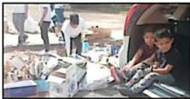
LOS RECURSOS QUE SE GENERAN CON LA SEPARACIÓN DE DESECHOS SÓLIDOS SERÁN PARA AYUDAR CAMPAÑAS COMO LA DE LOS NIÑOS CON CÁNCER.

COLECTIVOS altruistas participan en la campaña