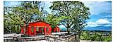
El turismo impulsará productos turísticos que acompañen el desarrollo a nivel regional, dice el jefe de Patriciano. JORJANNA

filtros para revisar la documentación de la madera que trasladan los vehículos, y cualquier que no traiga los documentos que demuestren que tiene permiso, vamos a tener que decomisarlo", advirtió.