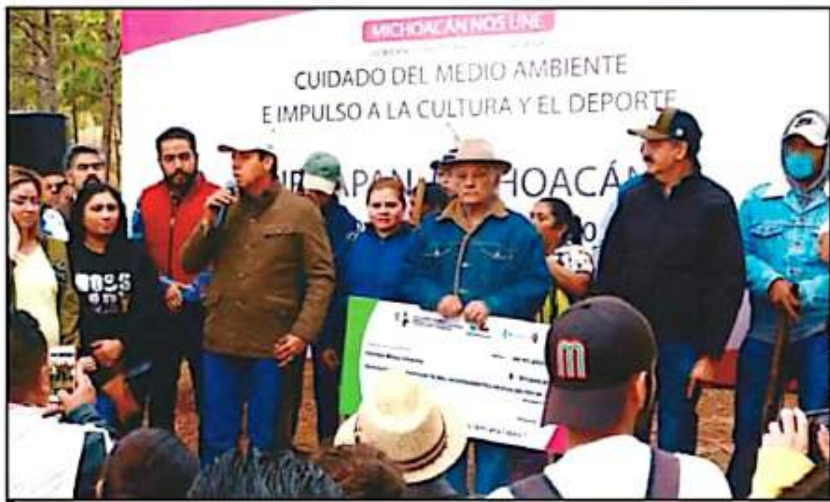
EL COMITÉ SE PUSO EN MARCHA CON LA PARTICIPACIÓN DE DIVERSAS AUTORIDADES. RECIBIERON UN APOYO DE MÁS DE 200 MIL PESOS PARA LA CAUSA.