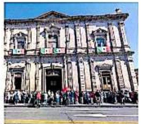
Este lunes, los pagos se harán a los adheridos al programa que beneficia a estos sectores agencia

Otras comunidades del estado donde habrá entregas de apoyos son San Lorenzo en Cutcioam y San Miguel Copejan de Panindícutin, San Isidro y La Cañada de Coameo y en Charapan a los de la comunidad de Ocumicho.