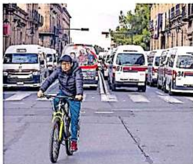
Los trabajadores adheridos a la Comisión Reguladora de Transporte impidieron las actividades de la ciclovia.

Martínez Pasalagua declaró que el Ayuntamiento capitalino no sólo dejó en el olvido a este sector de la sociedad, sino