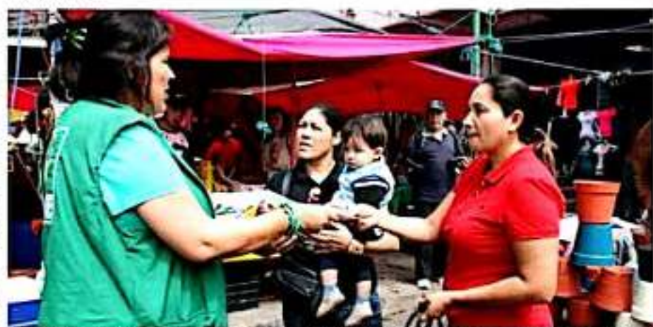
APATZINGÁN, MICH.- Durante el evento se llevó consulta médica, medicinas, reforestación, ropa y otros apoyos que se regalaron a quienes los solicitaron.