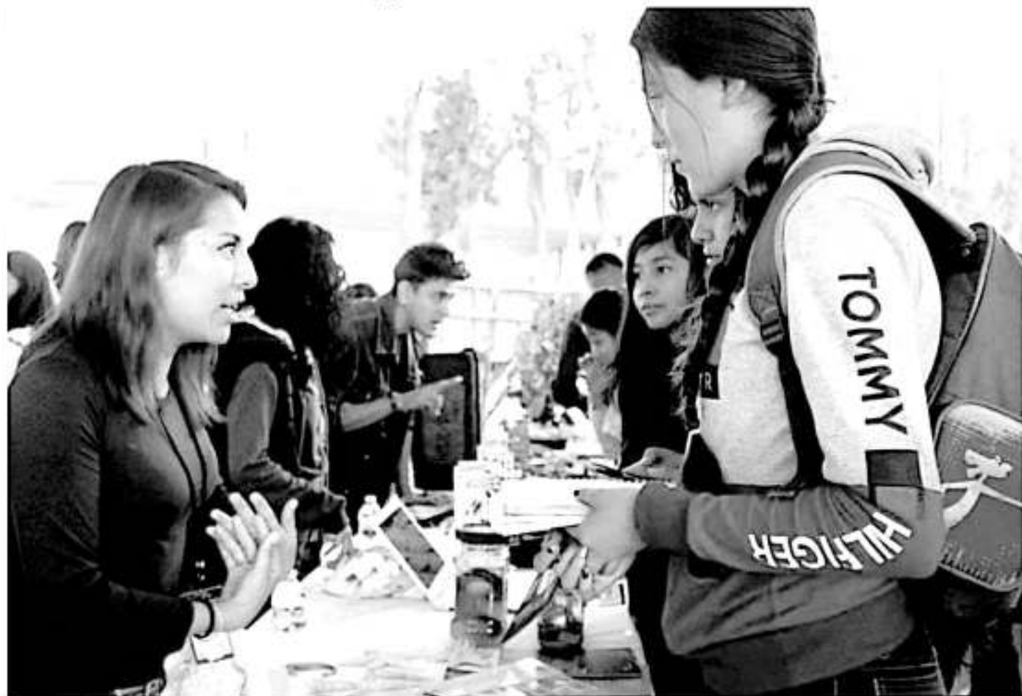
La exporienta 2020, se realizará los días 26, 27 y 28 de febrero del presente año, en los pasillos centrales de Ciudad Universitaria.

En esta edición de «ExpOrienta» se presentarán extensiones en Ciudad Hidalgo el día 03 de marzo y el 10 de marzo en Lázaro Cárdenas.