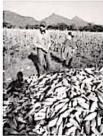
MORELIA, MICH.- El diputado por el Distrito de Huatamo subrayó la necesidad de dar los pasos necesarios en acciones afirmativas que fortalezcan al campo.

el colapso ambiental y con ello social generará problemas de grandes dimensiones.