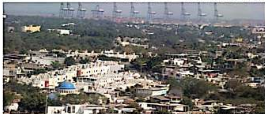
CD. LÁZARO CÁRDENAS, MICH.- Un 99.7 por ciento de la población mayor de 18 años de Lázaro Cárdenas identificó al menos un problema en el municipio, reveló la más reciente encuesta de ENSU.

del Instituto Nacional de Estadística y Geografía (Inegi), un 33.0% de la población respondió que experimentó algún acto de corrupción con personal de las dependencias de seguridad pública.