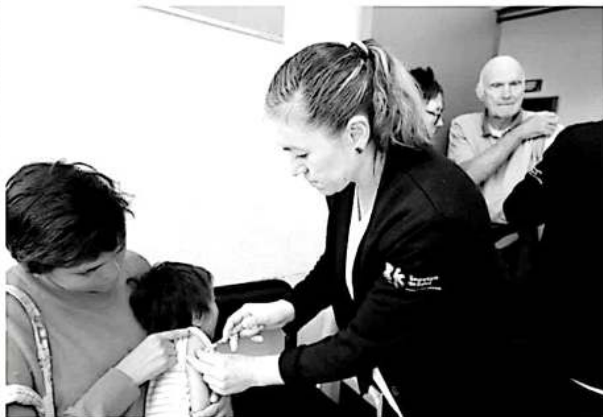
La entidad registra un acumulado de 23 casos de influenza, todos sin antecedente de vacunación, diez H1N1, seis H3N2 y siete tipo B.

En caso de presentar algún síntoma, como falta de respiración, silbidos de pecho o hundimiento del mismo, así como temperaturas por arriba de los 39 grados durante más de tres días, se debe evitar auto medicarse y acudir al hospital o centro de salud más cercano para que sea atendido por un especialista y no se ponga en riesgo la vida.