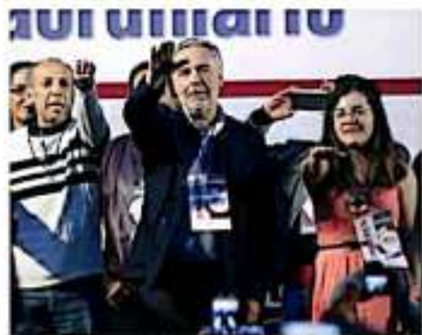
Se leva a cabo la sesión del VI Congreso Nacional del movimiento MORENA.

Por su parte, la presidenta del Consejo, Bertha Luján Uranga, escribió en la misma red social: "Le quiero informar a toda la militancia de MORENA en el país y a los integrantes de los Comités de Morena en el exterior que hemos logrado el objetivo para iniciar la sesión del VI Congreso Nacional Extraordinario con la representación de todos