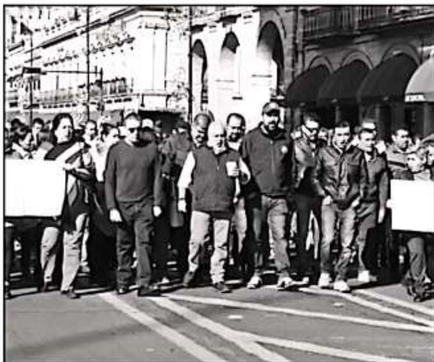
DEBIDO A LA FALTA DE PAGOS, AGREMIAOS SINDICALES DE LA UNIVERSIDAD ALISTAN UNA MOVILIZACIÓN

forma a quienes se adherieron a este nuevo pacto, sin embargo, sigue sin completarse el aguinaldo, por lo que agremiados del SPUM estallaron la huelga el pasado 16 de enero.