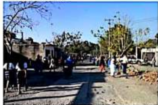
CD. LÁZARO CÁRDENAS, MICH.- En el marco del Día Mundial de Educación Ambiental, se realizarán mañana campañas de limpieza con diversas escuelas del municipio, coordinadas por los departamentos de Jóvenes y Ecología.

El funcionario municipal recordó que esta campaña tiene el objetivo de que la sociedad, especialmente los jóvenes, adopten y manifiesten un interés por la ciudad y el cuidado del medio ambiente.