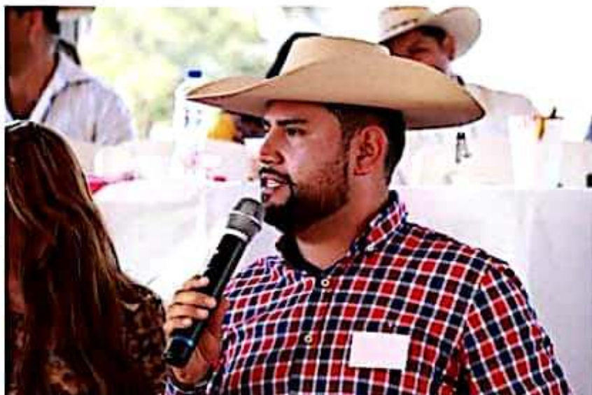
México es uno de los países más expuestos a la desertificación, que implica la degradación del suelo debido al calentamiento global, al cambio de uso de suelo. Octavio Ocampo.