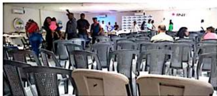
CD. LÁZARO CÁRDENAS, MICH.- Tras reunir solamente a 262 de 301 personas para validar su asamblea ante el INE, a la organización MasxMex le restan solamente 70 asambleas para obtener su registro como partido político.

Al destacar el potencial del puerto michoacano, donde sostuvo que también existe un nivel considerable de pobreza y marginación, el coordinador regional de MasxMex anunció que a nivel estatal proyectan visitar los 11 distritos restantes.