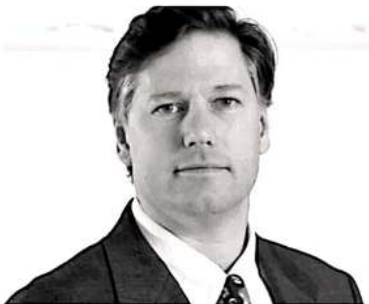
Christopher Landau, embajador de Estados Unidos en México.

Es así, que dicha medida evita que liderazgos de institutos políticos que no logren su objetivo, aprovechen la coyuntura y se postulen por la vía ciudadana, lo que sin duda permite dis-