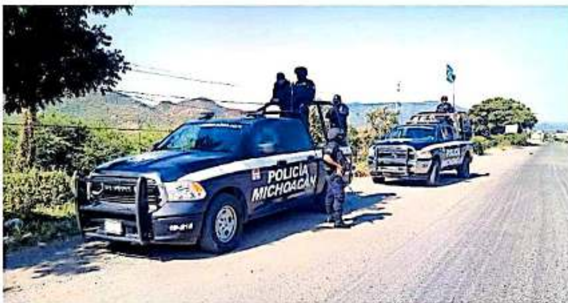
A nivel nacional se registraron 30 asesinatos de activistas y defensores de los derechos humanos