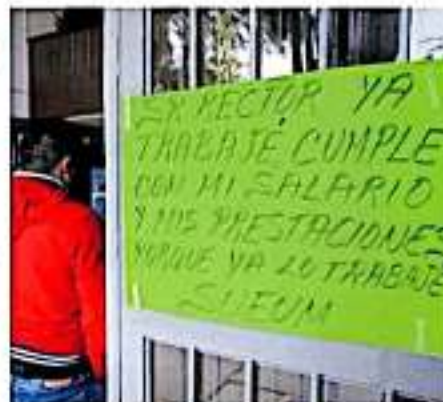
Los inconformes seguirán con sus protestas.

A decir del SUEM los administradores de la Universidad Michoacana de San Nicolás de Hidalgo, adeudan a los suemistas más de seis millones de pesos que