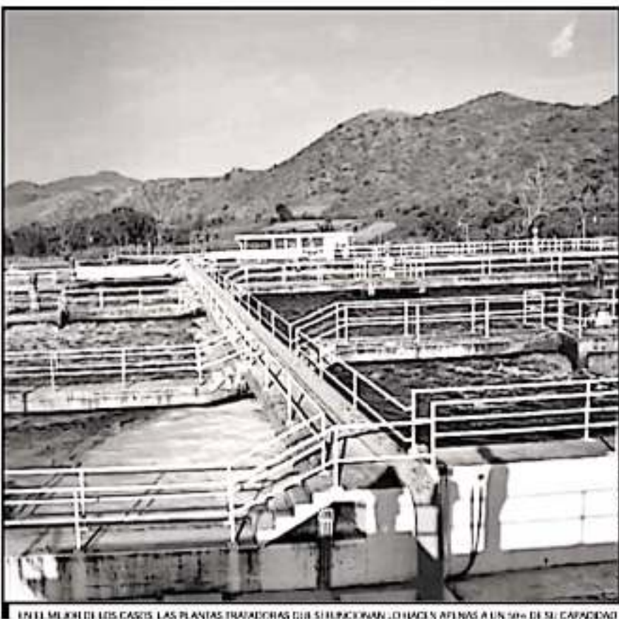
EN EL MEJOR DE LOS CASOS, LAS PLANTAS TRATADORAS QUE SE FUNCIONAN, O HACEN AFINES A UN 50% DE SU CAPACIDAD

rehabilitación y otro tanto para ponerlas a operar como tal, por lo que no se descarta la participación de los propios Ayuntamientos en donde están ubicadas las plantas para completar la ecuación.