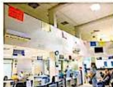
Advertieron que si esta semana no hay diálogo, endurecerán acciones. carlos.morales@elcom.com.mx

Los agremiados al STAOOAPAS exigen se respete el Contrato Colectivo de Trabajo (CCT)