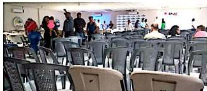
CD. LÁZARO CÁRDENAS, MICH.- Tras reunir solamente a 262 de 301 personas para validar su asamblea ante el INE, a la organización MasxMex le restan solamente 70 asambleas para obtener su registro como partido político.

Al destacar el potencial del puerto michoacano, donde sostuvo que también existe un nivel considerable de pobreza y marginación, el coordinador regional de MasxMex anunció que a nivel estatal proyectan visitar los 11 distritos restantes.