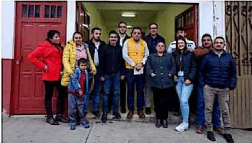
Delegados Distritales recorren municipios y comunidades.