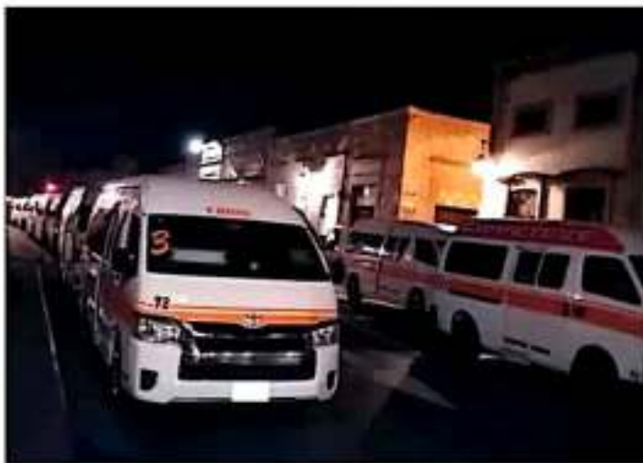
Desde varias horas los transportistas piden atención a la dirección de la avenida Vázquez. COMERCIA

El líder de la CRT en Michoacán, en conversación con Publímetro, explicó que deciden salir a las calles porque las autoridades municipales no han atendido las demandas de los transportis-