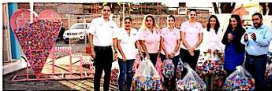
LOS REYES, MICH.- Se llevó a cabo la entrega de tapas plásticas recolectadas a la Fundación "Vive Sin Cáncer".