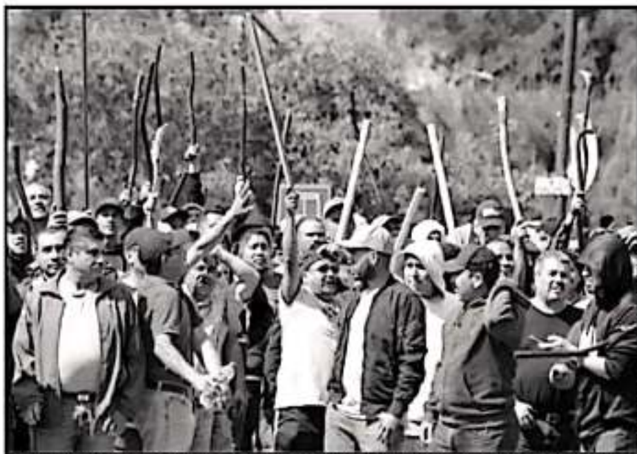
CONTINUA LA FRACTURA AL INTERIOR DE LA CNTE; OPOSITORES A ZAVALA ACUSAN QUE BUSCA SEGUIR EN EL PODER.

Para Mexicanos Primero, el conflicto se resume en que la actual dirigencia ha sido observada por la militancia de base en torno a irregularidades y que ante ellas se prevé un cambio tras una dé-