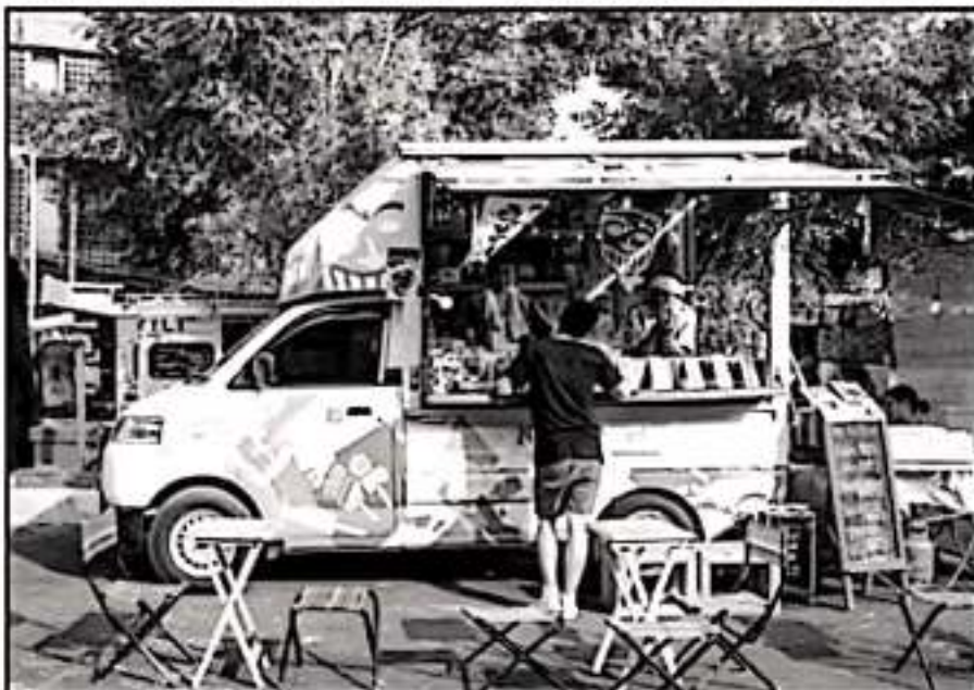
LOS LLAMADOS ‘FOOD TRUCKS’ PUEDEN TAMBIÉN CONVERTIRSE EN OBSTÁCULOS VIALES, SEÑALAN AUTORIDADES.

con los comerciantes”, añadió el funcionario municipal encargado de venta en la vía pública.