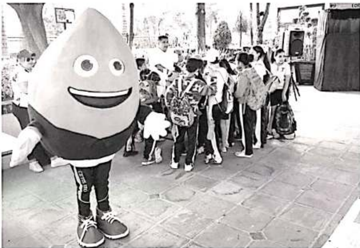
En una rutina diaria todos los bienes que empleamos consumen un determinado volumen de agua en su proceso de producción y uso.