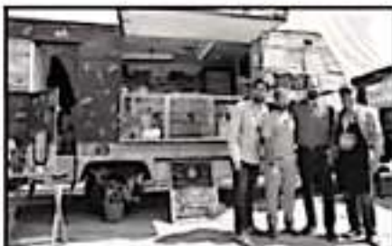
LAS CAMIONETAS QUE EXPENDEN ALIMENTOS EN LA VÍA PÚBLICA SERÁN NORWANDOS POR EL AYUNTAMIENTO.