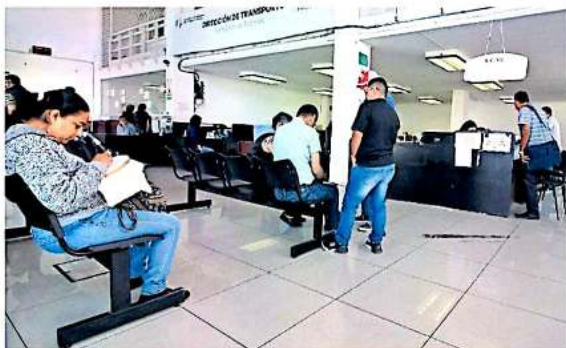
El escrito que envió Bicivilizate Michoacán fue desde el pasado 13 de febrero. MORELIA/UNA