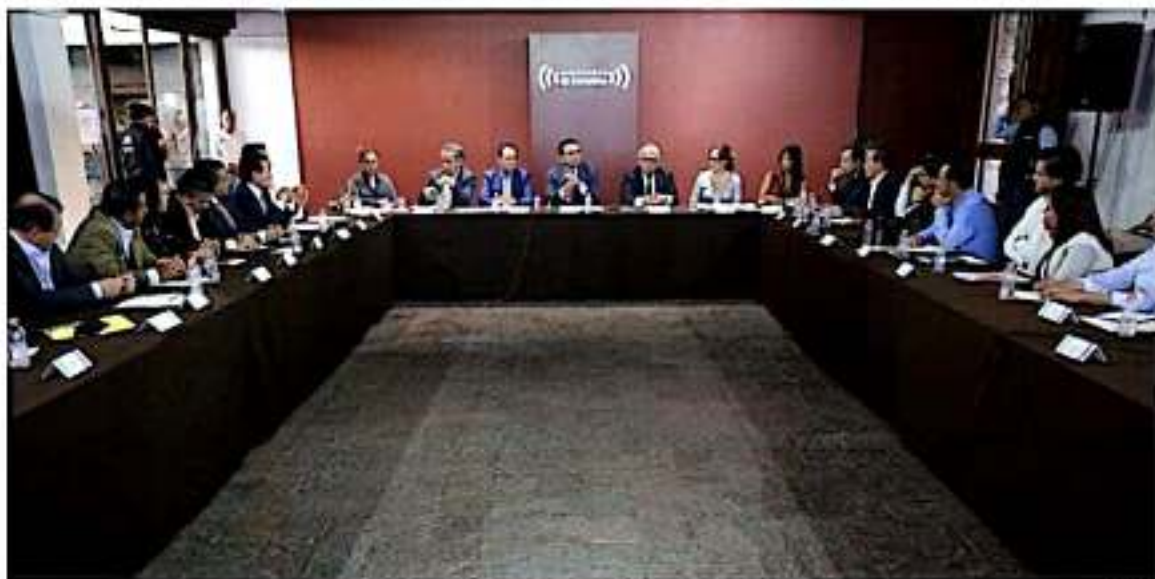
Se reúne el gobernador con el gabinete económico y da instrucciones para reforzar las acciones en favor de las mujeres michoacanas.

ta en una política pública integral a favor de ellas”, explicó el mandatario.