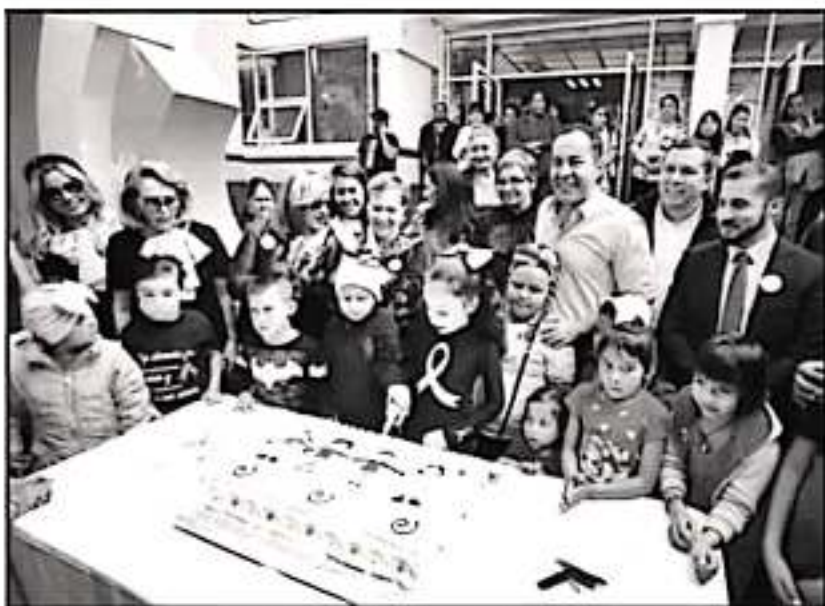
LA SECRETARÍA DE SALUD DE MICHOACÁN GARANTIZÓ LA ENTREGA DE MEDICINAS PARA LOS NIÑOS CON CÁNCER.

bargo, esas fortalezas espirituales y emocionales hacen la diferencia, mi reconocimiento para todas las niñas y niños y para todas las familias que están en respaldo y dando esta lucha", añadió.