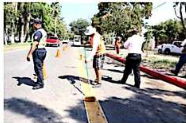
APATZINGÁN, MICH.- El presidente expuso que son aproximadamente 30 paradas de autobuses las que se balizarán en los próximos días.

Periférico Paseo de la República 4079, Col. Ana María Gallaga C.P. 58195 Morelia, Michoacán Tel. (443) 308-0925 al 30 www.elcanaldemichoacan.tv