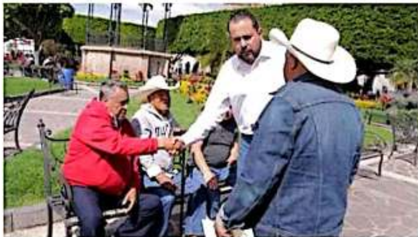
El diputado Humberto González Villagómez, durante una gira de trabajo.

po parlamentario del Partido de la Revolución Democrática recordó a partir de los datos del INEGI que el Producto Interno Bruto del sector de la vivienda contribuye en promedio con 6 por ciento del producto del país y ha registrado una variación promedio anual de 1.5 por ciento en términos reales.