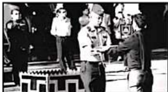
RECIBIERON LA ENTREGA DE 11 BANDERAS PARA INSTITUCIONES EDUCATIVAS

De igual manera la convocatoria se hará pública por medio de las distintas instituciones educativas, para que todos los jóvenes interesados puedan conocer las bases de la misma.