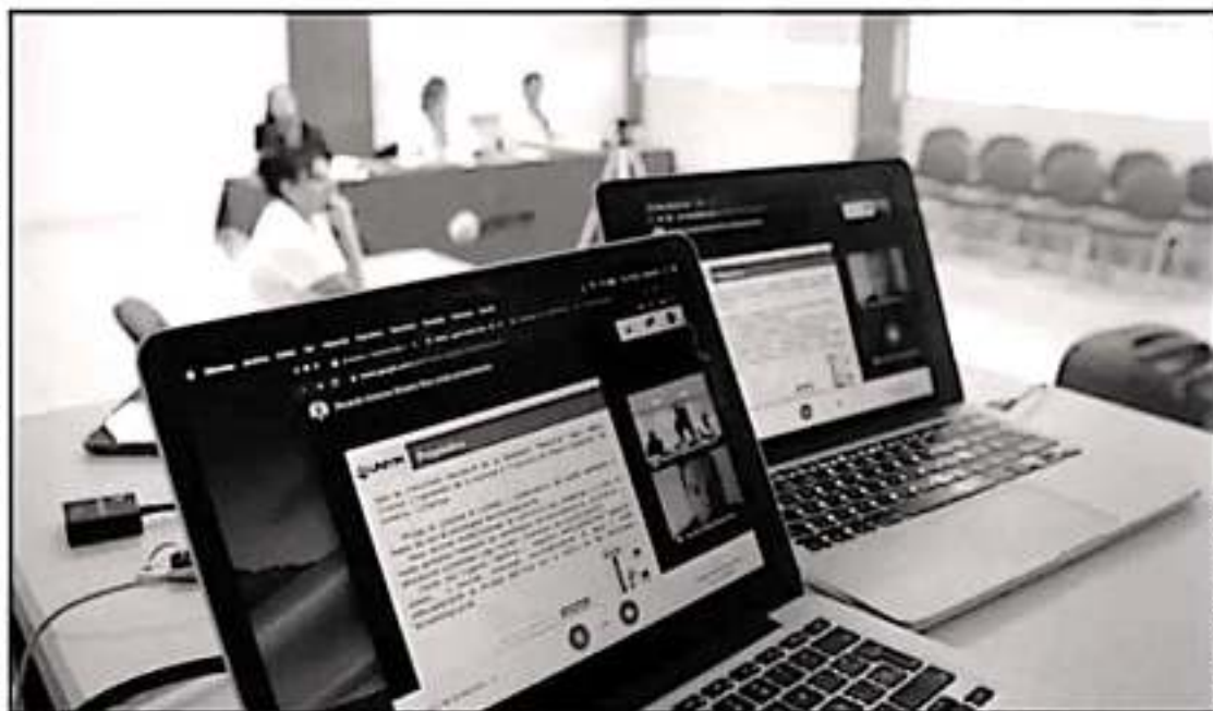
LA EDUCACIÓN A DISTANCIA SIGUE FORTALECIÉNDOSE EN LA ENTIDAD CON LA OFERTA ACADÉMICA QUE PRESENTA LA UNIVERSIDAD VIRTUAL DE MICHOACÁN

creamos los analizadores que conectan el edificio central con el comedor, así como a los laboratorios; también construimos la fachada de acceso y equipamos dos salas de capacitación con 25 equipos de cómputo cada una", dijo.