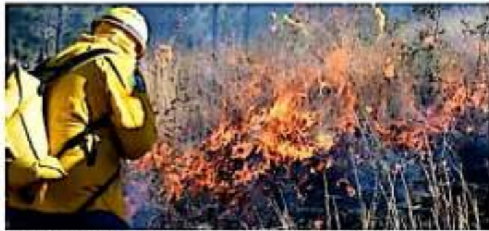
Una de las acciones forestales son provocados por actividades humanas, según las autoridades. COMTAM

afectada una superficie de 14 mil hectáreas; por lo tanto, la entidad se ubica en el lugar número 14 a nivel nacional con la mayor afectación.