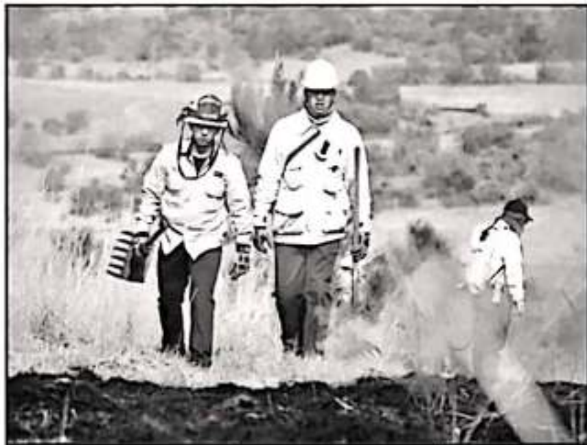
EL GOBIERNO ESTATAL PLANEA PROTEGER ÁREAS BOSCOSAS DE MICHOACÁN EN LA PRÓXIMA TEMPORADA DE ESTIAJE.

turales emblemáticas como la reserva de la mariposa monarca, la implementación de brechas corta fuego y continuar capacitando y sensibilizando a la población para promover el cuidado ambiental, con acciones claras y a través de la Mesa de Seguridad Ambiental que da puntual atención al tema.