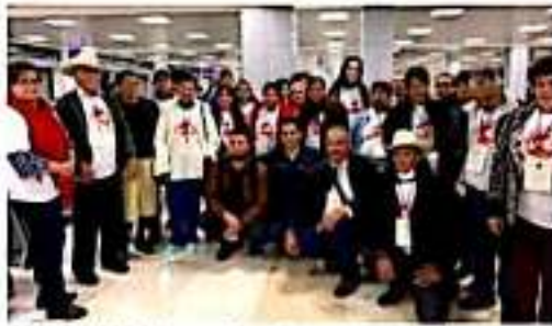
COTIJA, MICH.- Palomas Mensajeras de este municipio se reunieron con familiares en Estados Unidos.

Finalmente, varios de los beneficiarios del programa agradecieron el apoyo brindado por el Ayuntamiento de Cotija para que todo el grupo de Palomas Mensajeras pudiera reunirse con familiares y amigos.