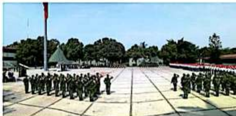
CD. LÁZARO CÁRDENAS, MICH.- La Sedena informó de los resultados obtenidos por el Ejército Mexicano durante el periodo comprendido del 1 al 31 de enero del presente año.

Los detenidos y lo asegurado fue puesto a disposición de las autoridades correspondientes.