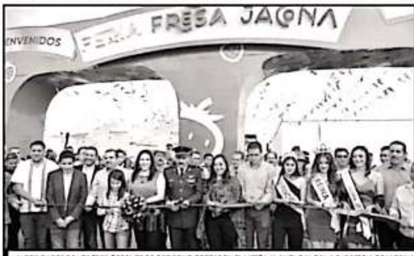
AUTORIDADES DE LOS TRES ÓRDENES DE GOBIERNO CORTARON EL LISTÓN INAUGURAL DE LA EXPOSICIÓN DE JACONA.

No podía faltar la Expo Ganadera, en la cual se aprecian una gran variedad de borregos, caballos, Cebu, Charolesa y una granja interactiva en la que los