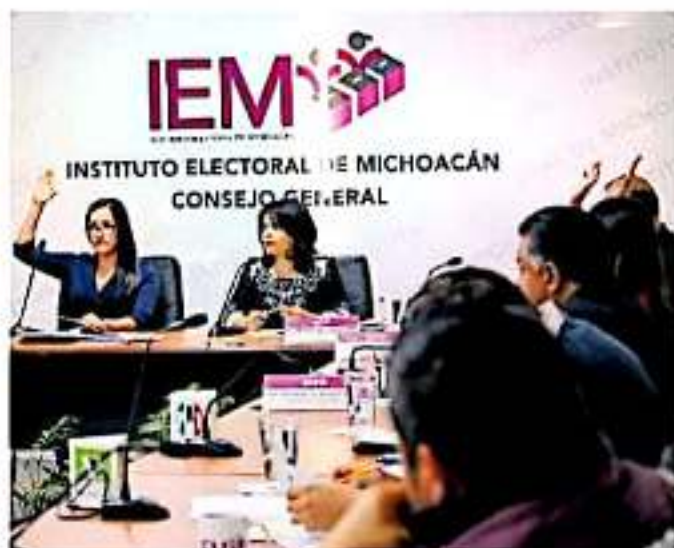
Cabe recordar que dicho financiamiento público total para los partidos políticos ascendió en 2020 a 189 mil 973 pesos.

Y con respecto al límite individual será