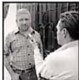
HABITANTES BUSCAN DEFENDER EL ESTADO LAICO EN EL MUNICIPIO.