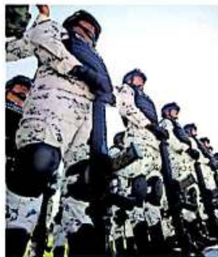
Propiciarán un radio de vigilancia de 60 kilómetros FERNANDO MALDONADO

ELECCIÓN DEL presidente de la CEDH y la de un comisionado del IMIAI, entre otros.