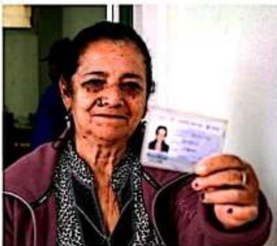
URUAPAN, MICH.- Actualmente el listado es de 11 mil 800 beneficiarios de la zona urbana, rural e indígena de Uruapan.