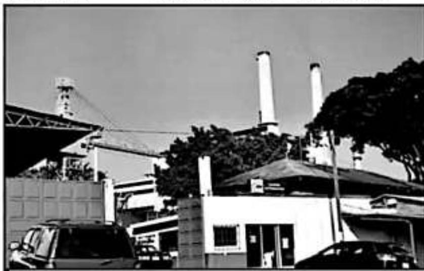
EL INGENIO AZUCARERO DE SANTA CLARA RETOMA SUS ACTIVIDADES LUEGO DE DEJAR SECAR LOS CULTIVOS.