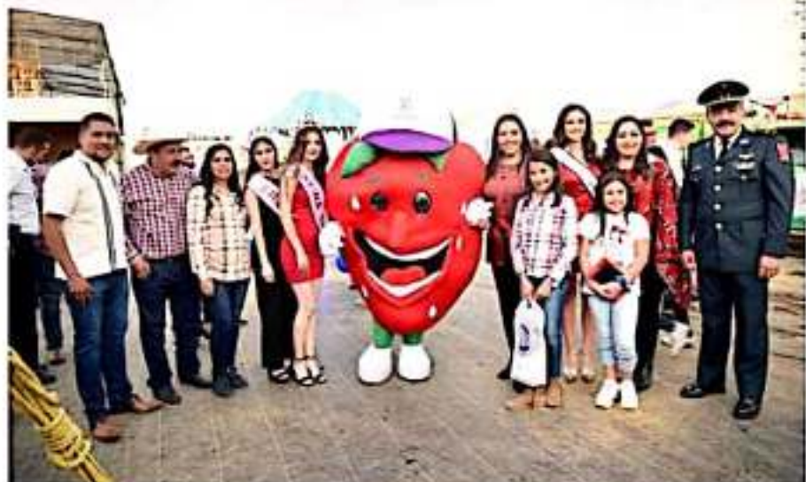
JACONA, MICH. - Recordó que la feria comenzó a realizarse hace 49 años en el municipio, y gracias a la iniciativa del gobierno municipal se retomó esta actividad.

En la explanada de las estrellas, se presentarán artistas de diferentes géneros, entre ellos: Los Tigres del Norte, María José, Mi Banda el Mexicano, Grupo Palomo, Lalo Mora, El Comediante J.J., Grupo Firme, para quienes deseen adquirir sus boletos podrán hacerlo en la Presidencia Municipal.