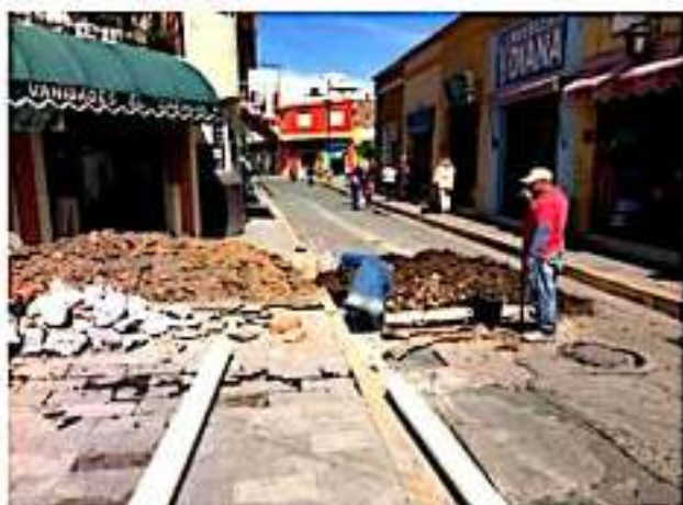
ZAMORA, MICH. - Sobre la calle Guerrero Oriente, se efectuó una importante obra de este tipo.