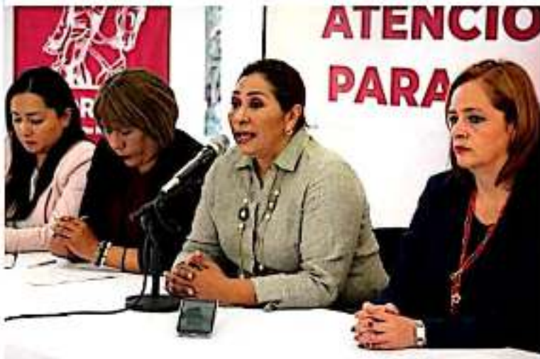
MORELIA, MICH.- Las jornadas se llevarán a cabo del 18 de febrero al 13 de noviembre de 2020.