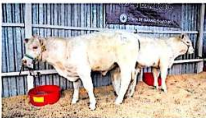
El municipio de Zamora se estaría colocando en los últimos sitios en el nivel de la producción ganadera estatal.

Lo anterior, dijo, obedece a la falta de apoyos, lo que ha llevado a la quiebra a muchos integrantes de la asociación, pues "no es rentable, ha dejado de ser un negocio para muchos", sin embargo siguen insistiendo en lo que ha sido su fuente de ingresos durante toda una vida, en espera de que vengan tiempos mejores y que existan más programas para elevar la competitividad.