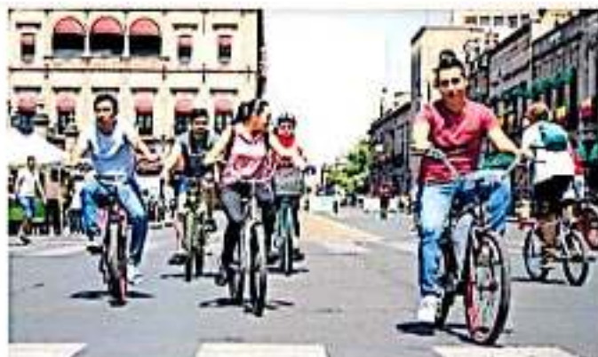
En Morelia, donde existen alrededor de 51 mil usuarios de bicicleta, ya se han sumado alrededor de 50 negocios nuevos

Tras el conflicto que cada domingo se vive entre estos dos sectores, el funcionario estatal reconoció que no ha recibido ninguna instrucción por parte de Aureoles Conejo, además de que los transportistas que cada domingo bloquean la vialidad