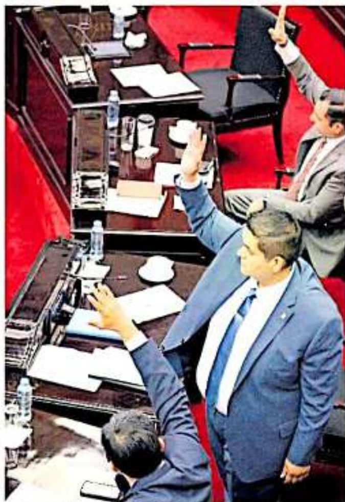
Se rememoró el tema de las glosas de cada una de las comisiones durante el debate.

Añadió también reconoció que se tiene pendiente "trabaja el avance del tratado de los residuos sólidos", sobre todo en materia del manejo de los plásticos dado que es un tema prioritario para Michoacán, en el que prácticamente "todo el país lleva un pleafilearse", y por tanto debe resolverse en este periodo.