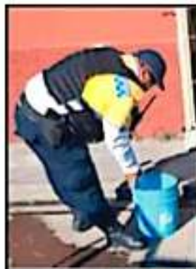
ELEMENTOS DE SEGURIDAD LIMPIAN LAS CALLES URUAPANENSES

La documentación señalada se recibe de lunes a viernes en el DIF Municipal ubicado en avenida Chilgus 521, colonia Ramón Fariás, de 8 a 14:30 horas.