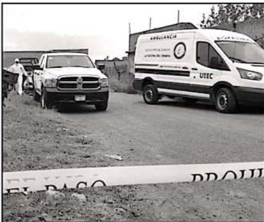
DE AQUELLO CON LAS AUTORIDADES, EL NARCOMENUDO Y CONSUMO DE DROGAS HAN INCIDIDO EN ALZA DELICTIVA.

arresto, son canalizadas a centros de atención juvenil o al Centro de atención Primaria en Adicciones (CAPA) para recibir terapia.