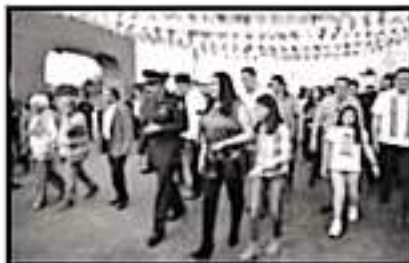
TRAS DISCURSO, CARDENAS SALUDÓ A LOS ASISTENTES