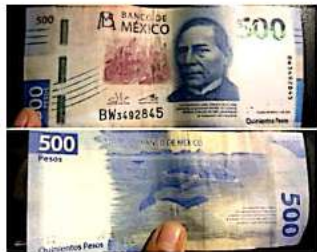
CD. LÁZARO CÁRDENAS, MICH.- Billete de 500 pesos falso detectado en Las Guacamayas, problema que ha comenzado a advertirse en este municipio, ya que el fin de semana fueron detectados 2 billetes apócrifos.

Por lo anterior, alertan a las autoridades de seguridad y a la población para que estén atentos de este tipo de billetes, que se proceda a revisarlos y comparar, así como denunciar a las personas que están cometiendo este tipo de delito.