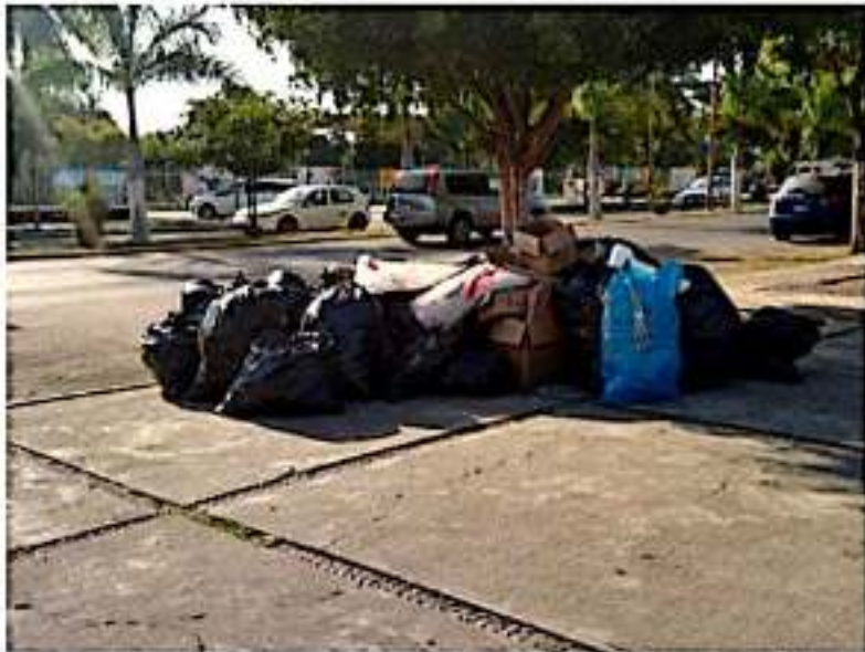
CD. LÁZARO CÁRDENAS, MICH.- Ciudadanos solicitaron la intervención de las autoridades municipales para la recolección de un gran número de bolsas de basura que fueron dejadas amontonadas en la explanada municipal por comerciantes.

■ Luego de la Expo Venta del Día del Amor y la Amistad