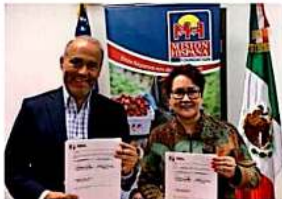
Semigrante y asociación «Misión Hispana Foundation», acuerdan acciones en favor de connacionales y sus familias.

También se promoverá la vinculación y organización de las asociaciones, grupos y clubes de migrantes michoacanos y la promoción de la cultura michoacana en Estados Unidos, a través de diversos eventos.