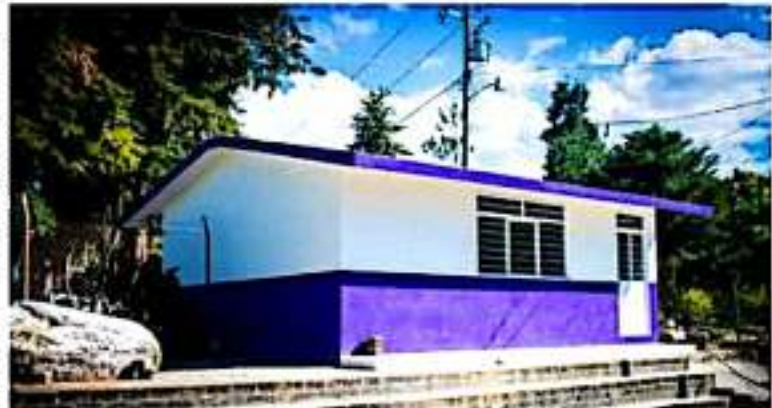
PERIBÁN, MICH.- Fue inaugurado un salón de usos múltiples en la localidad de La Fábrica.

Finalmente agradeció la confianza depositada en su administración por parte de los vecinos de la comunidad, quienes en diversas ocasiones manifestaron su gratitud a la edil peribanesa y a su equipo de trabajo.