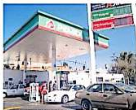
El gobierno federal gastó más en gasolinas que en medicamentos.

"Tras un subejercicio muy importante en el tema de salud, realmente castró el control que vemos todos los días con el Insabi, el INSSAI, el IMSS. En equipo de la labor no traximos un subejercicio de casi un mil 400 millones de pesos y en el tema de medicinas y productos farmacéuticos era mil 900 millones de pesos", detalló.