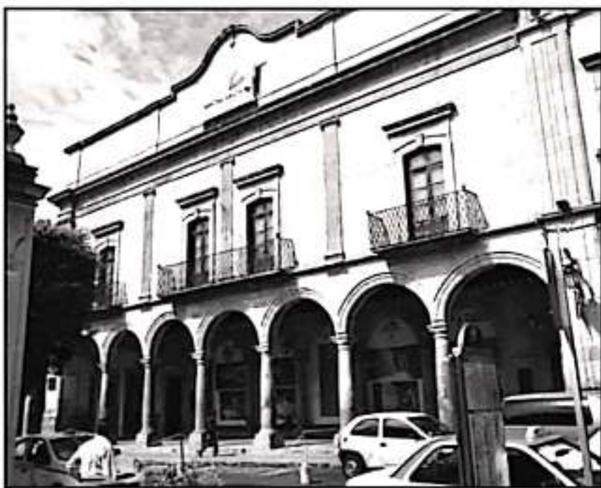
LAS OBRAS HAN MANTENIDO CERRADAS UNA SECCIÓN AMPLIA DEL PORTAL, AFECTANDO INCLUSO CONDOMINIOS

cluso por el avance tecnológico ya habría quedado en desuso. Equipos audiovisuales que se pagaron en miles de euros se hubrían echado a perder por no ser instalados en su momento, advierte.