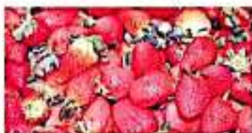
Un 80 por ciento de la producción total se va al extranjero, a FELIPE CASTRO.

"Esta región es puntera en el desarrollo e innovación tecnológica en el tratamiento de la