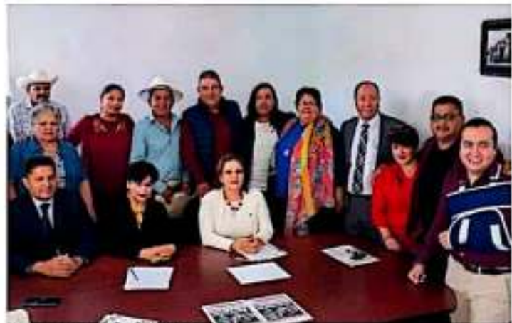
El primer grupo de trabajo de la Casa de Enlace Común.

Entrean diputados federales Casa de Enlace Común