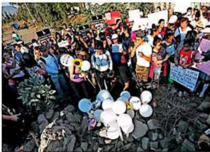
Vecinos de Tlalhuacalco, Nochebuena, se reunieron en el centro del pueblo para exigir justicia. Algunos incluso tomaron a cargo "autodefensas" tras el incremento de la violencia en la zona.