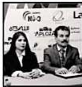
PLANEAR INTERCAMBIO ACADÉMICO CON TRES NACIONES

La zona extrema fue uno de los espacios que más diversión trajo a chicos y grandes, con juegos mecánicos para todas las edades, anexo a ello el circo, que presenta un excelente espectáculo de entretenimiento para toda la familia.