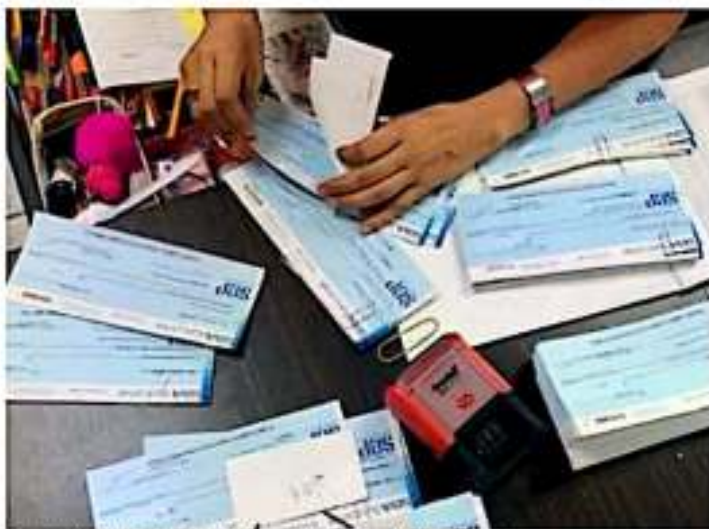
El empaquetado de despacho de la SEE no descarta que se sigan vendiendo plazas.

Aunque no descarta que esta práctica ilegal pueda seguir presentándose al interior del sector educativo en la entidad, dijo que no tiene, al menos hasta ahora, las pruebas fehacientes que comprueben los casos; por ello, pide a las personas que pudieran ser víctimas de la venta de plazas presentar las denuncias correspondientes tanto en el área jurídica de la SEE como ante la Fiscalía