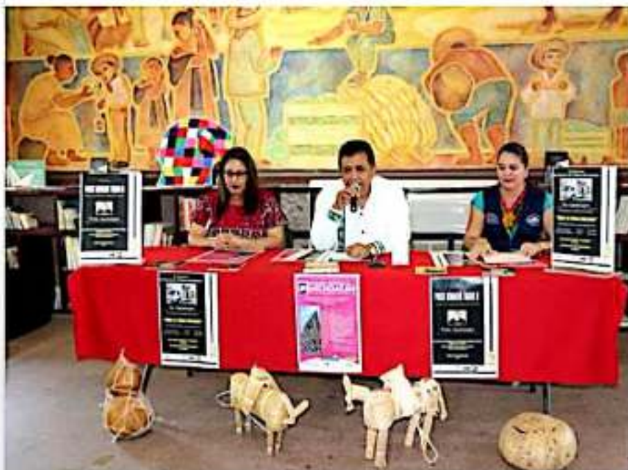
APATZINGÁN, MICH.- El alcalde informó que se tienen programadas diversas actividades culturales durante todo el día.