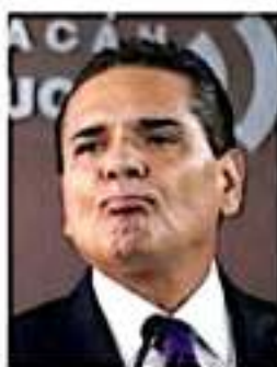
Silvano Aureoles Conejo.

4. Impulso a la capacitación y profesionalización del personal, otorgándole a la escuela