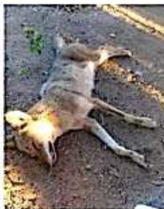
CD. LÁZARO CÁRDENAS, MICH.- Coyote hembra, localizada en Solera de Agua; según argumentos, bajan en búsqueda de comida a la franja costera siendo víctimas de accidentes.

Cabe destacar que este fin de semana se reportó por este mismo comité, a un ejemplar de coyote hembra, la cual estaba atropellada sobre la carretera costera a la altura de la comunidad de Solera de Agua, perteneciente a Lázaro Cárdenas, la cual aparentemente fue arrollada por un vehículo.