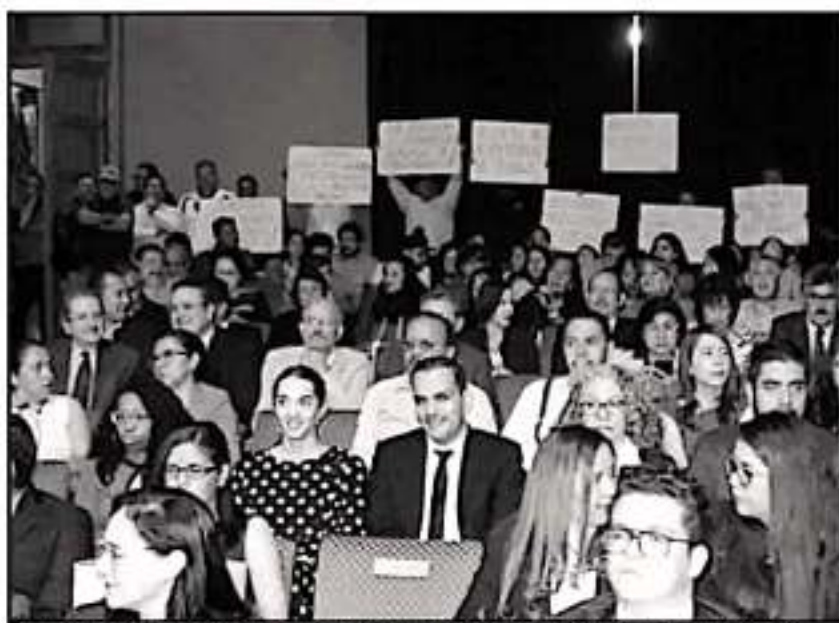
UN PEQUEÑO GRUPO DEL SUEUM SE MANIFESTÓ EN EL ACTO QUE PREPARABA RECTORÍA, AL FINAL SE SUSPENDIÓ