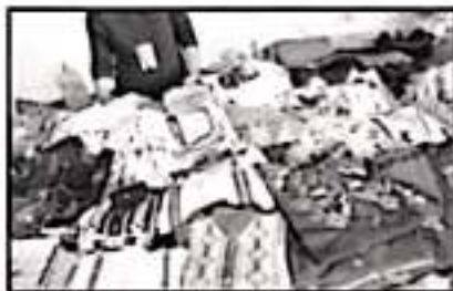
LOS ARTESANOS EXHIBEN VESTIMENTA DE LA REGIÓN

Las autoridades realizaron un recorrido por las instalaciones de la feria en el que pudieron apreciar la gran variedad de productos que se ofrecen, en especial los de los artesanos, productores y comerciantes de la región.