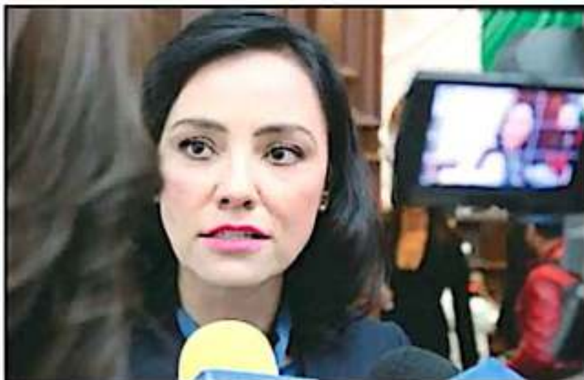
LA EXDEBERESA PARLAMENTARIA DEL PRI SE DESLINDÓ DE UNA ENCUESTA RUMBO A LA GUBERNATURA EN 2021.

de dejar la curul federal, pero la vida la llevó a permanecer en el Congreso local a través de la reelección legislativa.