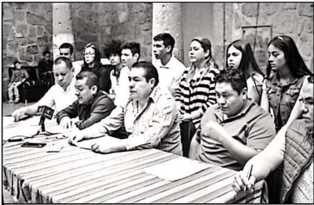
PESE A LA EXIGENCIA DE LOS DIRIGENTES DE LOS PLANTELES IRREGULARES NO HARRÁ RESPALDO A ESTOS ESPACIOS DE NIVEL BACHILLERATO

Apuntó que existe un Consejo de la Educación Media Superior en Michoacán, que es la instancia que primero valida en la planeación y valora a la apertura de nuevos centros de educación media superior con base en una convocatoria federal y estatal que detalla la posibilidad de nuevos planteles, por-