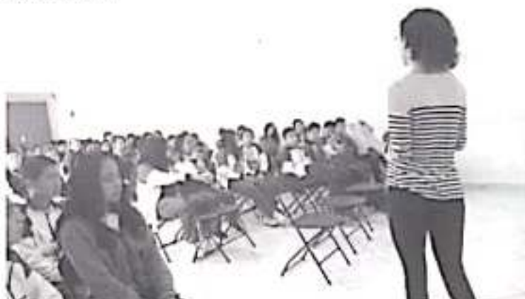
Los psicólogos y especialistas del Ijuvich, impartieron temas como: fomento de valores, control de emociones y proyecto de vida a cerca de 120 jóvenes.

De esta manera, el Instituto de la Juventud Michoacana visita los 113 municipios del estado para escuchar, atender las dudas y necesidades de las y los jóvenes, en busca de un desarrollo integral.