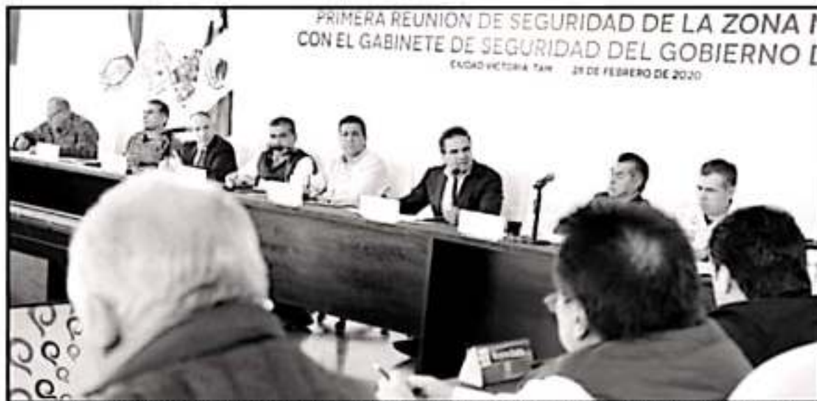
EL GOBERNADOR DE MICHOACÁN ENCABEZÓ LA REUNION DE SEGURIDAD DE LA CONAGO PARA LA REGION NORTE DEL PAIS, EN EL ESTADO DE TAMAULIPAS.

"Hay una ruta que se ha trazado en el marco de este encuentro tanto de la Gobernadores como del gabinete de seguridad federal. Logramos las bases para