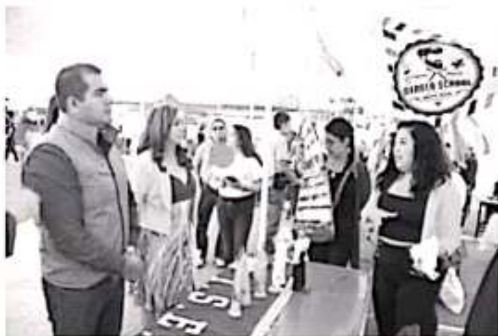
Fueron 40 instituciones educativas las que instalaron un stand en la explanada de la Plaza Cívica Licenciado Benito Juárez.

H Zitácuaro Michoacán, 26 de febrero de 2020 - Por Guadalupe Solache Rebollo. Mediante el evento denominado SEE Orienta, este 26 y 27 de febrero en Zitácuaro, miles de alumnos que están por egresar de la secundaria y preparatoria podrán conocer la oferta educativa existente a nivel local y regional.