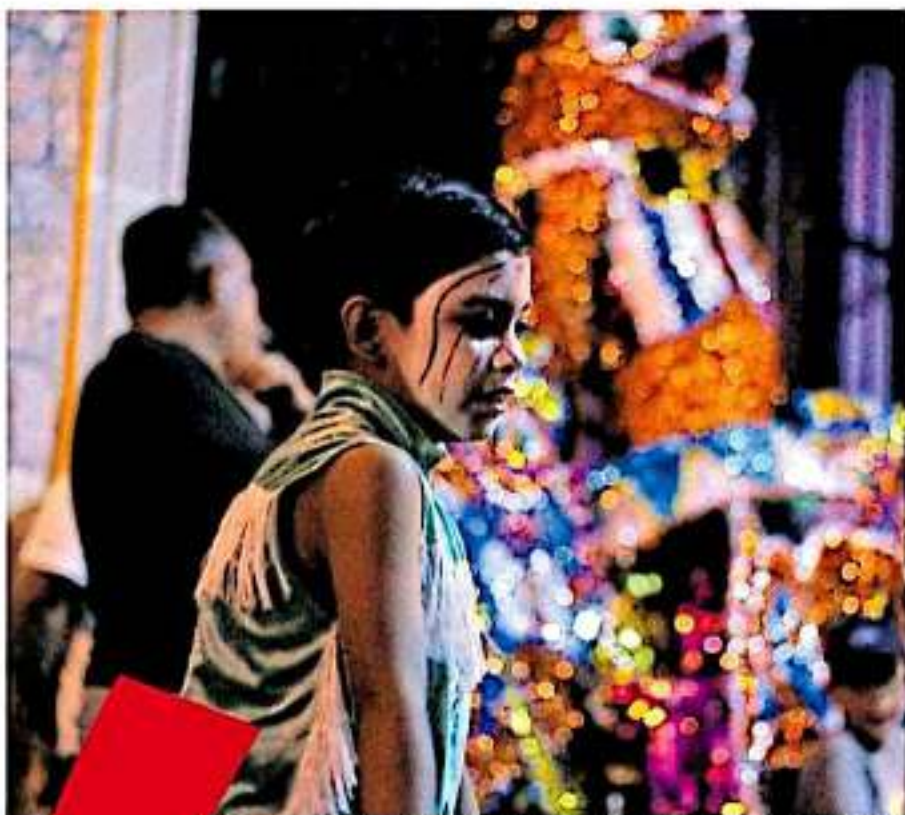
El Misterioso presume ser de uno de los toritos más tranquilos