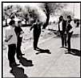
INICIARÁN EL MEJORAMIENTO VIAL EN COMUNIDADES PIEDADENSES.