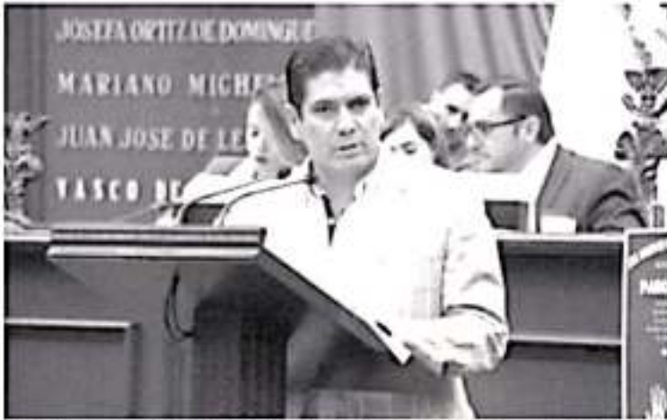
El diputado local considerara imprescindible exigir a las autoridades tomar las medidas de protección a la cadena de custodia para evitar la difusión ilegal de imágenes de víctimas.

- El diputado local propuso ante el Pleno legislativo una reforma al Código Penal estatal