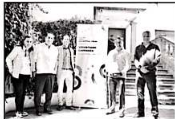
EL IDPEM PODRÍA ABRIR UN CENTRO REGIONAL PARA LA CERTIFICACIÓN Y EVALUACIÓN PARA ABOGADOS BILINGÜES EN EL ESTADO DE MICHOACÁN.

Hizo un llamado a todo el magisterio michoacano para construir junto con todos los padres de familia, las niñas y los niños, los jóvenes y la sociedad en general un gran acuerdo estatal por la educación pública, para armonizar el marco jurídico legislativo a través de la búsqueda de consensos.