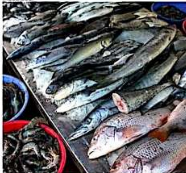
ZIHUATANEJO, GRO.- Piden regular los precios del pescado en esta temporada de Cuaresma.

Ante esta situación, ambos hicieron un llamado a la Profeco para que regule el precio de los productos marinos y no se abuse del consumidor, ya que esta dependencia no lleva a cabo revisiones en los puntos de venta para detectar incrementos indebidos.