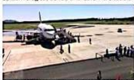
ZIHUATANEJO, GRO.- Aunque la persona con el virus puede llegar de muchas formas, la vía aérea es la más factible por la interacción de viajeros que convergen de muchos países al mismo tiempo.

Este fin de semana, el funcionario se reunió con el Comité Jurisdiccional de Vigilancia Epidemiológica, donde analizaron la situación