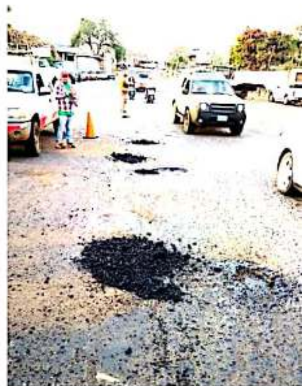
SANTA CLARA, MPIO. DE TOCUMBO, MICH.- El Ayuntamiento ha venido realizando trabajos de bacheo en la carretera a Jacona.