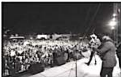
MILES HAN LLENADO DIARNO EL TEATRO DEL PUEBLO.

El domingo se contará con la participación musical de "Los Tigres del Norte", quienes han externado su emoción por estar presentes en una de las ferias más representativas del estado de Michoacán, la Feria de la Fresa en Jacona. Su costo es de 200 pesos para la zona general.