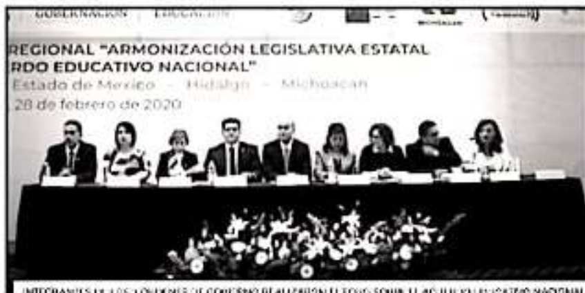
INTEGRANTES DE LOS JÓVENES DE GOBIERNO REALIZARON EL FORO SOBRE EL ACUERDO LEGISLATIVO NACIONAL.