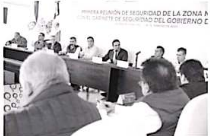
México tiene el enorme reto de recuperar la seguridad para sus ciudadanos y para avanzar de manera acelerada en la construcción de la paz, indicó el gobernador.

En el encuentro de trabajo, estuvieron presentes a alrededor de 40 asistentes, entre los que destacan los gobernadores de Nuevo León, Tamaulipas y Coahuila,