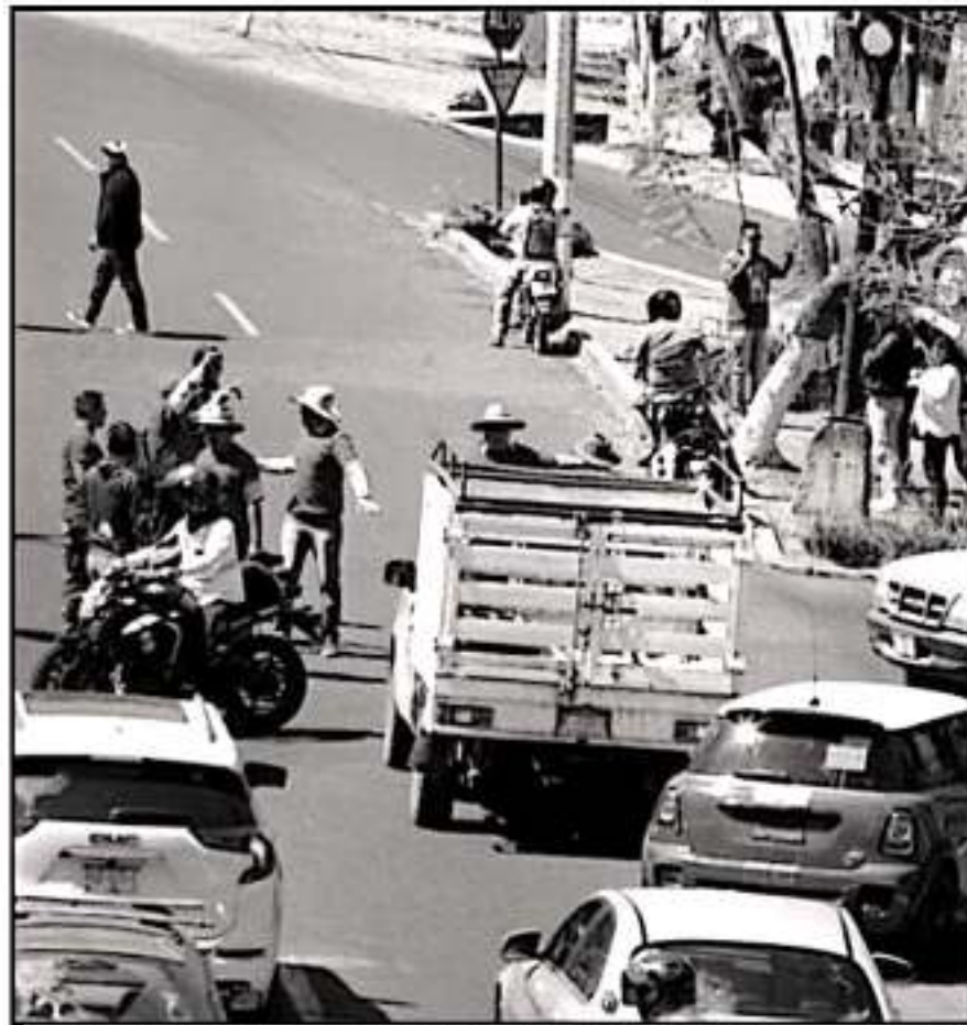
EL CONFLICTO INTERNO DE LA CNTE MANTIENE LATENTE EL AMARDO DE PROTESTAS, MANIFESTACIONES Y QUEBRES VALES.

El docente, procedente de la región Zacapu, la cual lo respaldó fuertemente durante este proceso de elección, fue de los liderazgos que fueron acusados por el grupo antagonista, que también celebró su Congreso Seccional el lunes pasado, por