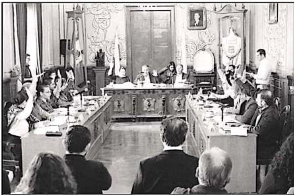
EL CABILDO PUE GARANTIZAR QUE SIENDO OFICIAL NO SE SANCIONARÁ A NINGUNA TRABAJADORA DEL AYUNTAMIENTO QUE PARTICIPE EN EL PARO EL 9 DE MARZO

La integrante de este cuerpo colegiado dio a conocer que el pronunciamiento fue compartido a las demás mujeres regidoras de Morelia, quienes dieron su respaldo al mismo previo a la aprobación que se llevó a cabo en el