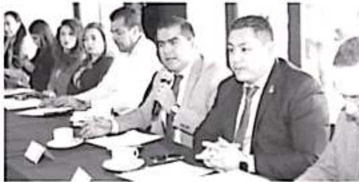
Los acuerdos fueron: reactivar los módulos de atención en los municipios, ampliar la capacitación al personal del Gobierno, ampliar también el presupuesto para acciones de atención a las mujeres.

Morelia, Michoacán, a 27 de febrero de 2020.- Hugo Alberto Hernández Suárez, presidente municipal de Zitácuaro, asistió a la sesión del Consejo para Prevenir, Sancionar y Erradicar la Violencia contra las mujeres, la cual estuvo encabezada por el gobernador de Michoacán, Silvano Aureoles Coeja, en la capital michoacana. Es importante señalar, que de los municipios involucrados con la Agenda de Género, hasta ahora, Zitácuaro, es el que mayor cumplimiento tiene en los distintos estándares establecidos para combatir el maltrato hacia la mujer.