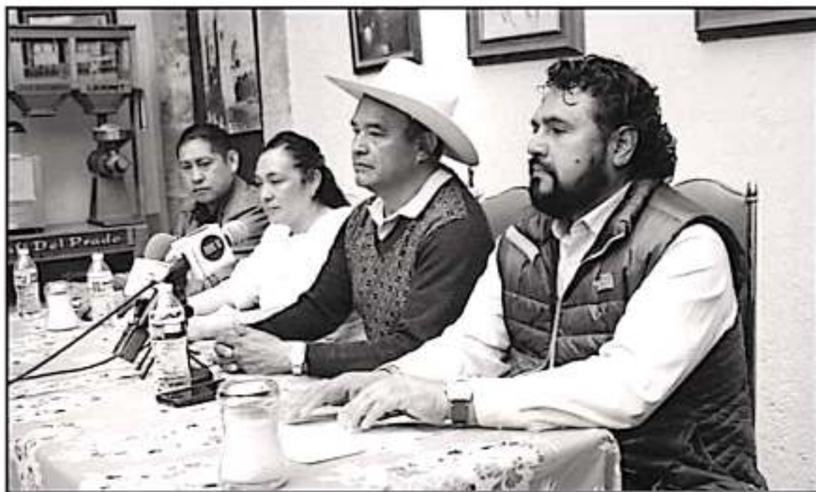
INTEGRANTES DE LA COMUNIDAD DE CHERANÁSTICO ADMITEN EN REUNIÓN DE PRENSA QUE BUSCARÁN LA AUTONOMÍA PARA MANEJAR SU PROPIO PRESUPUESTO

nerados por los manifestantes. No obstante, en videos grabados por los mismos pobladores de dicha demarcación, dejaron claro que al menos puertas de madera y vidrios fueron destruidos.