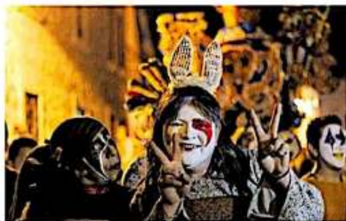
La banda de viento toca unas primeras notas al aire como para calmar los ánimos de la multitud.

Es el último día del carnaval antes de que el Misterioso tenga una fregada y se vaya a descansar por un rato. Los colores lo saben y por eso han adornado la calle al grado de que los automovilistas optan por tomar vías a hornas.