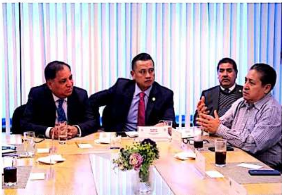
CIUDAD DE MÉXICO.- Carlos Torres Piña, presidente de la comisión de vivienda en la cámara de diputados, en reunión con diversas personalidades del programa federal "Tu Casa en la Ciudad".

Y sobre el bacheo 2020, el edil remarcó que ya se ha dispuesto 15 millones de pesos para iniciar con los trabajos antes de la temporada de aguas, además remarcó que una vez iniciadas las precipitaciones, se podrá disponer de más recursos para tal efecto.