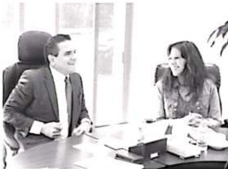
El gobernador reitera todo su apoyo para trabajar de manera coordinada con la Federación, para dar solución y atención a las necesidades de las mujeres y hombres que habitan las comunidades indígenas.