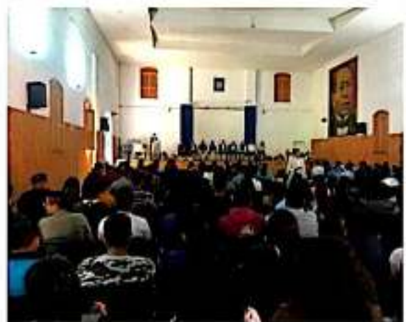
URUAPAN, MICH.- Con una serie de conferencias en el auditorio de la Facultad de Agrobiología "Presidente Juárez", se conmemoró en esta ciudad el Día del Agrónomo.

Este último explicó la importancia de llevar a cabo actividades encaminadas a la innovación en materia educativa, comercial y laboral.