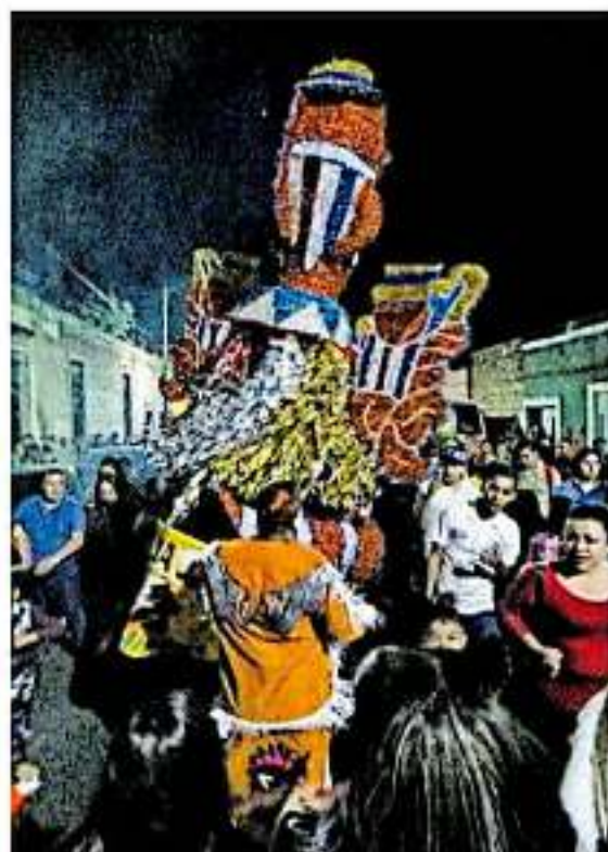
Al son de la primera tonada, una maringüita se persigna y comienza a bailar

"Gracias a él nos conocemos con mucha gente de la colonia y de diferentes generaciones"