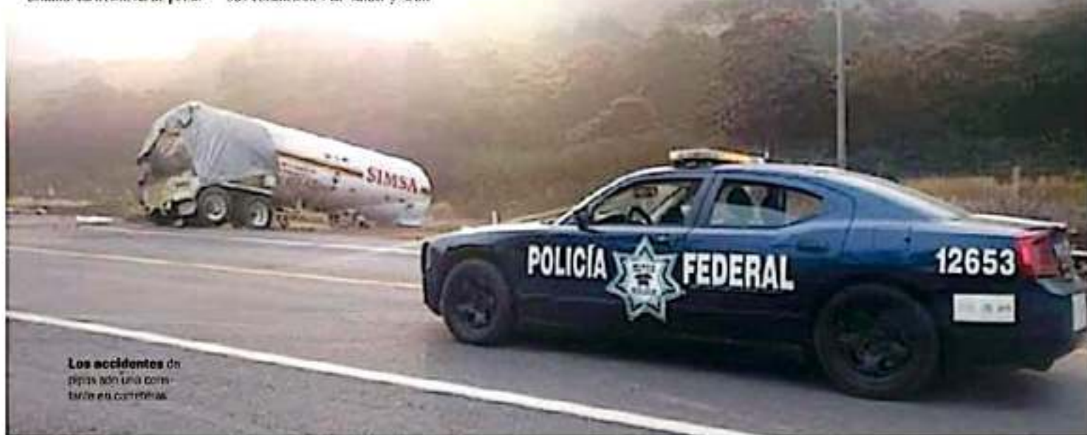
Los accidentes de pipas son una constante en carreteras.

Al respecto, el titular de la Secretaría de Gobierno de Michoacán advirtió que se revisarían con las autoridades federales la situación en torno al tránsito de materiales peligrosos, así como acciones para informar a la ciudadanía y a las autoridades que tipo de materiales se están transportando, en caso de algún percance.