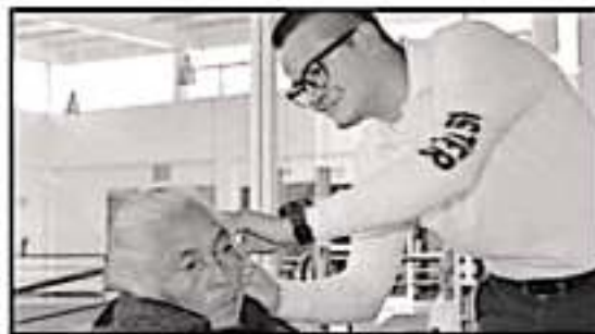
EL PRÓXIMO 12 DE MARZO DIRIGIRÁN SERVICIOS DE SALUD AUDITIVA PARA LAS PERSONAS CON ESE TIPO DE PADOCIMIENTO EN LA PIEDAD.

Salazar Zaragoza, puntualizó que de 08:00 de la mañana a 2:00 de la tarde se atenderán a las personas que vayan por primera vez y de 2:00 a 4:00 aquellas que ya cuentan con auxiliares. Para mayores informes, los interesados en el servicio pueden comunicarse al teléfono 52 201 22.