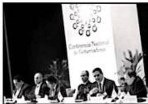
EL LAS DIFERENTES REUNIONES, GOBERNADORES CERRAN FILAS PARA ATENDER LOS TEMAS DE SEGURIDAD DEL PAIS.

CONAGO URGE MERMAR RECURSOS A DELINCUENTES