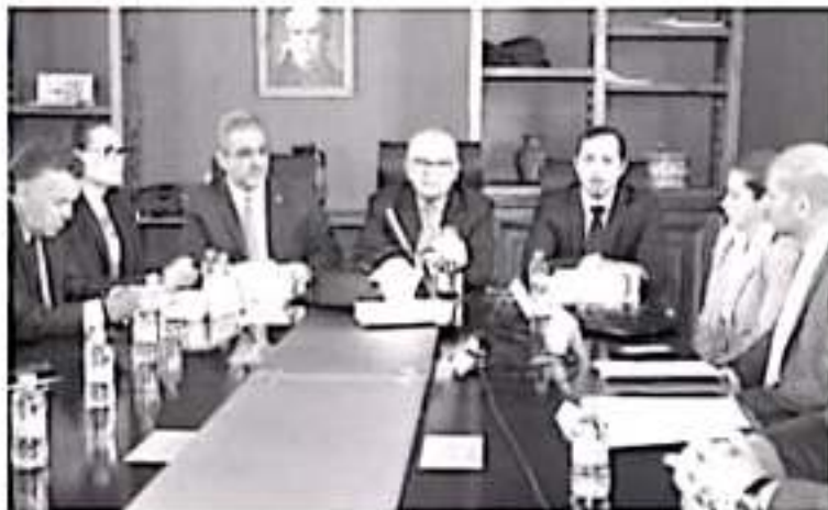
Las instituciones bancarias Banorte y Banbajío, resultaron ganadoras de la Licitación para la contratación del empréstito que será dirigido en su totalidad al rubro de Inversión Pública Productiva.

Morelia, Michoacán, a 27 de febrero de 2020 - Resultado de los análisis efectuados a las ofertas enviadas por cinco instituciones bancarias, el Gobierno de Michoacán, a través de su Secretaría de Finanzas y Administración (SFA) informa que las instituciones bancarias Banorte y Banbajío, resultaron ganadoras de la Licitación para la contratación del empréstito que será dirigido en su totalidad al rubro de Inversión Pública Productiva.