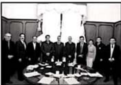
DESDE INICIOS DE AÑO SE PLANTEARON LAS REUNIONES EN LAS DIFERENTES REGIONES PARA ATENDER EL TEMA DE SEGURIDAD.