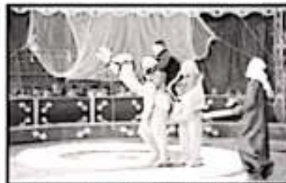
MILES DE JACONA FIERON CON EL CIERRO DE LA FERIA.