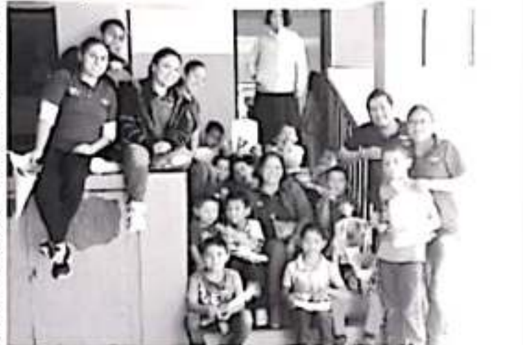
Este centro tiene como población objetivo a niños, niñas y adolescentes de 6 a 17 años que presentan algún riesgo pedagógico, psicológico o lenguaje, por ejemplo: acoso escolar, bullying, drogadicción, embarazos no deseados, trabajo infantil.

Actualmente funciona en un horario de 9 de la mañana a 4 de la tarde con un total de 11 personas. «Por los problemas que se viven ahora en las escuelas por la llegada tardía de los padres, hemos ampliado el horario por la tarde para dar la atención, hasta ahora ya nos han venido a dejar en resguardo a dos menores pero sus papás han venido de inmediato al saber que se