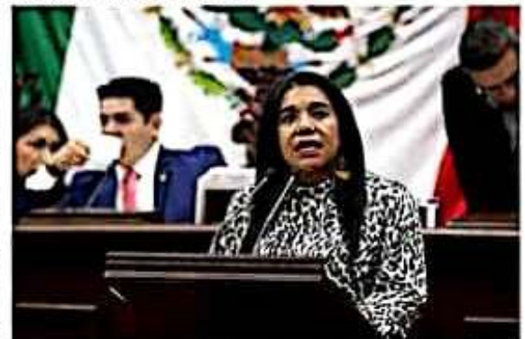
La diputada Wilma Zavala Ramírez, propuso reformas al Código Penal del Estado, agravando penas para el delito de feminicidio.

no, a fin de combatir de manera integral dicha violencia, y lamentó que la violencia contra de las mujeres continúe creciendo y que no sean suficientes ni contundentes las acciones en México.