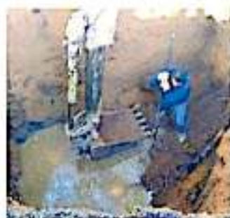
Esta es la segunda vez que se da esta situación.

Finalmente, llamó a los transportistas a sumar voluntades para resolver el conflicto, ya que consideró "no se los genera mayor afectación".