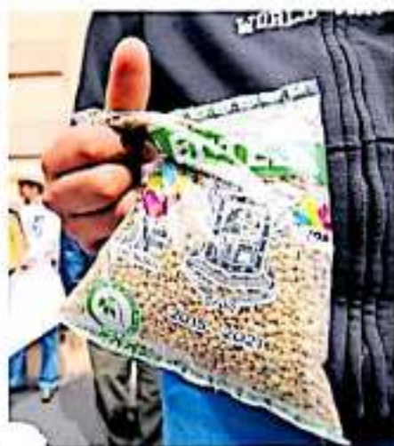
Un grupo de productores de lenteja se manifestaron en las inmediaciones del Congreso.

Es de mencionar que Mibocacán produce alrededor de ocho mil toneladas de lenteja al año, siendo el municipio de Cocula el que lidera la producción.