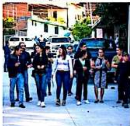
PERIBÁN, MICH.- Se inauguró la pavimentación de la calle Privada de Arroyo.

agradecieron a la alcaldesa el que por fin se haya realizado la pavimentación de la calle la cual señalaron era una gran necesidad.