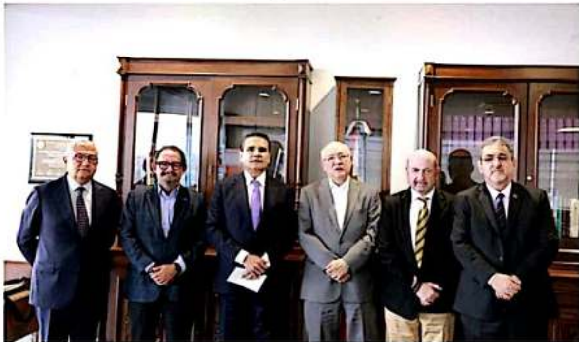
La transparencia y rendición de cuentas son ejes para que Michoacán siga por buen camino, dijo Silvano Aureoles al reunirse con titular de la ASF.

Reiteró que el gobierno en Michoacán seguirá transitando por el buen camino de dar cuentas claras a las y los michoacanos, para que todos conozcan las acciones que desde el Ejecutivo se desarrollan por el bien del Estado.