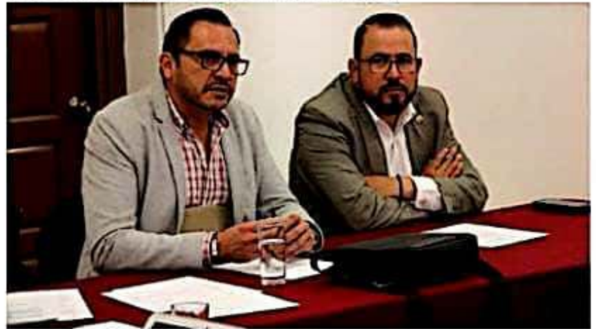
La Comisión de Fortalecimiento Municipal y Límites Territoriales, elaboró el dictamen de la Glosa del Cuarto Informe de Gobierno para que sea aprobada en próxima sesión.

apartado sobre desarrollo y fortalecimiento municipal.