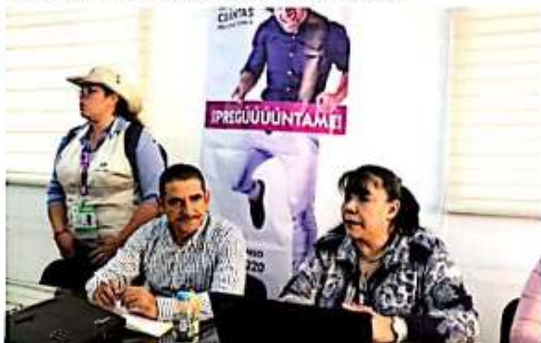
APATZINGÁN, MICH.- En rueda de prensa se explicaron los procedimientos que habrán de seguirse durante 4 semanas que durará el censo.