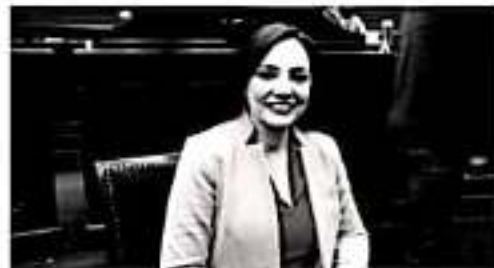
MORELIA, MICH.- Eliminar la alienación parental como una forma de violencia familiar permitirá garantizar los derechos humanos de niñas, niños y adolescentes.

Lo anterior, tomando en cuenta que en la mayoría de los casos los niños, niñas y adolescentes a los cuales alguno de sus progenitores haya procurado su alienación, se encuentran en gran medida emocional con él o ella, consecuentemente la prisión de éste generaría únicamente un agravamiento de las circunstancias que han motivado su alienación, aumentando el rencor hacia el otro ascendiente que se encuentra frente al alienante.