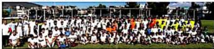
LOS REYES, MICH.- Con éxito se efectuó ayer una visoría del Club América, en el campo Nacozari.

Indicó que sin el apoyo del alcalde no habría sido posible esta actividad, la cual no solo es un escaparate si un aliciente para quienes manejan niños en clubes y escuelas de fútbol. El siguiente paso, una vez que el visor defina perfiles, sería una segunda ota que podría ser en la capital del país o bien regresar él personalmente para observar más detenidamente a los prospectos.