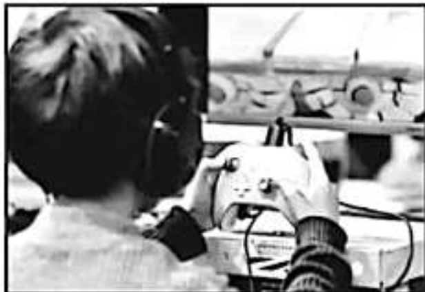
ESTE AÑO EL INNOVATION FEST CONTARÁ CON UNA ARENA GAMER, EN DONDE SE PREPARARÁN VARIAS ACTIVIDADES EN TORNO A LOS JUEGOS DE VIDEO.

Los organizadores y participantes aprovecharon la oportunidad para señalar la importancia de los videojuegos y la equivocación de que se estigmatice como fuente de la violencia entre los jóvenes,