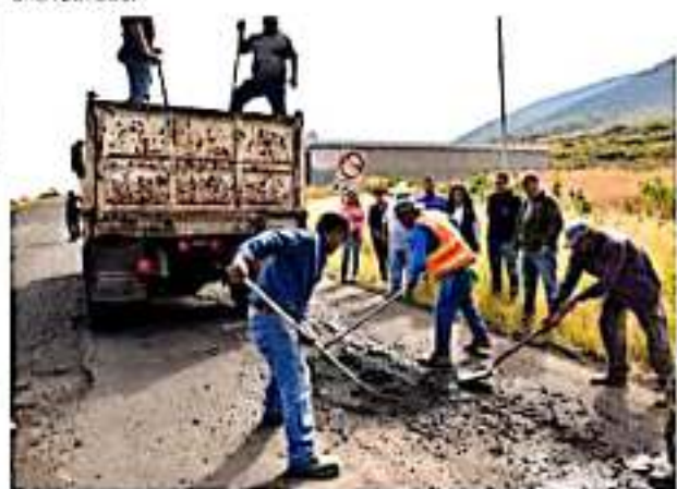
JACONA, MICH.- Adriana mencionó que el objetivo de esta labor, es tomar una alternativa de manera momentánea.

Agradeció a la Dirección de Obras por apoyar en la ejecución de las acciones y aseguró que continuará tocando las puertas necesarias para ver cristalizado un proyecto que todos los jacconenses desean sea una realidad.