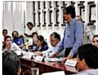
CD. LÁZARO CÁRDENAS, MICH.- En sesión ordinaria de Cabildo, el Órgano de Gobierno autorizó la extensión de horario en al menos 36 negocios, los cuales estarán sujetos a inspecciones por parte de Reglamentos Municipales.