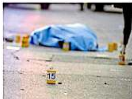
Un saldo de más de 10 muertos se dio sólo en la primera quincena de febrero.

"La Fiscalía ha estado reconociendo que varias de las personas fallecidas han estado bajo el influjo de alguna droga, desde nuestro modo de justicia cívica, el