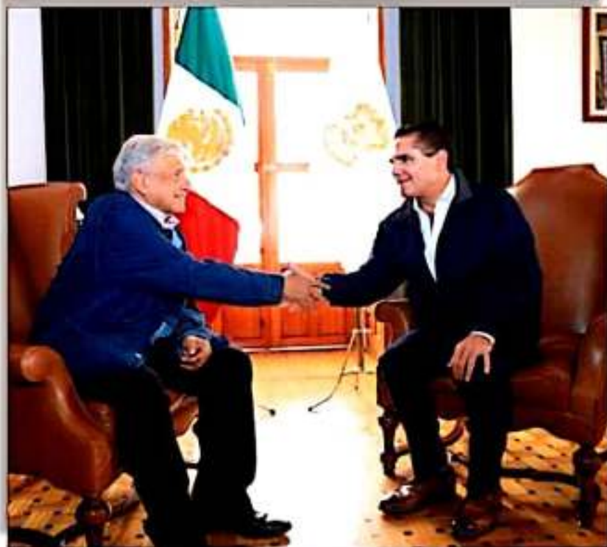
El Presidente AMLO estará este viernes en Michoacán.