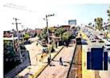
Se acordó modificar el proyecto de 89 millones de pesos. (SEDATU)

El recién nombrado delegado de la SEDATU en Michoacán, expuso a los habitantes de la zona que la ciclovía estaba proyectada desde el inicio del proyecto por lo que, dijo, se consue-