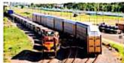
CD. LÁZARO CÁRDENAS, MICH.- La ferroviaria Kansas City Southern dejó de anunciar su máxima inversión en esta ciudad, a la que ha aspirado en el presente siglo.

Cuando KCS planteó la nueva terminal, el tren movía el 70 por ciento de la carga de contenedores; hoy opera el 50 por ciento y el resto se mueve por carretera; entonces el puerto operaba sobre 700 mil contenedores al año pero en la actualidad este volumen casi se duplica.