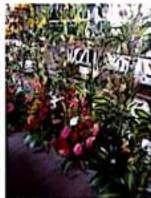
CD. LÁZARO CÁRDENAS, MICH.- Este viernes, floristas y comerciantes esperan un repunte de un 80 por ciento en las ventas por motivo del Día del Amor y la Amistad.

Cabe destacar que desde este jueves se ha dado un pequeño incremento con las compras anticipadas y pedidos anticipados de los regalos que este viernes se estarán obsequiando a las parejas de esta ciudad.