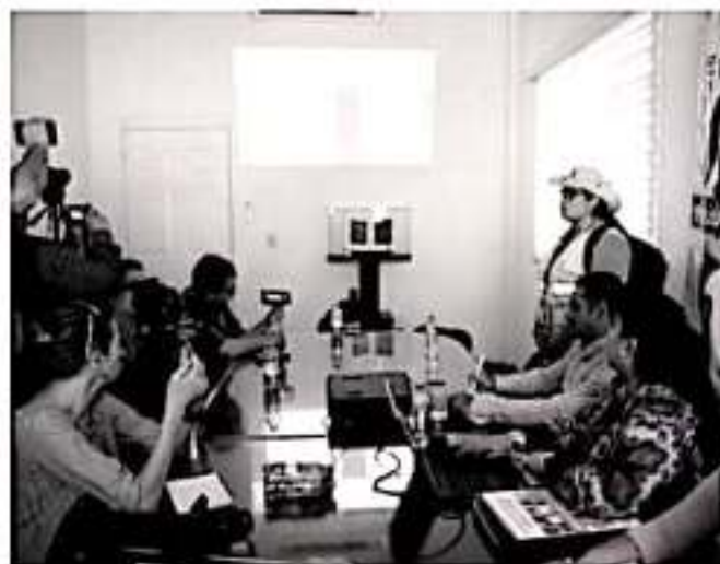
APATZINGÁN, MICH.- En dos semanas iniciará el Censo de Población y Vivienda 2020, por lo que autoridades municipales y la coordinación estatal del Inegi, invitaron a la población a participar en este evento.