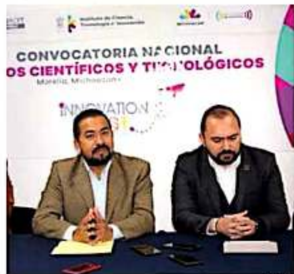
La Gamificación o ludificación, es una tendencia creciente en el mundo y se refiere a la aplicación de técnicas, elementos y dinámicas propias del ocio y los videojuegos que se aplican en actividades no recreativas, se dijo en Innovation Fest 2020.