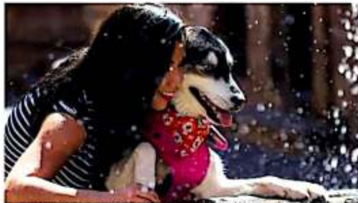
Sentir afecto por una mascota puede influir de manera positiva, coinciden expertas.