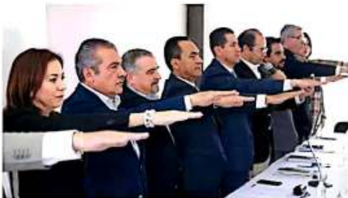
El presidente municipal asegura que se fortalecerá el trabajo de proximidad a través de la Policía Morelia.

Sobre los homicidios que han ocurrido en Morelia, dijo que es un tema que, "sin duda, hay que atender de manera conjunta", con la intención de coadyuvar en su construcción, a través de la denuncia y de