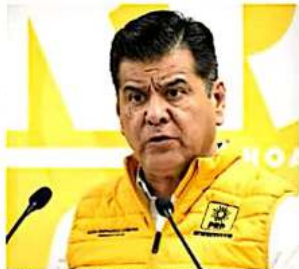
Todo el apoyo del CEE-PRD a la familia de la víctima, dice el líder estatal del Sol Azteca.

Para finalizar pidió a las autoridades competentes el esclarecimiento de los hechos y dar con él o los responsables.