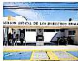
Hasta el momento se han registrado dos casos. (APREMIADO MALDONADO)

ron, quienes han aspirado o quienes están dentro de ese contexto para aspirar a este espacio, tienen elementos rescatables, algunos en campo, como su servicio y otros en la academia, ningún es desdénable", remarcó. Consideró que el nuevo ombudsman tendrá que atender de inmediato la difícil situación que se vive en la entidad con la violación recurrente de derechos individuales y colectivos. "Y me parece que es muy necesario que ya se designe", señaló.