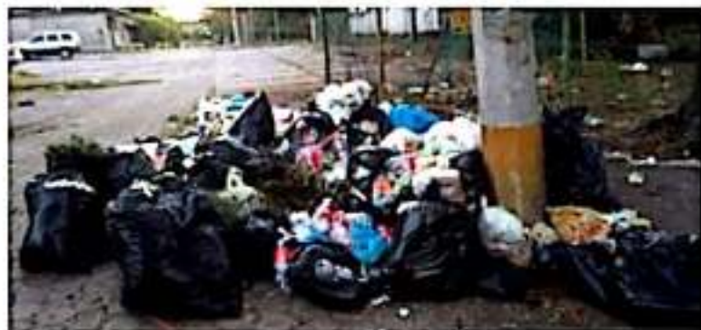
CD. LÁZARO CÁRDENAS, MICH.- Basura genera mal aspecto, olor y propagación de moscas y mosquitos en los alrededores.

Los inconformes refieren que la basura proviene de los departamentos de elementos de Marina y vecinos de calles aledañas, que ante la ineficiencia de la recolección de basura se ven "obligados" a sacarla de sus hogares, sin embargo, no se dan cuenta del daño que hacen a los demás con esta práctica, por ello la urgencia de un contenedor para que ahí se deposite todo este cúmulo de basura.