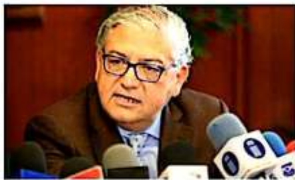
El titular de la SFA detalló que entre los factores clave que apoyaron la calificación de Michoacán, se encuentra la estabilidad y transparencia de sus ingresos.

El titular de la SFA detalló que entre los factores clave que apoya-