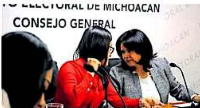
En la convocatoria la única restricción fue que no hayan sido antes consejeros del IEM. (ABRIGO)

Conforme al portal oficial del INE, los aspirantes que cumplieron los requisitos de elegibilidad para el cargo de consejero