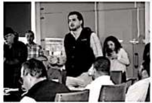
URUAPAN, MICH.- Autoridades municipales, ejidatarios, comuneros e industriales de la madera, se sumaron a las acciones de prevención y combate contra incendios forestales.