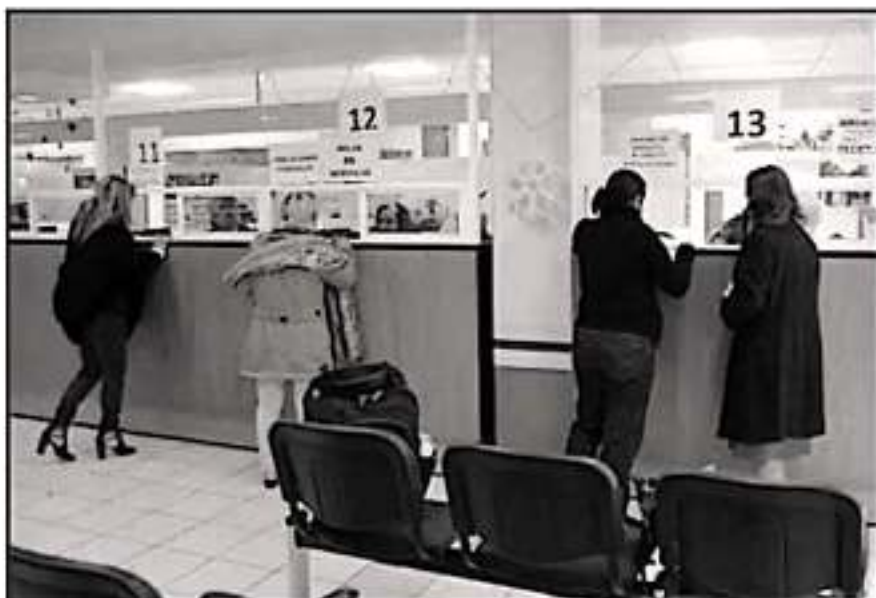
SE DEBEN TODAVÍA PAGOS DEL AÑO PASADO A DOCENTES DEL NIVEL MEDIO SUPERIOR Y SUPERIOR EN MICHOACÁN

Indicó que en conjunto trabajan en que se resuelvan todos los problemas y desde la mesa técnica no dejarán que estalle un paro de labores. "Entonces siento que la semana que viene va a haber muchos avances ya, por que van a empezar las mesas técnicas en cada uno los sindicatos",