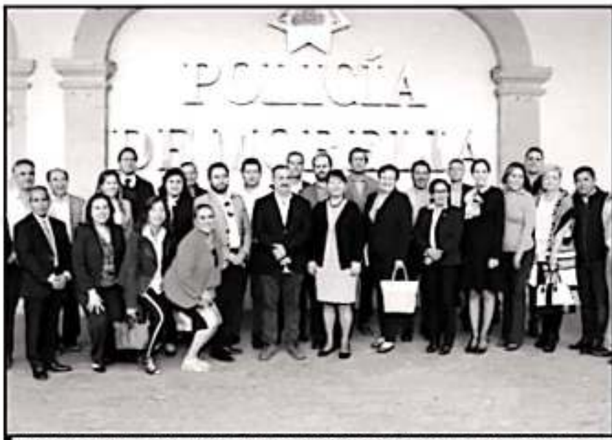
LOS NUEVOS INTEGRANTES DE LA MESA CIUDADANA DE SEGURIDAD INICIARÁN CON LA REVISIÓN DE LOS ACUERDOS

lía Metropolitana con Álvaro Obregón, Tarímbaro y Charo, para poder tener una política más amplia de un territorio municipal".