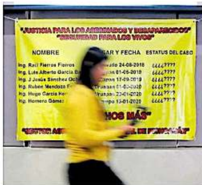
Más de 20 organizaciones sociales y académicas exigieron a los tres niveles de gobierno justicia por los asesinatos.

Además a ello denunciaron que suman tres personas del rubro que han sido secuestrados o están en calidad de desaparecidos en los municipios de Uruapan, Patzcuaro y Morelia, pero que por decisión de sus familiares los casos se mantuvieron en el anonimato.