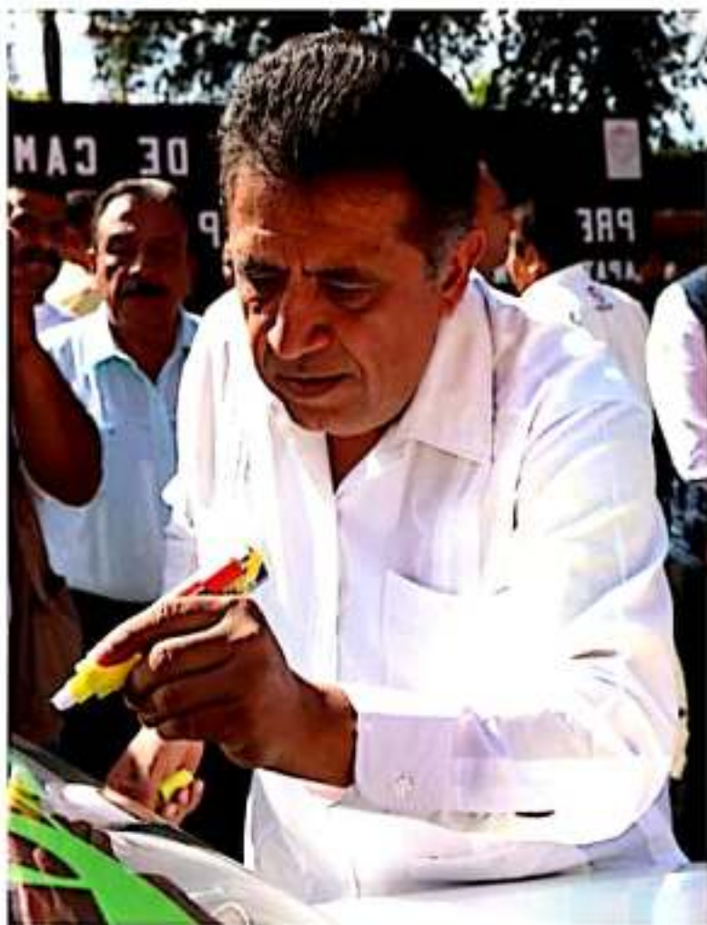
APATZINGÁN, MICH.- No solamente se mejorará la imagen urbana, sino que se evitarían problemas de salud.

Cabe destacar que el presidente municipal, pintó los vehículos del transporte público, los cuales al circular por toda la ciudad, reforzarán la campaña "Por un Apatzingán Limpio".