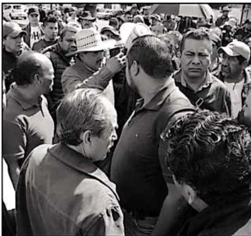
EN LOS ÚLTIMOS DÍAS HA PERSISTIDO UN CLIMA INCLUSO DE VIOLENCIA IMPULSADO POR DISIDENTES DE LA CNTE.