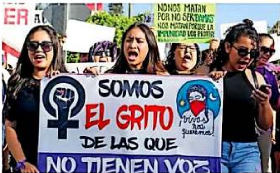
Colectivos lentistas marchando en contra de la violencia de género.