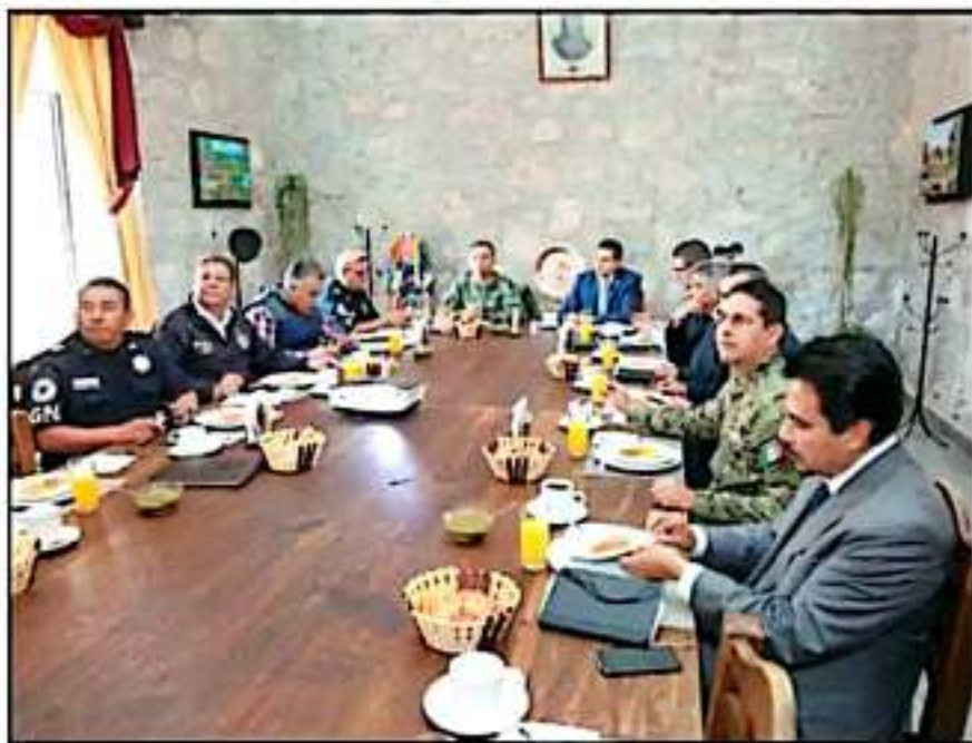
SE REUNIÓ ESTE LUEVES EN MORELIA LA MESA DE COORDINACIÓN PARA LA CONSTRUCCIÓN DE LA PAZ EN MICHOACÁN.