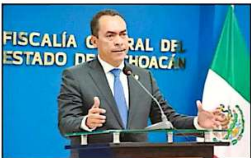
EL FISCAL GENERAL DEL ESTADO, SEÑALÓ QUE PARA AVANZAR ES NECESARIO TRABAJAR GOBIERNO Y SOCIEDAD

Por tal motivo, inspectores de la citada dirección se desplazaron noche de ayer al negocio en cuestión, para proceder a su clausura y aplicar el debido proceso ante este tipo de faltas. El Ayuntamiento de Morelia reprobó y no tolerará ningún acto de características violentas en este tipo de espacios.