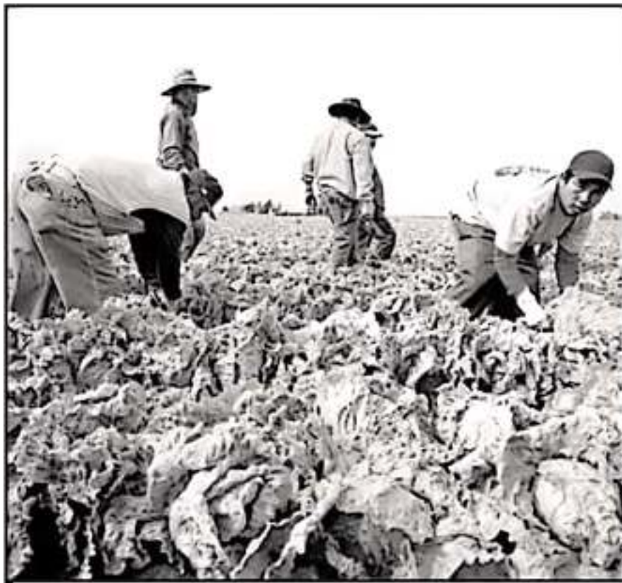
HIJOS DE MIGRANTES MICHOACANOS TIENEN ARRIVO DE EUA PARA QUE SE ADAPTEN A LA VIDA ACADÉMICA