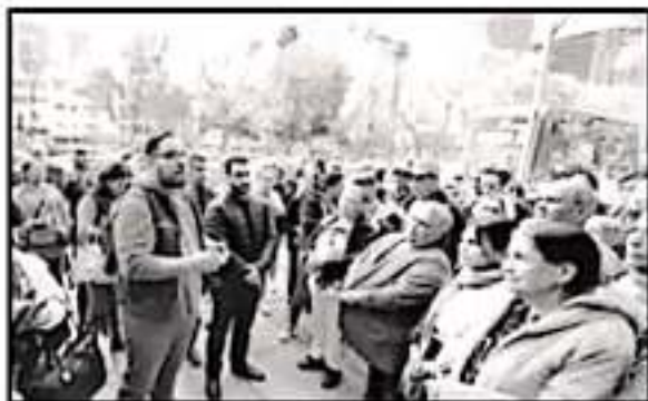
ORIENTAN A MADRES DE FAMILIA PARA QUE SE REENCUENTREN CON SUS HIJOS

Manifestó que este programa es financiado por el gobierno federal de los Estados Unidos y está diseñado para apoyar a los estudiantes de primer año de las familias migrantes o de los trabajadores agrícolas, sin importar el estatus migratorio de los padres o el lugar de nacimiento de los menores.