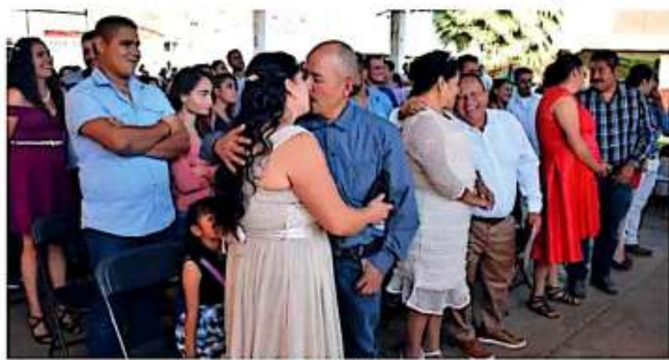
El mes próximo para celebrar matrimonio es diciembre, según los datos de Registro Civil del estado. COMTUA

En marzo es cuando más divorcios se registran en la entidad, de acuerdo con los datos de Registro Civil