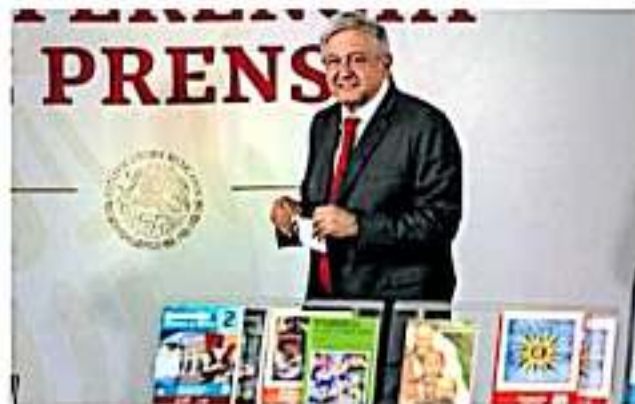
Arribará a la entidad procedente de Guanajuato.

La agenda que tendrá el titular del poder Ejecutivo federal en Michoacán, que ambará procedente de Guanajuato y Jalisco, iniciará a las 14:30 horas con la inauguración del cuartel