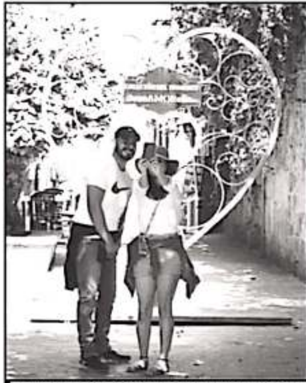
EL CALLEJÓN DEL ROMANCE EN MORELIA ES DE LOS LUGARES MÁS VISITADOS.