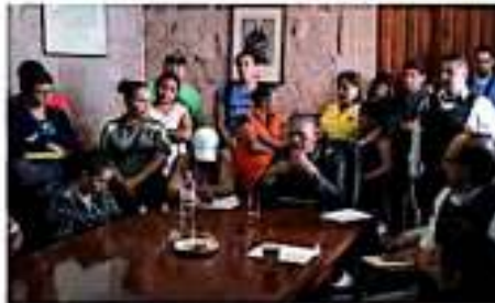
Autoridades municipales se reunieron este jueves en veedores de la avenida Mateo Pimentel, donde se lleva a cabo la reconstrucción de los frentes de dicha avenida. Autoridades de la Secretaría de Transportación acelerar los trabajos y mejorar en las mejores condiciones la zona para las ventas y comercios. GUAYMAS