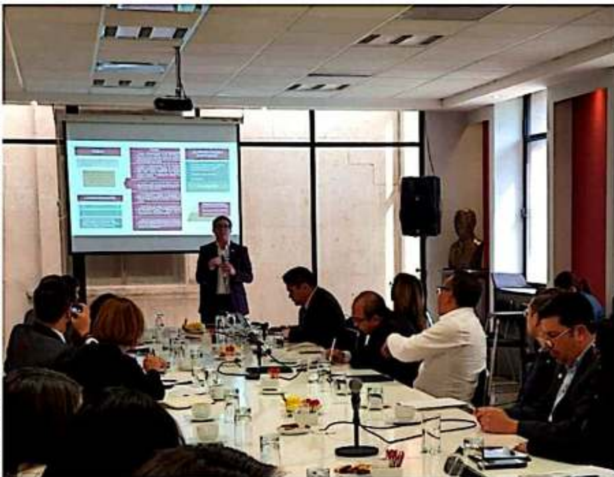
Gestiona Seimujer recursos federales para la atención a la Alerta de Violencia de Género.

«Tenemos que transitar en las políticas públicas, atender a los generadores de violencia, por ello implementamos la escuela para hombres que, durante 2019, aterrizamos con los policías, pero este año será con los hombres de la sociedad civil que desean participar», señaló.