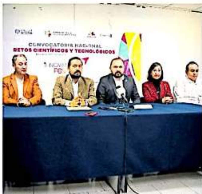
El ICTI, ha buscado promover este tipo de plataformas para mejorar las enseñanzas.

El pasado 10 de enero un niño desató un brote en el Colegio Cervantes en la ciudad de Toluca, Coahuila, con un saldo de dos muertos y dos heridos, situación