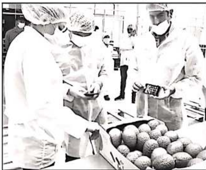
AUNQUE MICHOACÁN ES RECONOCIDO POR SU VOCACIÓN EN EL AGRO, LA DELINCUENCIA, MERECE LA PRODUCCIÓN

No solo es el Oriente michoacano, la amenaza existe y persiste en otros rincones del estado, sobre todos aquellos con fuerte vocación productiva. El Frente Sector de Profesionales de la Agronomía, Ingenieros Forestales, Defensores Ambientales y Organizaciones Aliadas, integrada por diversas organizaciones de académicos, productores agrícolas y de activistas, destaca que en la región de Tierra Caliente, el Bajío y otras zonas productoras del estado tienen con la misma problemática.