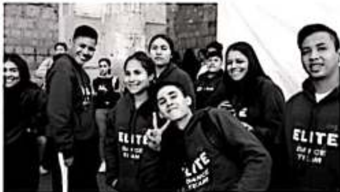
MORELIA, MICH.- El corazón de Michoacán se apoderó de la Plaza Valladolid con las coreografías de los 21 equipos de jóvenes estudiantes.

El resultado se dará a conocer en cuanto concluya la presentación del total de coreografías, que hasta las 14:00 horas aún continuaba.