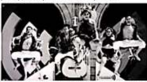
MORELIA, MICH.- "Michoacán se vive" nos une como estado y muestra a través de las y los jóvenes la riqueza cultural del estado, coincidieron participantes del concurso de baile "Michoacán se vive".