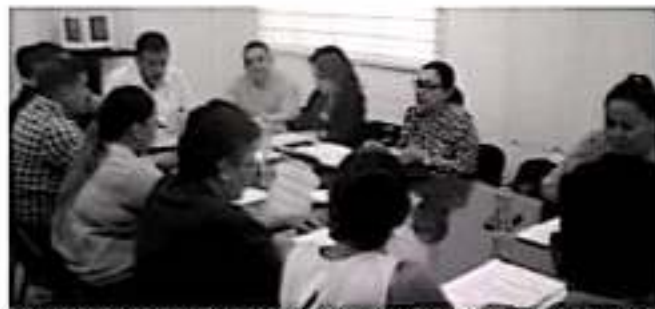
En Sesión Ordinaria de Cabildos ayer fue aprobado un Reglamento de Protección a los Animales, entre otros puntos.