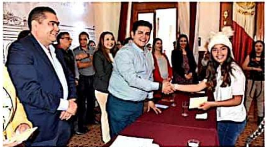
El Congreso del estado hizo entrega ayer de becas a estudiantes de excelencia.