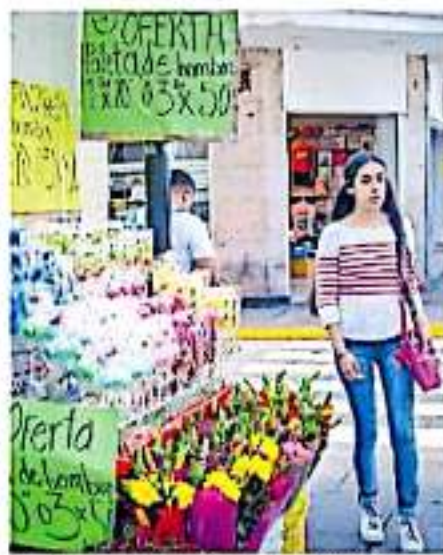
En el Centro Histórico operan tres mil 250 negocios del sector comercio. CAROLINA IGARIBAY

En la zona del Centro Histórico operan tres mil 250 negocios del sector comercio, de los cuales los dedicados a alimentos son un mil 600 unidades económicas en esa demarcación.