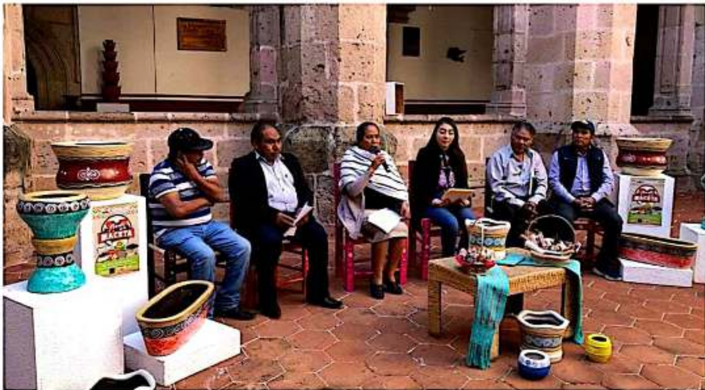
Del 22 al 24 de febrero más de 40 artífices tendrán a la venta macetas a precios accesibles en San Matías en el municipio de Hidalgo.