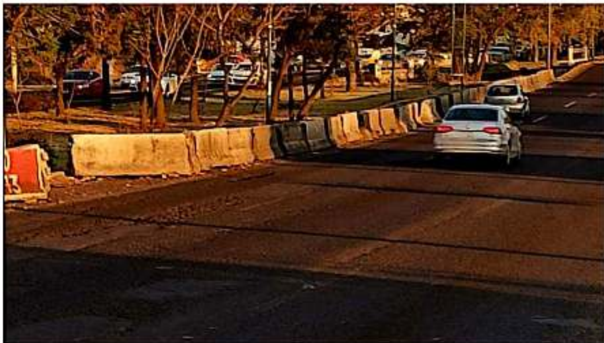
Candaya SCOP reparación de hundimiento en Periférico de Morelia; libera la circulación vehicular.