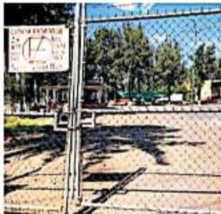
La Comisión Organizadora realiza los preparativos para el VIII Congreso Seccional.