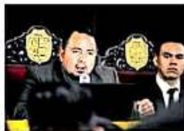
El nuevo ombudsman tendrá que atender varios asuntos. (APREMIADO MALDONADO)

"He dialogado con otros aspirantes y he hecho referencia de manera muy puntual a que no caigamos en descalificaciones que nos aspirantes a este espacio porque vulneramos los propios derechos individuales, lo cual sucedió en el anterior proceso, porque el problema no fue al interior del Congreso sino entre los propios aspirantes", dijo el también abogado socialista. Entreñado por el Sol de Morelia, Romero Robles lamentó la afectación que sufrieron los aspirantes que integraron la pasada feria, chi-