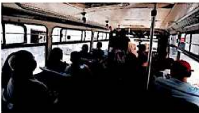
En Morelia, existen 73 rutas de "combi" y 38 rutas de camiones del transporte público. (MARCO LAGUNAS)

En Morelia, existen 73 rutas de "combi" y 38 rutas de camiones del transporte público del cual 80 por ciento asu pasa cruz por el Centro Histórico capitalino, lo que a vez de resolver "se agrava la distribución". Finalmente en la capital del estado de Mi-