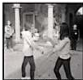
LA TAREA ES EMPODERAR A LAS MUJERES, AFIRMAN AUTORIDADES