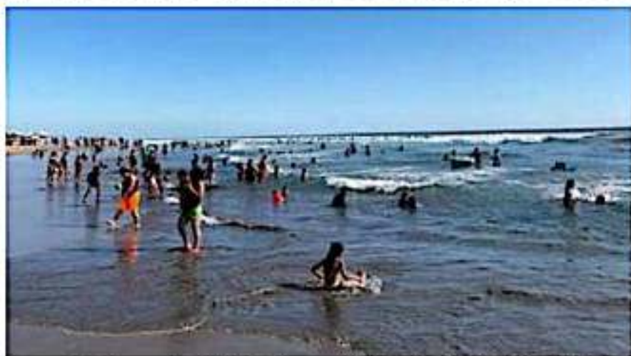
En este primer fin de semana largo del año, el gobierno municipal invita a la población a disfrutar de las bellezas naturales y gastronomía que ofrece el litoral costero de este municipio.