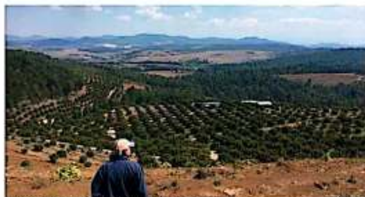
Actividades mantienen los operarios para dinamizar las huertas reguñeras. | CORNISA