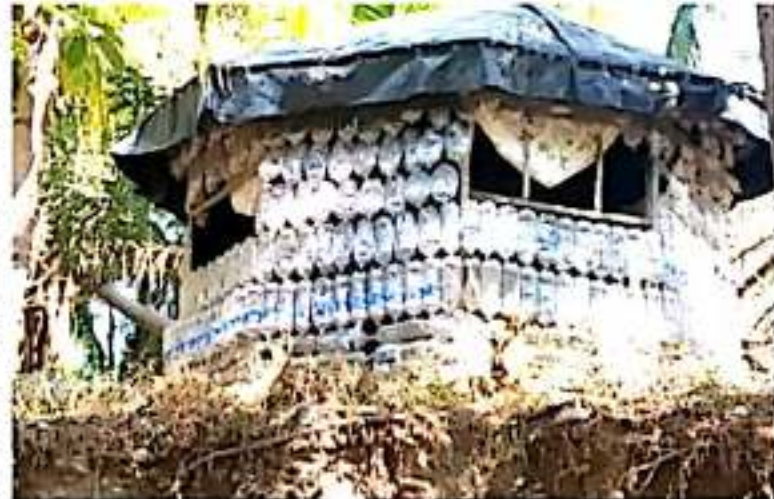
CD. LÁZARO CÁRDENAS, MICH.- Cabaña construida con más de 200 botellas de pet para el fomento de reciclaje.

Finalmente señaló que, este proyecto no tiene ningún fin de lucro, solo por innovar y fomentar las acciones de reciclaje, sin embargo, quien desee replicarlo se dice a disposición de compartir el proceso en todo el municipio sin importar el uso que deseándole.