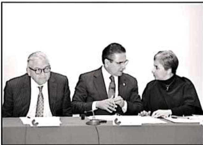
SE REALIZÓ LA PRIMERA SESIÓN DEL CONSEJO ESTATAL DE SALUD, ENDEBIZADA POR EL GOBERNADOR SILVANO AUREOLES

pesos para invertir en un área de salud mental, cambiaríamos la denominación del hospital no a un hospital psiquiátrico que causa mucho estigma, sino a una unidad integral de salud mental en donde las personas puedan ir a clínica del sueño, tratamiento en psicología para depresión, de violencia y hacer el tema más integral y también atención de pacientes crónicos. Es una gestión que estamos haciendo este año y si los gramos que nos den la autorización, este año empezaremos la obra".