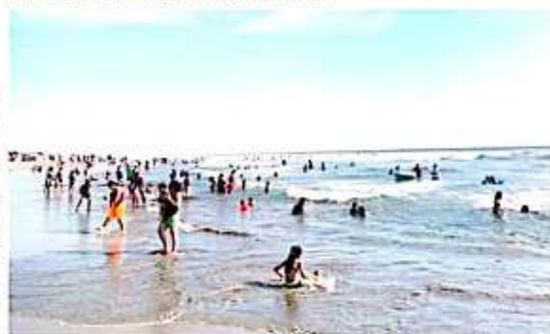
CD. LÁZARO CÁRDENAS, MICH.- En este primer fin de semana largo del año, a través del área de Turismo Municipal, invita a la población a disfrutar de los aproximadamente 72 kilómetros de playa de esta región costera.