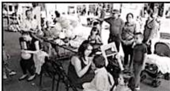
POR PETICIÓN CIUDADANA, EL EVENTO DEL DOMINGO AJUSTA SU HORARIO.

De manera paralela a estas acciones, se realizan análisis bacteriológicos de manera permanente para monitorizar la calidad del agua, cuyos resultados son óptimos para el consumo humano, sin embargo, por desconfianza de amplios sectores de la ciudadanía, se abstienen de consumirla y recurren al agua embotellada o potabilizada en empresas particulares.