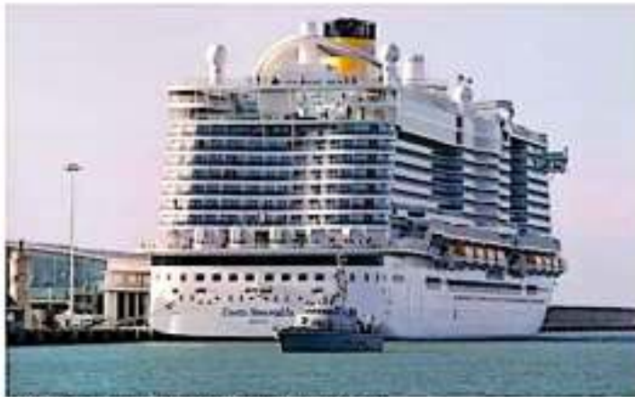
Un crucero ha venido en flota por una posible paupera contagiada. J AP

"Por todas estas razones, estoy declarando una emergencia de salud pública de