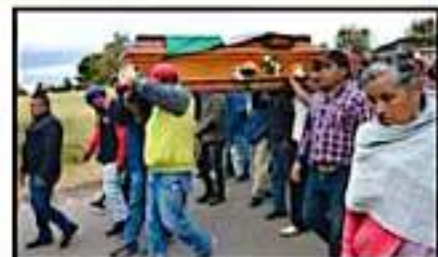
SIN TEMORES, LOS COMUNEROS SE COMPROMETIERON A SEGUIR LA LABOR EN LA REGIÓN DE LA MONARCA.