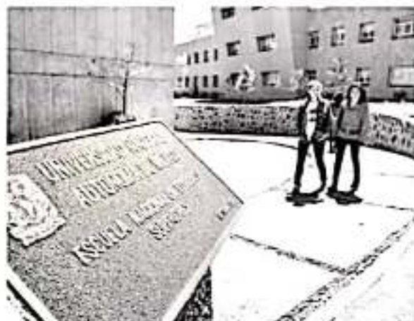
La Universidad Nacional Autónoma de México (UNAM) invita al 10º Aniversario del Viernes de Astronomía.

verano y pláticas de más temas actuales y emocionantes para el ciclo del segundo semestre», finalizó el Dr. Ortega Minakata.