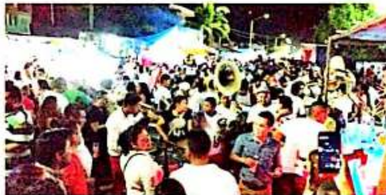
CD. LÁZARO CÁRDENAS, MICH.- Afluencia de visitantes en 2019 durante las fiestas de Semana Santa en Playa Azul.

Por lo anterior, advierten que ya están cansados de tocar puertas sin tener eco, e incluso planean invitar a los funcionarios competentes, a una comida, pero a un costado del canal, para que vivan "en carne propia", lo que padecen todos los días, quienes habitan sobre él, soportando fuertes olores y constantes problemas de salud.