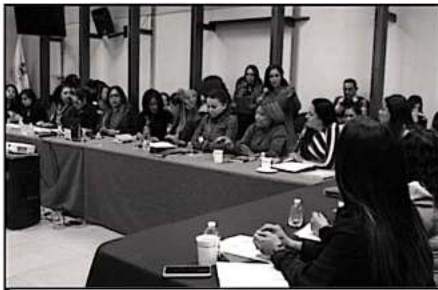
LAS INTEGRANTES DEL OBSERVATORIO SE PRONUNCIAN CONTRA LAS AGRESIONES MACHISTAS EN LA POLÍTICA.