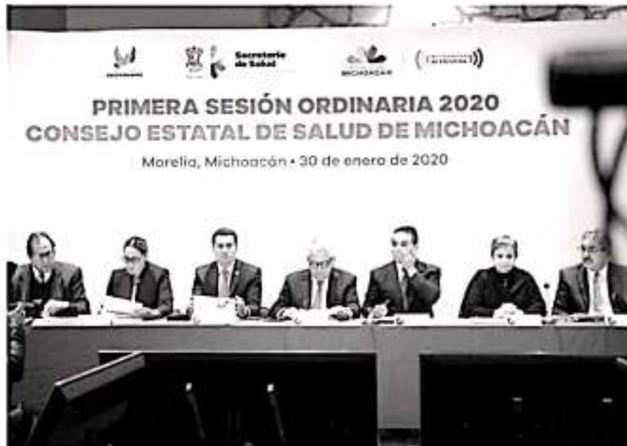
Urge gobernar a atender embarazo, suicidio y consumo de drogas en adolescentes.

En este marco, el gobernador del estado aseguró que Michoacán se alineará a la política nacional en materia de salud, la