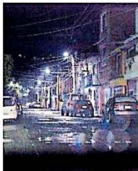
El municipio señaló que son "jóvenes vándalos" quienes se dedican al robo del cableado.

Acerca de la culminación de este proyecto, el edil capital no reconoció que no se cumplió la meta prevista, no obstante refirió que en todos los proyectos exis-