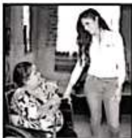
LA TITULAR DEL DIF ENTREGÓ SILLAS DE RUEDAS A 39 PERSONAS

Estas acciones se mantendrán de manera permanente para blindar el patrimonio municipal en la figura de espacios públicos, incluso en el presente año se planea impulsar un programa de consolidación de estos espacios en favor de los propios vecinos con la intención de que sean ellos mismos quienes se encarguen del cuidado de los mismos ante la imposibilidad del municipio para darle mantenimiento a todas esas áreas.