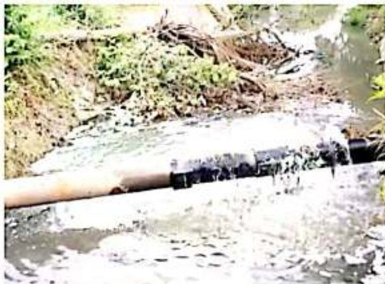
CD. LÁZARO CÁRDENAS, MICH.- Zonas afectadas por descargas de aguas negras domiciliarias al canal de la colonia Lucio Cabañas.