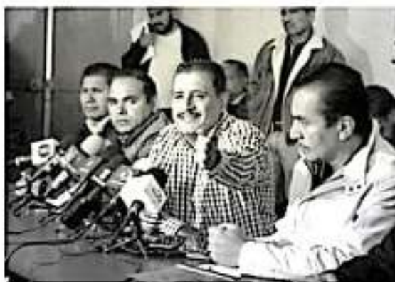
El líder de los transportistas indicó que hay sectores ciudadanos que reconocen la labor del representante durante su gestión en favor de la educación.