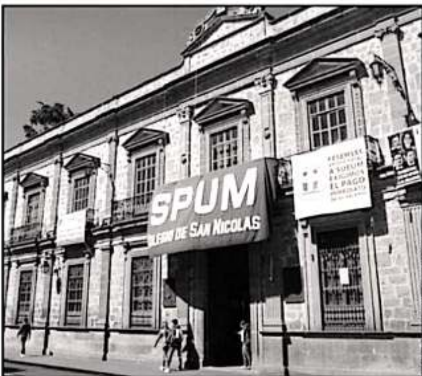
SE CUMPLEN DOS SEMANAS DE QUE LOS PROFESORES COLOCARON LAS BANDERAS ROJINEGRAS EN LA UMSNH

mes de diciembre y las prestaciones de fin de año, ya que consideran que es una imposición al condicionar el pago de salarios a cambio de aceptar ceder sus prestaciones.