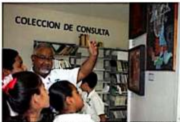
El gobierno municipal invita a la exposición pictórica "Cotidiano" del maestro Francisco Gómez Bataz.

Dicha exposición, indicó, consta de 12 obras pictóricas del reconocido pintor, las cuales no han sido expuestas con anterioridad.