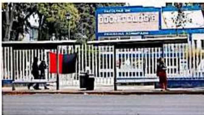
Una vez levantada la huelga se garantizará el pago de la segunda quincena de enero a los docentes.