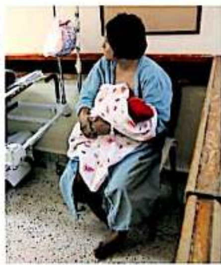
Se estiman 51 defunciones por cada 100 mil nacimientos en el país. ANOVA

El reporte de 2018 de la DGE indicó el siguiente comportamiento: 30 defunciones en total, de las cuales 10 ocurrieron en la SSM, 3 en el IMSS, 1 en IMSS Prospera y 1 en el ISSSTE y 9 "sin atención y otras".