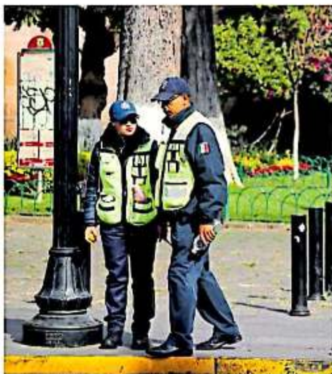
Es preocupante la situación de Tumbaco, Cuitzeo, Pátzcuaro, Zinapécuaro y Acuitzio del Canje.

Conforme a los estándares establecidos por la Organización de las Naciones Unidas (ONU) y del mismo Secretariado Ejecutivo del Sistema Nacional de Seguridad Pública (SESSP) se menciona que por cada mil habitantes se requieren dos policías. "Hay un rezago importante histórico. Un ejemplo claro y preocupante es el municipio de Aguililla, tiene registrados cuatro policías, acreditados dos. Ustedes imagínense si con un presupuesto como estos van a poder encargarse de la seguridad. La constitución federal establece que los