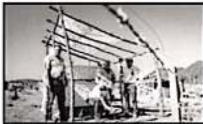
CON SIMPLES RAMAS, LA GENTE SE APROPIA DE PIEDRO