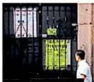
Las quejas se reciben en las oficinas de educación básica. STEFANO BALDOVINO

Previo a la huelga simbólica, el rector estableció diálogo con los sindicalizados, desde pidió comprensión para mantener las actividades escolares en la segunda parte del ciclo escolar 2019-2020 que recién a cabo de empezar, así como prometió el pago del adeudo restante de los aguinaldos el 24 de enero del presente año.