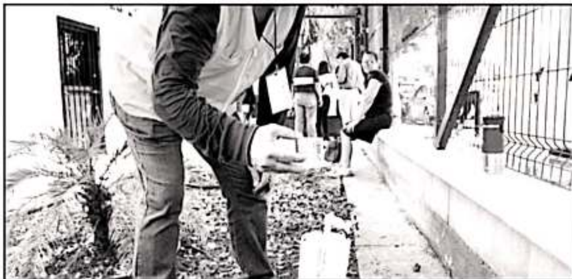
CAPASA INICIÓ UN OPERATIVO PARA VERIFICAR Y GARANTIZAR LA CALIDAD DEL AGUA PARA TODOS LOS HABITANTES DE LA CIUDAD DE URUAPAN