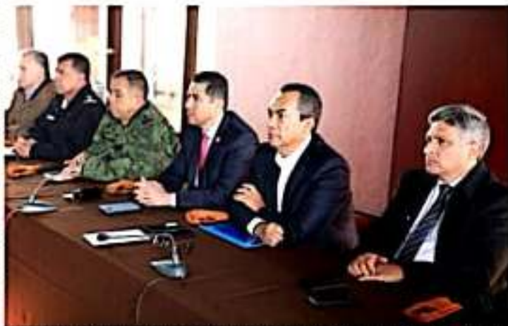
MORELIA, MICH.- Integrantes de la Mesa de Coordinación para la Construcción de la Paz, revisaron las líneas de acción en la estrategia para la atención de denuncias sobre la desaparición de personas.