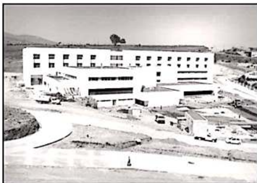
AL LRA DE AVANCE SE ENCUENTRAN LAS OBRAS DE CIUDAD SALUD. YA SÓLO FALTAN DETALLES. SE SÍLA MERCEDES

Sobre el nuevo Hospital Infantil reconoció que viene un poquito atrás, “espero que esta semana llegue al 90 por ciento y también tengo ya todo el equipo y el mobiliario, los equipos fuertes están llegando, siempre tienen sus componentes complejos, pero estamos muy adelantados”.