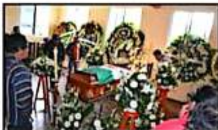
CENTOS DE PERSONAS HICIERON GUARDIA AL CUERPO DEL INGENIERO, LAS LÁGRIMAS FUERON INEVITABLES.