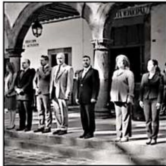
EL EDIL DE PATZCUARO RESALTO QUE SE DEBE TENER CREATIVIDAD PARA EVITAR AUMENTAR IMPUESTOS A LA CIUDADANÍA O ADOPTAR MÁS DEUDA.

Ellos están ahí para defender a los ciudadanos, de medidas que se consideran contrarias a los principios de nuestro movimiento y en toda la campaña nuestro partido se manifestó en contra de más deuda y de mayores impuestos", concluyó el alcalde.