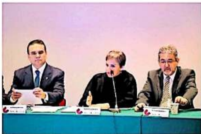
Se aclaró que los señalamientos del gobernador al convenio no significa que se quedará fuera del sistema.