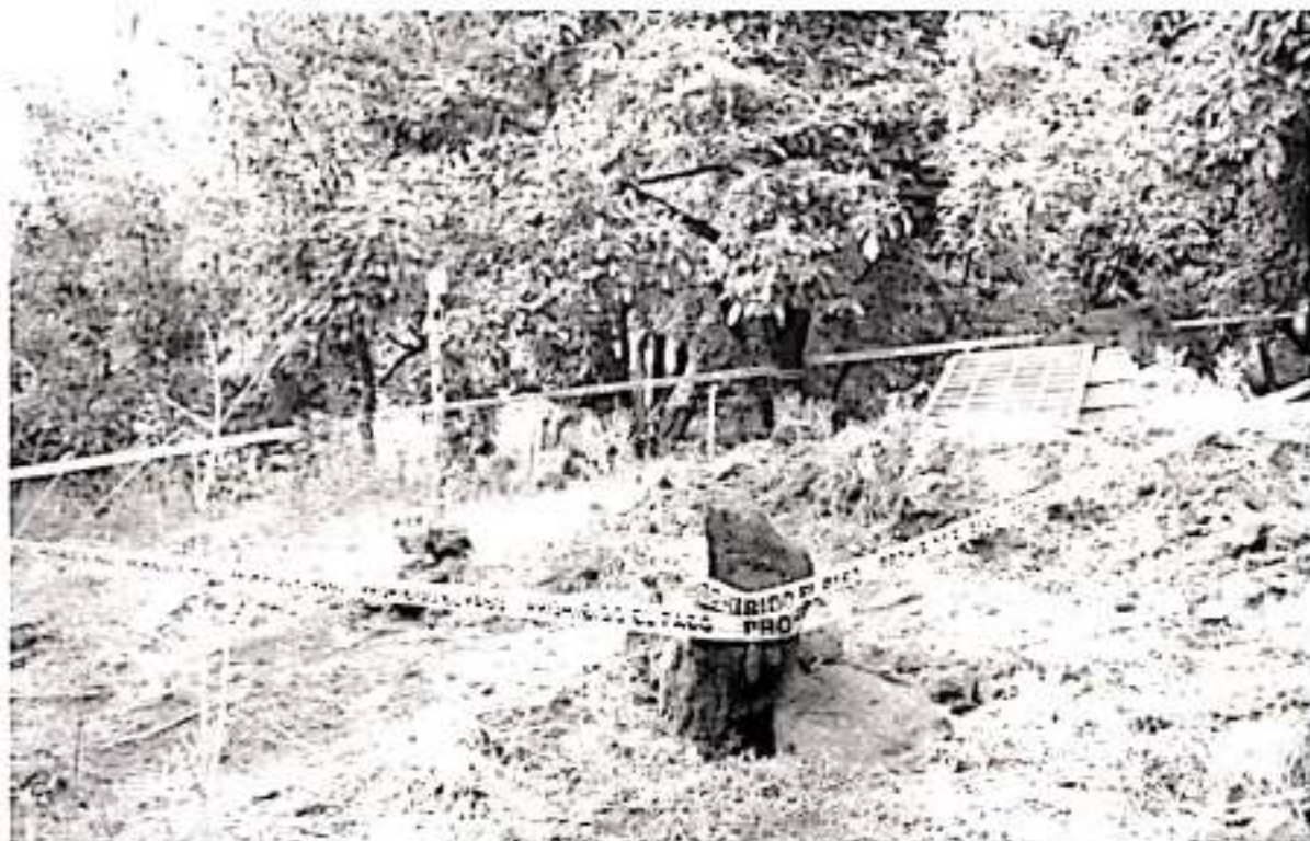
El funcionario federal expuso que además se realizará un estudio de los manantiales del área comprendida entre San Juan Nuevo Parangaricutiro, Paracho y Uruapan, que servirá para determinar lo que está sucediendo.

entrevista expuso que además se realizará un estudio de los manantiales del área comprendida entre San Juan Nuevo Parangaricutiro, Paracho y Uruapan, que servirá para determinar lo que está sucediendo y cuál es