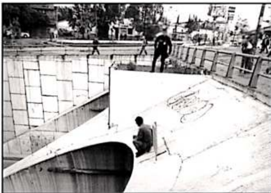
DEPRESIÓN, ADICCIONES Y HASTA CELOS. ENTRE LAS COSAS QUE ORILLAN A ALGUIEN A AFENTAR CONTRA SU VIDA

250 PSICÓLOGOS clínicos hay en el estado