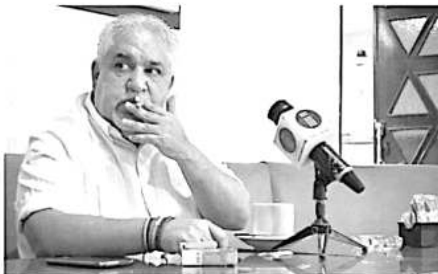
La casa de Hidalgo rechaza la violencia de género derivada de expresiones misóginas del dirigente de este gremio sindical. ESPECIAL

La Universidad Michoacana de San Nicolás de Hidalgo condena enérgicamente las expresiones verbales y exhorta al dirigente del SUEUM a no violentar a ninguna persona, mucho menos por motivos de género.