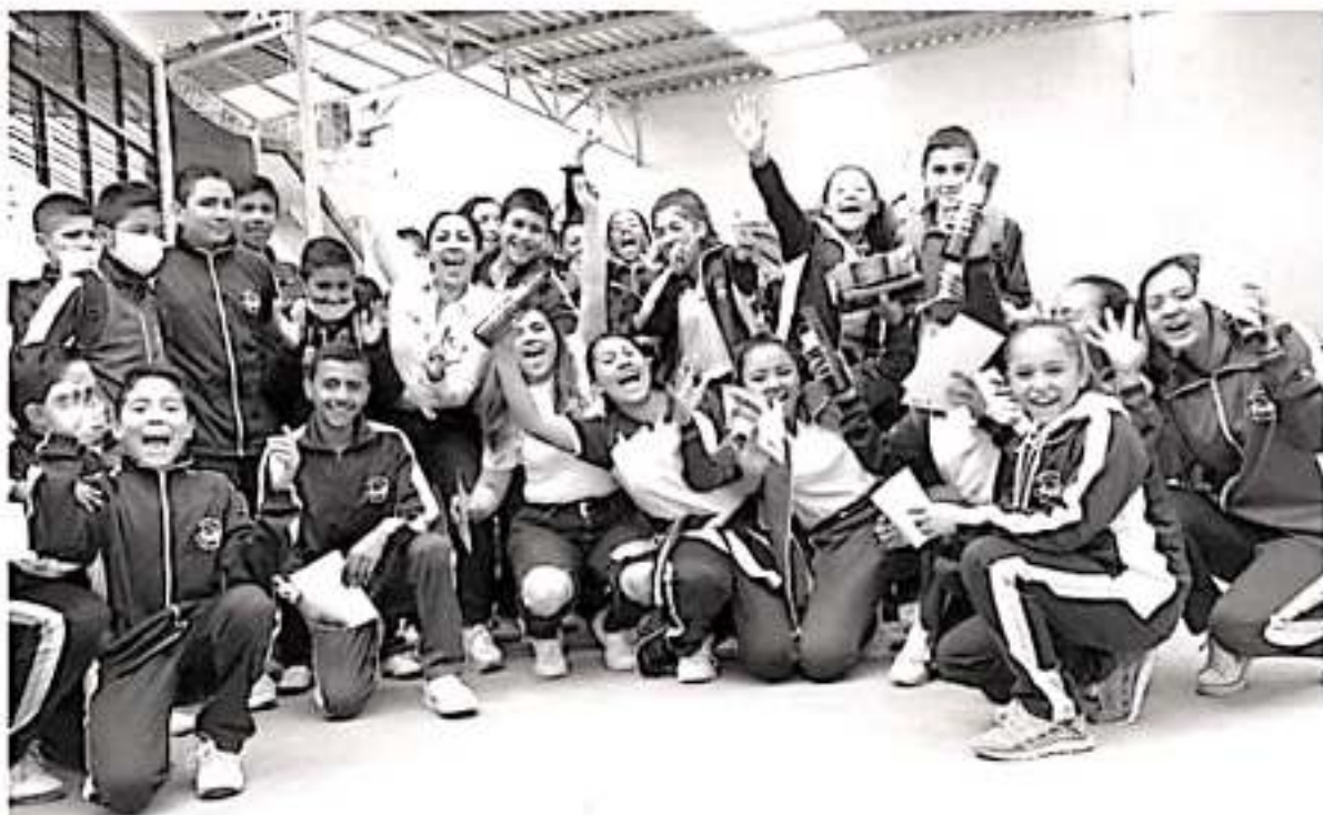
Lleva Seimujer campaña «No es amor, es violencia», a estudiantes de telesecundaria de Tarímbaro.