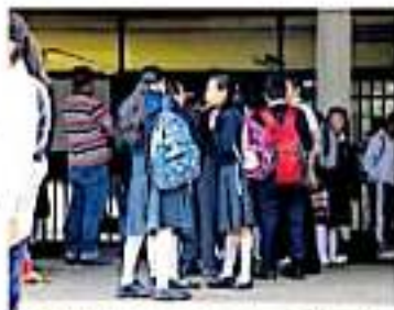
Se trabajará con el programa "Escuela Segura". MARÍA ALUNA

"No hemos detectado puntos de riesgo o vulnerables a la violencia dentro de los centros escolares de Michoacán en ningún municipio o en alguna región en particular". Sin embargo, señaló que la zona que ellos han utilizado como grupos vulnerables en la entidad son aquellas que tienen un contexto social donde se dificultan el desarrollo de los niños en las escuelas, y desde los albergues escolares y los centros de atención, así como a los hogares de los niños migrantes y habitantes de zonas de alta y muy alta marginación, como son las comunidades del municipio de Tzitzio y la región Sierra Costa.