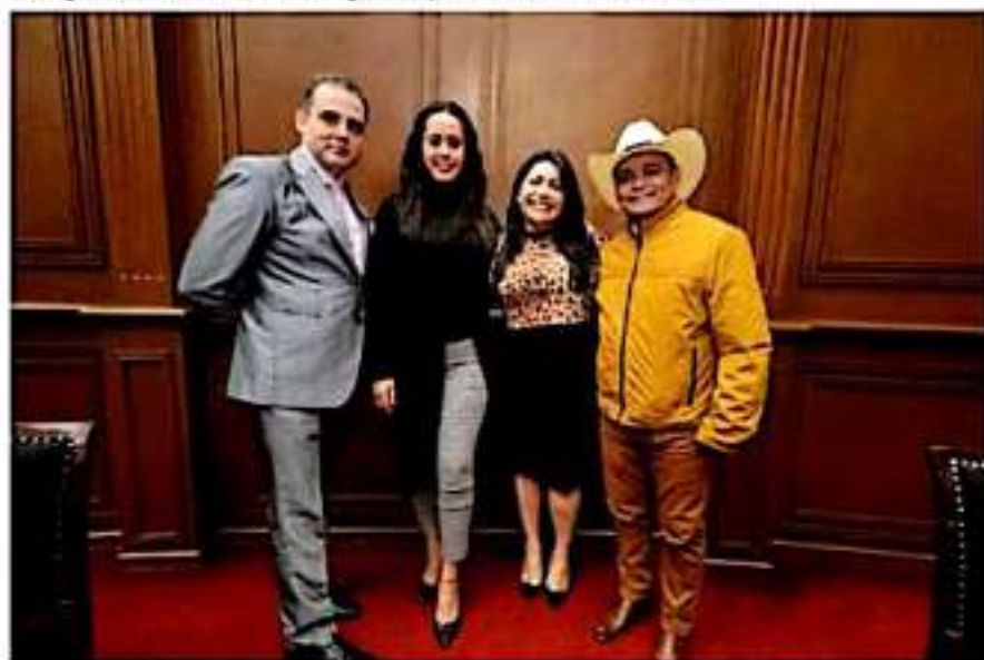
Las y los diputados del PT están listos para impulsar reformas y leyes en diversos temas que benefician a los ciudadanos.

"Durante la primera parte de la legislación se logró una pena más severa para el delito de femicidio, sin embargo debemos seguir adelante y no solo buscar castigar, sino prevenir y generar mejores condiciones a las mujeres michoacanas. En la agenda del PT tenemos varias propuestas en pro de las mujeres que presentaremos durante el próximo semestre", concluyó el legislador por el distrito de Tarimbaro.