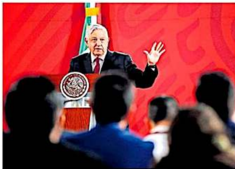
El mandatario federal anunció que estará trabajando para frenar la tala inmoderada de

Alpescame de la familia de Homero Gómez se sumaron cientos de personas provenientes de diferentes partes del país e incluso del extranjero, quienes amaron a