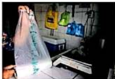
Habrán modificaciones a la norma.

Si embargo, el día del operativo la estrategia falló, pues la titular de la Dirección de Inspección y Vigilancia reconoció que la medida contenía un vacío legal en el reglamento, pues no se especificaba si