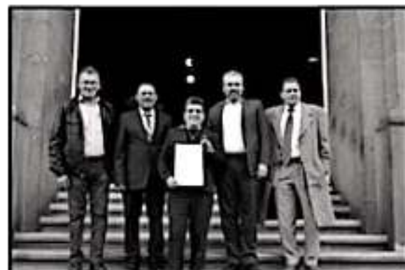
DEPUTADOS DE MORENA Y EL PT PRESENTARON ANTE LA SUPREMA CORTE UNA ACCIÓN DE INCONSTITUCIONALIDAD POR LA NUEVA DEUDA PÚBLICA ESTATAL.

La contratación de deuda pública y el refinanciamiento de créditos hasta por 17 mil 250 millones 845 mil 100 pesos, "se aprobaron sin las dos terceras partes de los votos a favor", como lo dispone el artículo 117 de la Constitución federal, citaron.