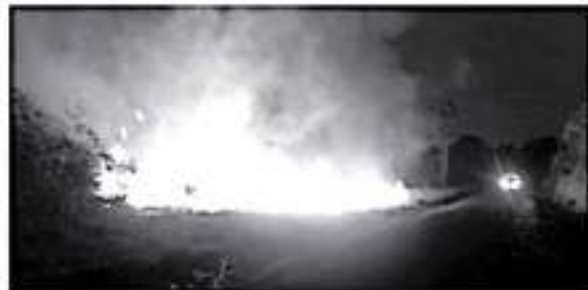
El colmo es que los uniformes de los cuales los dotaron, los ponen en riesgo de convertirse en teas humanas, ya que debes ser de un material que se llama Numex.

formes de los cuales los dotaron, los ponen en riesgo de convertirse en teas humanas, ya que deben ser de un material que se llama Numex, que es resistente al