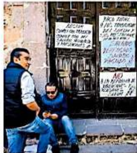
Los más de tres mil empleados agremiados al SUEUM continúan sin pago. VEGOMA LÓPEZ

Por lo que los saemistas han intensificado sus acciones de protesta, con la toma continua del edificio de Redonda, así como la toma de la Avenida Morelos.