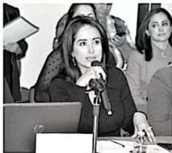
Lucila Martínez Manríquez, diputada y presidenta de la Comisión de Igualdad Sustantiva y Género en el Congreso del Estado.

Resaltó la importancia de que no se baje la guardia en el combate a la violencia a la mujer y toda acción promovida para ello es positiva y tendrá el respaldo de las y los legisladores, quienes han presentado propuestas ante el Pleno del Congreso en favor de todas y para cerrarle paso a la violencia.