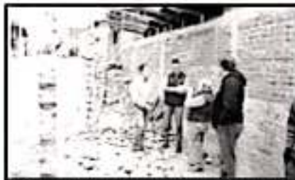
AUTORIDADES REVISAN EL LEVANTAMIENTO DE MEDIDAS