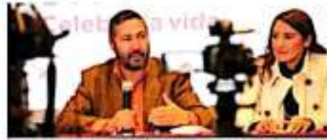
Los diputados están en para atender a los ciudadanos de Morelia que se encuentran con las principales de su vida. | CORNISA

"Como un gobierno de izquierda, en Pitzucuar nos sentimos orgullosos de que hemos llevado nuestra administración con cuatro años sin incrementar la deuda pública municipal y sin incrementar el cobro de derechos o servicios a los ciudadanos, y para ello hemos pedado a los funcionarios que nos agredimos el cinturón y que reduzcamos el gasto corriente", señaló el mandatario, y aclaró que el ejercicio de un presupuesto moderado no ha sido en detrimento de la calidad de la atención que los ciudadanos reciben de las autoridades.