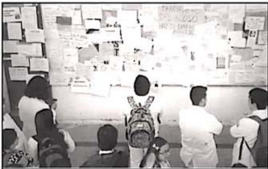
EL "TENDERERO" MUESTRA EL GRADO DE ALERTIA QUE HAY EN LA UMSNH Pese al protocolo, dicen estudiantes.