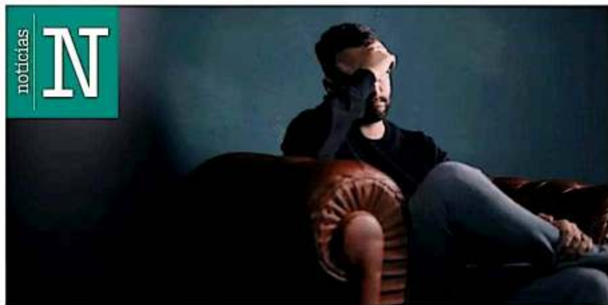
Ayuda. Al llamar al 911 las personas que piden ayuda son atendidas por psicólogos.