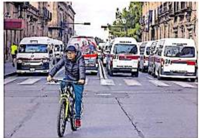
El próximo domingo estarán retomando los bloqueos aviso

En entrevista el líder transportista michoquense, aseguró que la reunión se tenía prevista para el pasado miércoles dentro de marzo con el Ayuntamiento, sin embargo, hasta el momento no han sido convocados por la autoridad municipal, además el líder negó que el edil moreliano haya realizado alguna propuesta para resolver el conflicto.