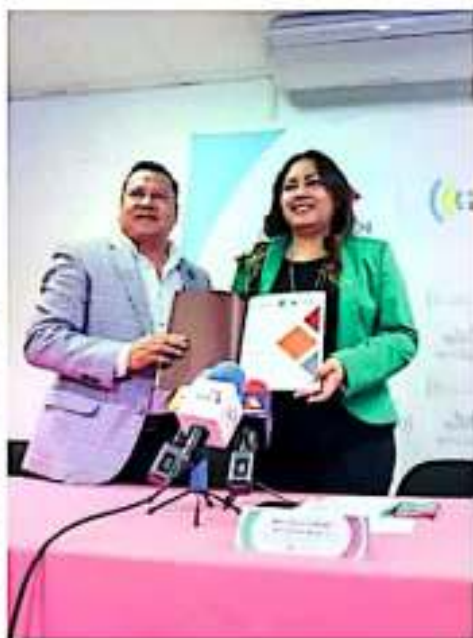
Compromiso. "No quedará ningún caso impune"