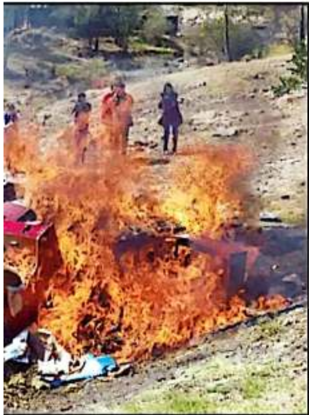
A DRUGAS Y CRIMINOS DELICTIVOS QUE FUERON INCENDIADOS EN FOCOS INVASAS

El doble efecto por el que los jóvenes no tienen y quitarle ruidos delictivos