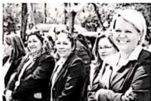
MORELIA, MICH.- Los hombres están llamados a acompañar a las mujeres en la lucha por visibilizar la violencia, lucha que se ha convertido en un factor de unión no sólo en Michoacán sino en todo el país.

institucional, la Semaccdet también puso en marcha herramientas como la instalación de la Unidad de Igualdad Sustantiva, los protocolos para