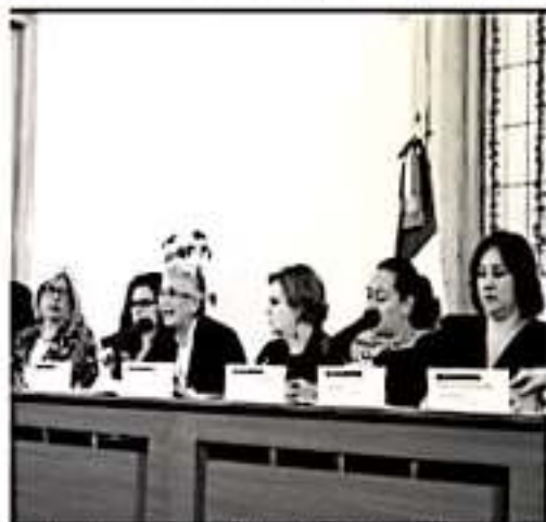
Ante las críticas que el presidente Andrés Manuel López Obrador ha recibido por parte de colectivos feministas, las mujeres de su gabinete cerraron filas y le mostraron su total apoyo