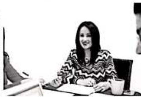
MORELIA, MICH.- La Comisión de Igualdad Sustantiva y de Género en la LXXIV Legislatura en el Congreso del Estado, dictaminó que la Condecoración "La Mujer Michoacana" sea otorgada a la asociación "Humanas Sin Violencia".

desarrollo de las mujeres, fomento a la participación femenina, salud, o en cualquier ámbito donde se fomente la inclusión y participación de la mujer michoacana.