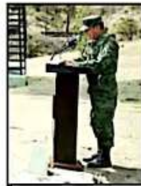
DIERON EL PARTE DE LO INCINERADO.