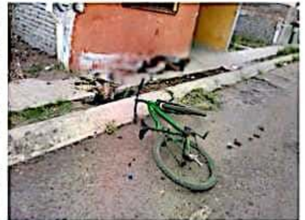
Ayer en Zamora, sujetos desconocidos mataron de varios balazos de grueso calibre a un individuo que se trasladaba en bicicleta.