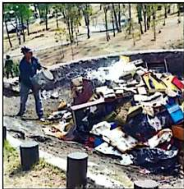
ENTRE LOS ARTÍCULOS TAMBIÉN HABÍA PRODUCTOS 'PIRATA', COMO ZAPATOS.