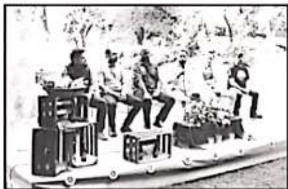
AL EVENTO GASTRO CERVECERO SE ESPERAN DE 10 A 15 MIL VISITANTES

reportó el inicio de un incendio en las faldas del cerro de Tejerías, el cual fue controlado de manera inmediata por brigadistas municipales del grupo "Delites", lo que permitió que el incidente se clasificara como conato.