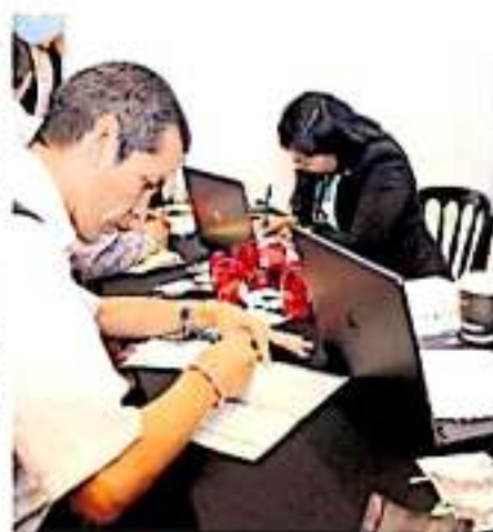
Con programas, intentan combatir los índices de desempleo (A.M.Z.)

Aclaró que los datos mensuales anteriormente son un muestreo y corresponden únicamente a las empresas que se acercan a estas oficinas para exponer sus vacantes. Ya que habrá otras que tienen sus propios métodos de reclutamiento ya establecidos y que se encargan directamente de hacer la contratación. La respuesta de los buscadores de empleo hacia la dependencia es favorable ya que durante el tiempo que pertenecen a personas interesadas quienes encuentran en estas oficinas una manera más fácil de conseguirlo.