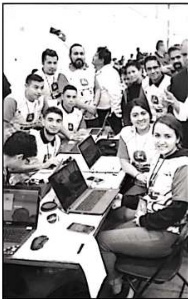
EL INNOVATION FEST ES UN ESPACIO PARA DETONAR EL DESARROLLO Y EMPLEO

También, junto al Servicio Estatal del Empleo participarán en Innova Empleo organismos empresariales tales como el Ecosistema Empresarial, el Centro de Organización para el Bienestar Integral y también participará la Asociación de Hoteles de Morelia, entre otros organismos,