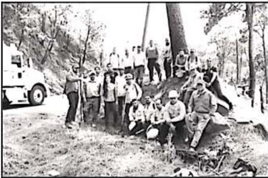
EN LO QUE VA DEL AÑO YA SUMAN DIEZ CONFLAGRACIONES EN LA REGIÓN, YA SE ORGANIZAN MÁS BRIGADAS