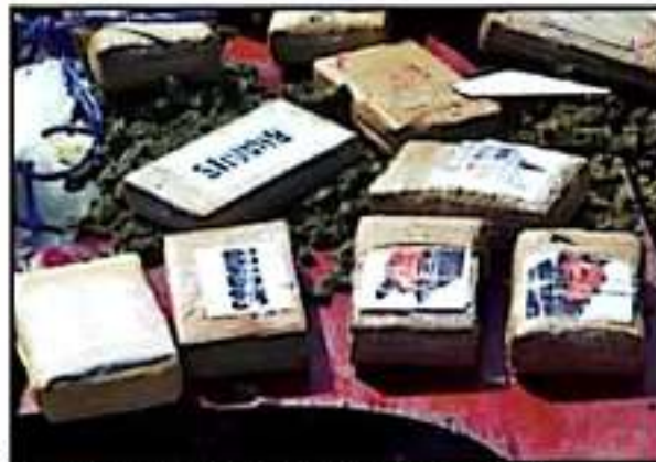
FUE CASI MEDIA TONELADA DE DROGAS LA QUE FUE DESTRUIDA.