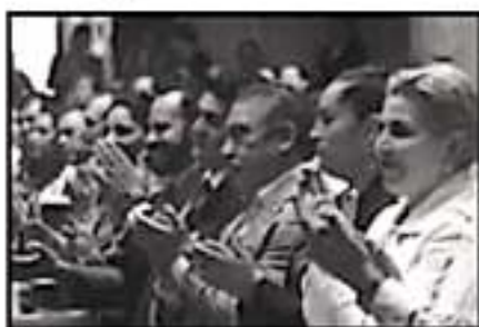
EL ALCALDE DE MORELIA, LEGISLADORES, FUNCIONARIOS Y FUNCIONARIAS DE DISTINTOS NIVELES ASISTIERON.