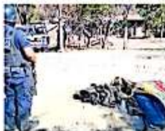
Se localizó el cuerpo inerte del sexo masculino.

Tres de las víctimas desmembradas se encontraban sobre el concreto de una gasolinera que se localiza a la entrada al municipio mencionado. Mientras que las extremidades del cuarto cuerpo se localizaron