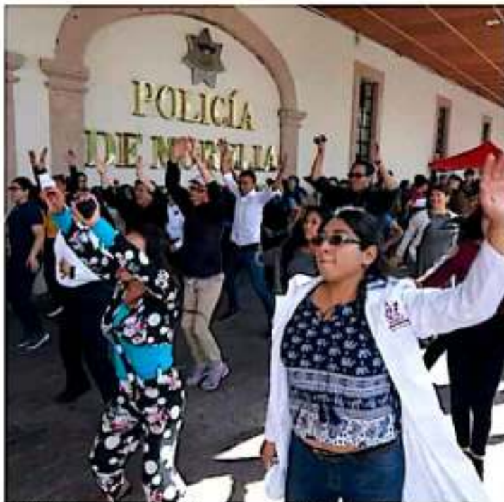
Juntos. Hombres y mujeres participaron en actividades de prevención.

Añadió que "hoy los niños y los jóvenes tienen que educarse con una visión distinta para cambiar esta realidad que hoy vivimos y que ha llegado a altos índices de violencia, pero