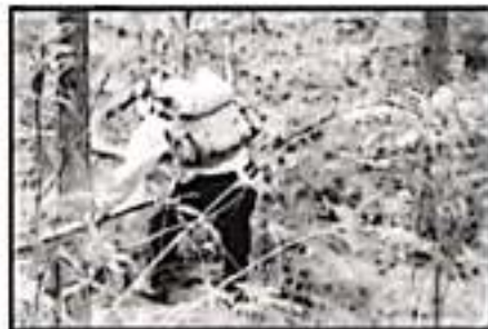
SE REPORTAN AFECTADAS 2 MIL 611 70 HECTÁREAS