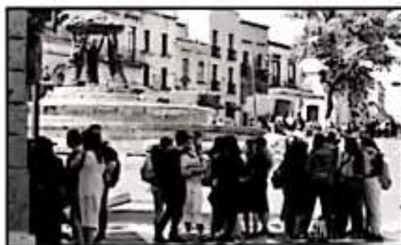
LA FUENTE DE LAS TARASCAS FUE DONDE FRENARON LA CIRCULACION