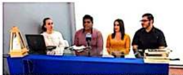
ZAMORA, MICH.- En rueda de prensa, se informó que la Universidad Pedagógica Nacional llevará a cabo su 6ª Semana del Interventor "Educar al ser para Transcender", del 11 al 13 de marzo, en esta población.

La jefa regional informó que esta caravana ofreció atención jurídica, trabajo social, psicológica; información del programa "Pe-