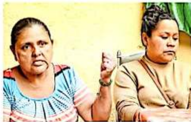
El frente tiene programada una movilización para el 8 de marzo.

Asimismo, aunque se dijera respetuosas de la huelga que emprenderá el feminismo el próximo 9 de marzo bajo el slogan de 'Un día sin nosotros', opinaron que la actividad ya se