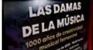
MORELIA, MICH.- Las Damas en la música, nombre del concierto que celebra mil años de creación musical femenina.

Cabe señalar que previo al concierto, a las 18:00 horas, se invita a los asistentes a escuchar una conferencia sobre la vida, obra y talento de las mujeres en el ámbito musical.