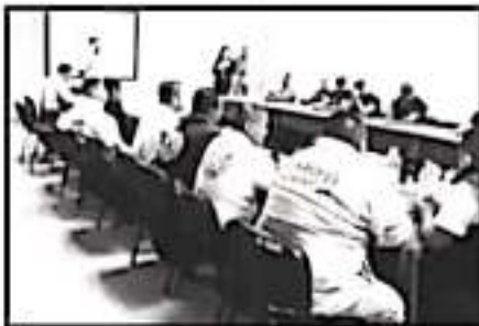
GRUPO DE EMPLEADOS MUNICIPALES RECIBE CURSO

Puntualizó que la diferencia entre un incendio y un conato, radica en que la afectación de los primeros es mayor a una hectárea en tanto los segundos registra daños en superficies menores, los que igualmente se han tenido gracias a mejores habilidades de los brigadistas por medio de este