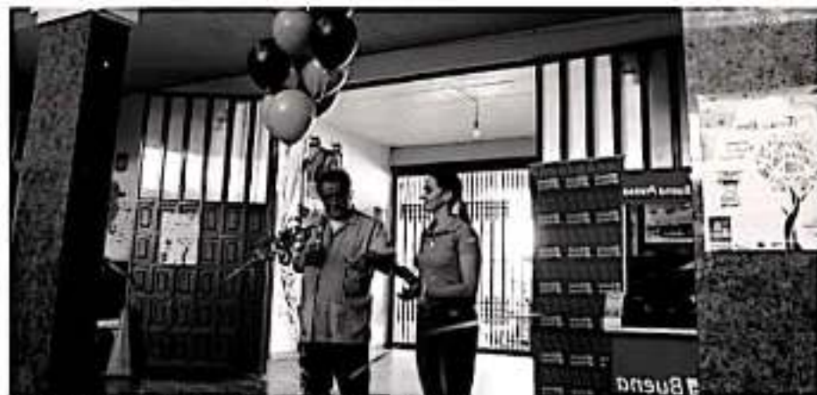
LOS REYES, MICH.- Inauguró el Idfjam su primera Feria del Libro.