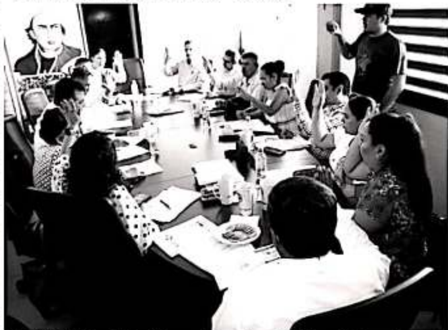
APATZINGÁN, MICH.- En sesión de cabildo se aprobó otorgar descuentos del cien por ciento en multas y recargos del impuesto predial, a fin de que los contribuyentes se pongan al corriente.

Cabe destacar que los predios que sean cubiertos durante marzo, también participarán en la rifa del March 2020.