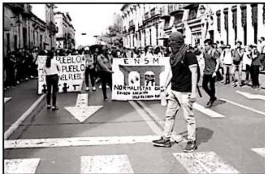
COMO YA ES COSTUMBRE, VARIOS ENCAPUCHADOS ESTUVIERON PRESENTES EN LOS CONTINGENTES ESTUDIANTES