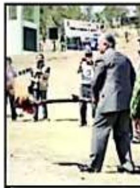
INICIARON LA QUEMA DE DROGAS.

Cabe destacar que, al igual que en las detenciones, cifras del gobierno de Michoacán refieren que al menos el 80 por ciento de las víctimas de homicidio que se registran en la entidad, tienen relación directamente con el consumo, adeudo o tráfico de las mismas. Se advierte que la tendencia del narcomercado está ligada en gran parte de la incidencia delictiva de todos los rubros.