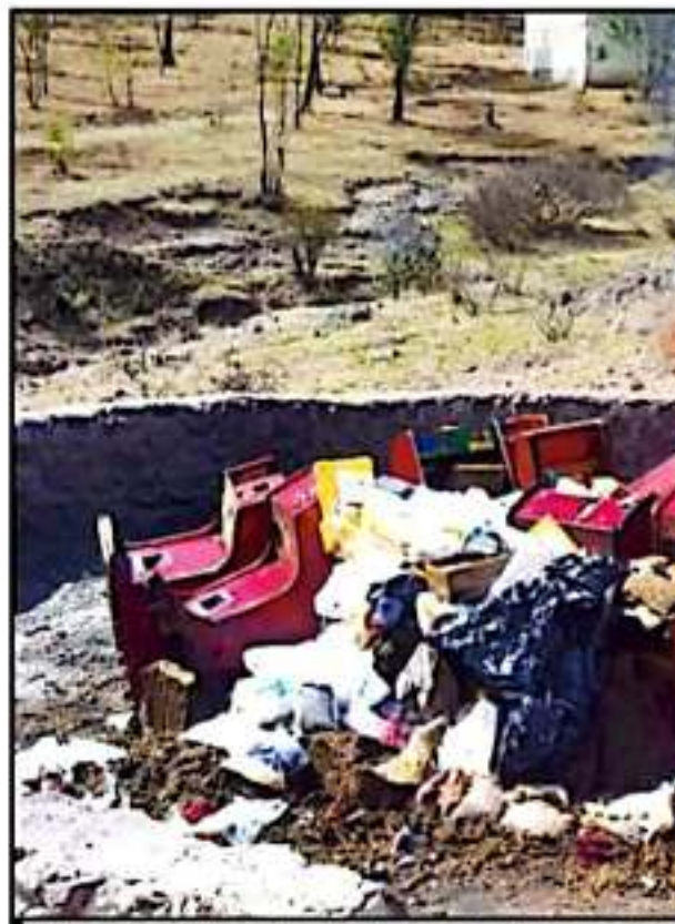
AUTORIDADES DE SEGURIDAD REALIZARON EL PROTOCOLO DE INCINERACIÓN PARA

En este contexto, llamó la atención de al menos tres máquinas tragamonedas que fueron también incineradas por las autoridades federales. El mismo diseño de máquina se replica en decenas de comercios del Centro Histórico de la capital del estado y en municipios, al interior del estado de Michoacán en donde siguen operando bajo la contemplación de las autoridades que, parece, siguen