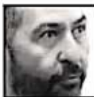
Víctor Báez Ceja, GOBERNADOR DE PÁTZCUARO

La igualdad que queremos es una igualdad sustantiva, que permita a todas las mujeres alcanzar sus metas e ideales, sin las limitantes que hombres y mujeres con ideas machistas pretenden determinar en la vida de los demás, explicó el especialista, en el auditorio de la Casa de la Cultura, Alfredo Zúñiga, que sir-