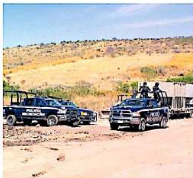
La Fiscalía estatal precisó que se inició carpeta de investigación.