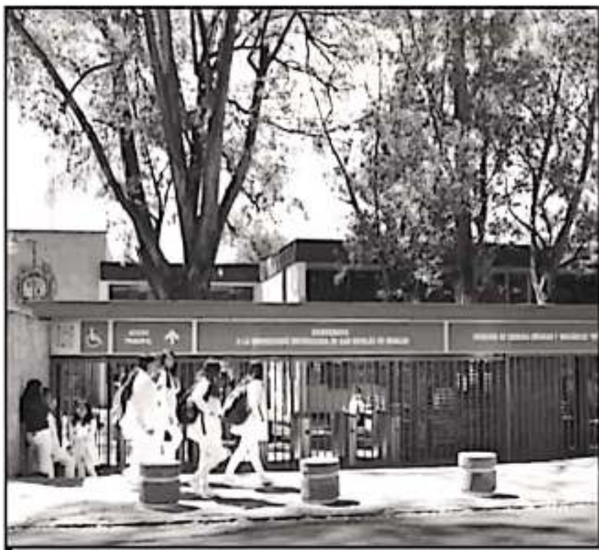
ESTUDIANTES DE LA UMSNH DICEN QUE EL PROTOCOLO CONTRA LA VIOLENCIA TIENE INCONSISTENCIAS Y POCO EFECTO.

autoridad nicolaíta, quien pide a las alumnas utilizar sus canales privados de denuncia, los cuales no han hecho sino perpetuar el acoso, según mencionan las mismas alumnas nicolaítas.