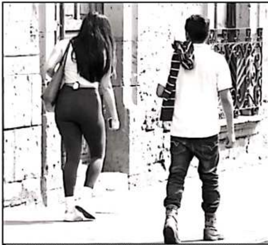
EL ACEBRO CALLEJERO ES UNA DE LAS SITUACIONES MÁS COMUNES. DE SEÑALADAS HASTA COMENTARIOS