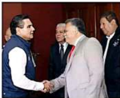
A favor. "Debe seguir la coordinación", gobernador. /coerisa

"Es importante que sigan dándonos estos resultados, porque con estas capturas sacamos de las calles a quienes generan la violencia, pero debemos seguir intensificando esfuerzos para impedir que