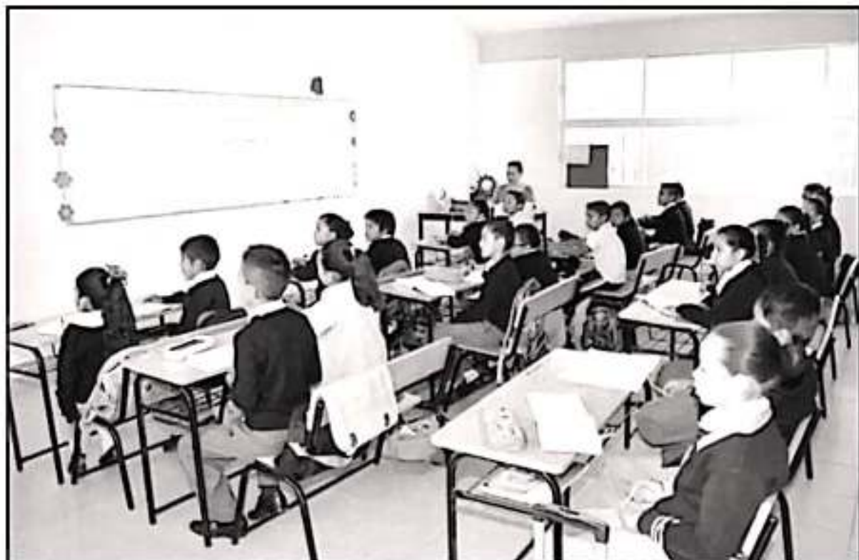
EL PAPEL DE LOS MAESTROS ES VITAL EN EL NUEVO MODELO. LAS REFORMAS BUSCARON DEJARLES EL SANCIONIS Y ENFOCAR SU ROL EN LAS AULAS.

un elemento positivo en esta nueva propuesta es recuperar el papel del maestro que, lamentablemente, en el anterior modelo hubo temores por parte de los mismos debido a las presuntas medidas punitivas que se impulsaban "y que obligó a muchos buenos maestros alejar las aulas, a pesar de el buen desempeño con el que contaban y la experiencia acumulada".