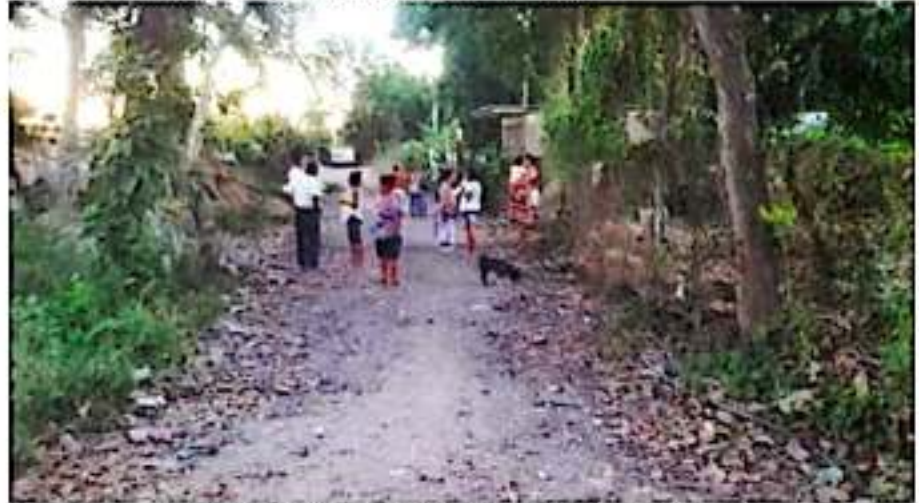
Levantar censo de viviendas a electrificar en la colonia Plutarco Elías Calles.

que serán supervisados por la Comisión Federal de Electricidad (CFE).