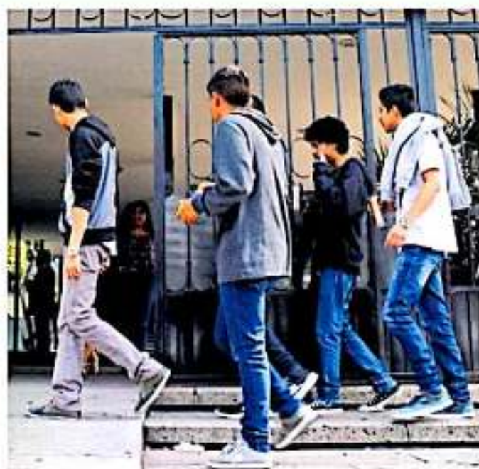
El acoso escolar es una realidad aunque las instituciones se niegan a aceptarlo