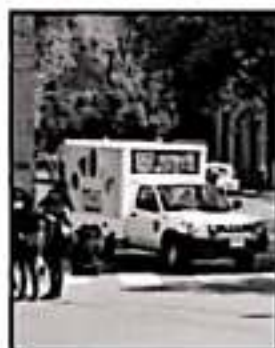
TAMBIÉN REGRESÓ EL SAQUEO.

Subrayó que, ante esta intención por parte de las autoridades, lo que solicitan es el diálogo con el encargado de despacho de la