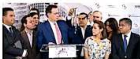
Micrófonos. Exigieron que se investigue. / QUIMROSCIVO