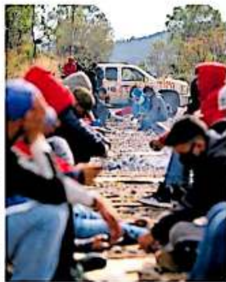
Las protestas de los normalistas escalan al municipio de Arteaga en Tierra Caliente.

En 2019, Michoacán cerró con 62 bloqueos en las vías del ferrocarril, lo que generó afectaciones económicas por tres mil 800 millones de pesos, de acuerdo con reportes de los mismos organismos empresariales del sector logístico e industrial.