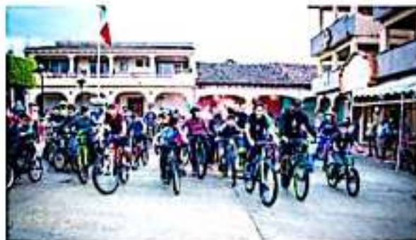
PERIBÁN, MICH.- El ayuntamiento peribanesco está convocando a una rodada ciclista con motivo del Día de San Valentín.