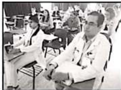
RECOMIENDAN ESTAR ALERTAS ANTE PRESENCIA DE VIRUS

■ SALUD ■ REALIZAN CAPACITACIONES AL PERSONAL MÉDICO