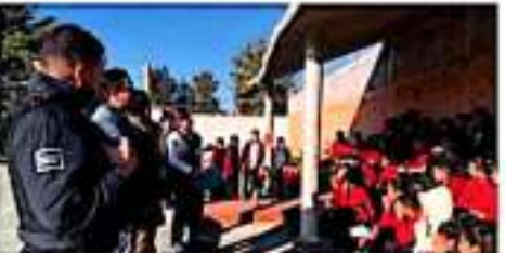
Con el objetivo de contribuir a una formación temprana de jóvenes estudiantes y evitar así conductas que lesionen y falten administrativas a, y promover a quien delinca, la Policía Mundial realizó charlas de orientación en instituciones educativas, en donde resaltan la importancia de lograr entornos saludables y con bienestar. IGORISA