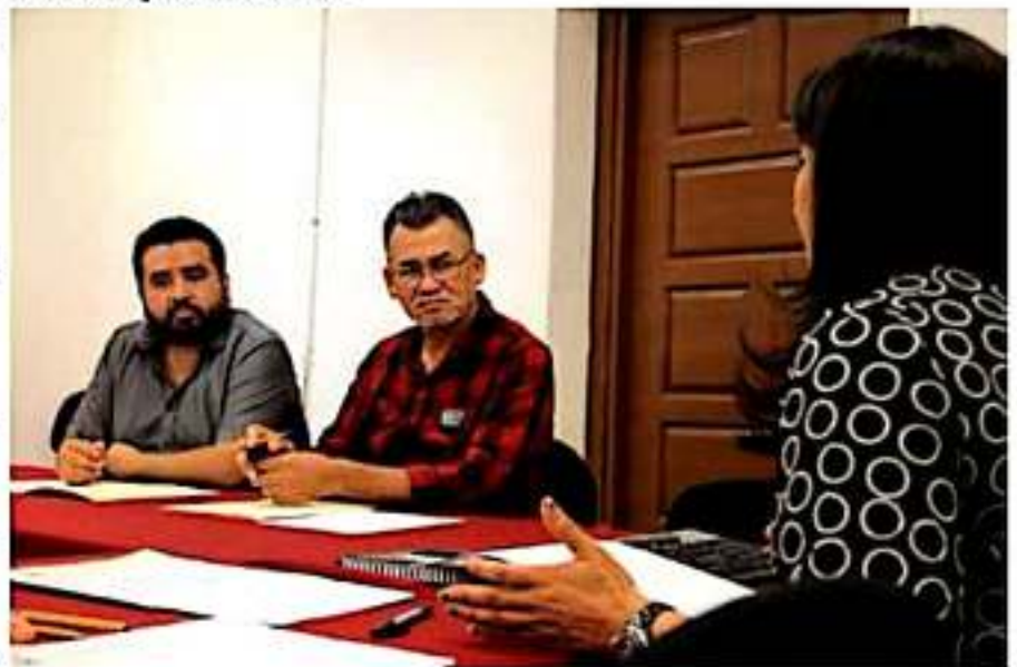
Aspecto de la reunión de trabajo de las integrantes de la comisión de Migración en el Congreso local.

El dictamen será turnado al Pleno, para su discusión, análisis y en su caso aprobación.