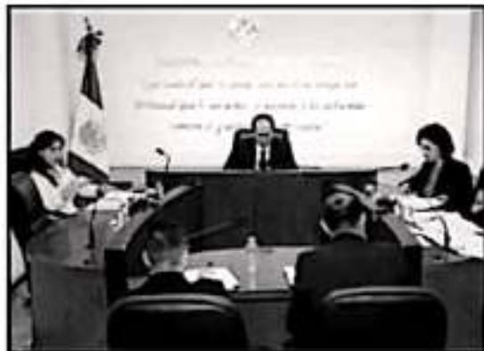
EL TRIBUNAL ELECTORAL DEL ESTADO DE MICHOACÁN DIÓ A CONOCER AYER MISMO EL FALLO SOBRE LA IMPUGNACIÓN DEL PARTIDO VERDE.