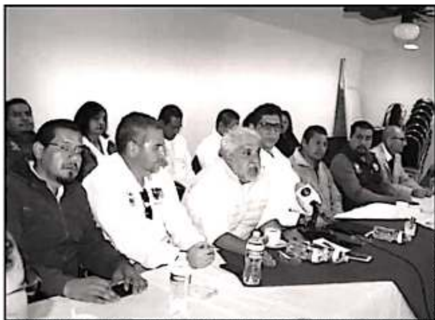
ESTE MIÉRCOLES TUVO UNA NUEVA SESIÓN EL SINDICATO ÚNICO DE EMPLEADOS DE LA UNIVERSIDAD MICHOACANA.

Es importante señalar que el sindicato había tomado desde hace varias semanas la Torre de Rectoría en protesta por la falta de pagos para los trabajadores manuales administrativos que integran el gremio, ya que persiste el