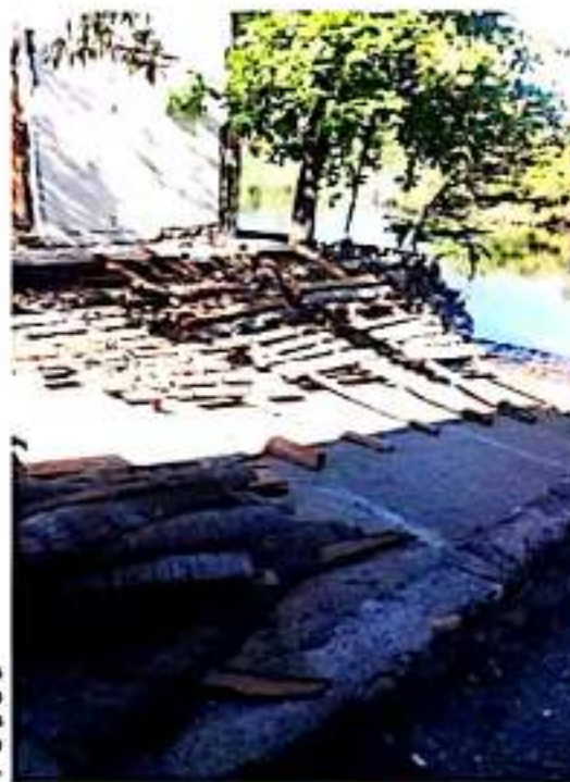
CD. LÁZARO CÁRDENAS, MICH.- Pescadores de Petacalco están construyendo arrecifes artificiales con madera de palma y otras estructuras, buscando su eficacia y precio accesible.

Una vez depositados los arrecifes en el mar, se estima un tiempo no mayor a 30 días para generar resultados, los cuales se ven reflejados en la mayor captura y venta de los productos, para lo cual dijo, una vez que estos generen producción, se dará un monitoreo constante, pues por su forma artesanal, (elaborados a base de palma), estos pueden desintegrarse con el paso del tiempo o fuertes marejadas.