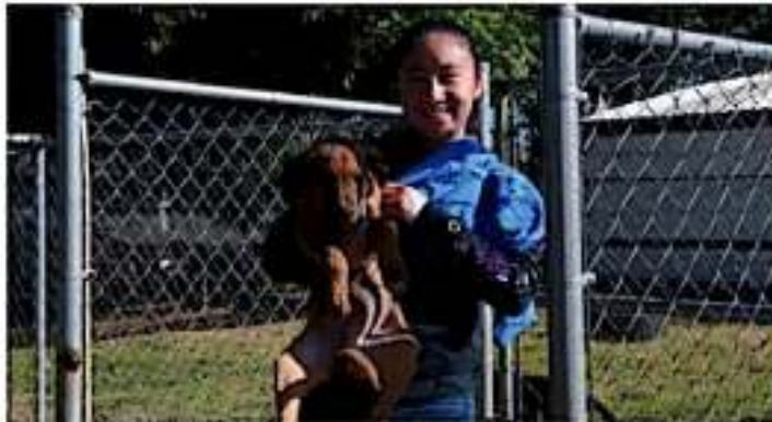
Autoridades hacen un llamado a la ciudadanía a probar la cultura de la adopción de mascotas. JOSEFINA

"No hay un censo en sí, que te digo cuántos perros tenemos en la ciudad de Morelia, pero sí tenemos más reportes de las orillas de la ciudad, como Villas del Psicológ, El Durazno, Trincheras, Salda y Mil Carreteras. Porque la gente va y en una caja tira a los perros, los cuales se comienzan a reproducir", explicó.