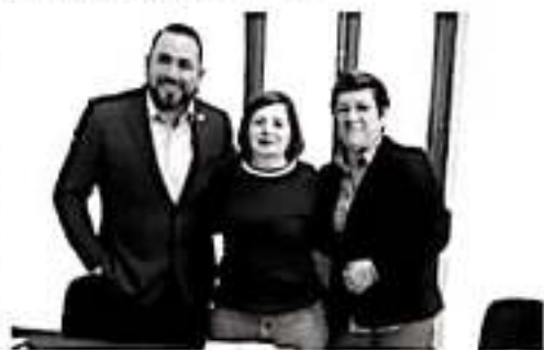
MORELIA, MICH.- Desde la Comisión de Desarrollo Urbano, Obra Pública y Vivienda en la LXIV Legislatura en el Congreso Local, se impulsarán reformas al Código de Desarrollo Urbano del Estado.

más de establecer sanciones y requisitos claros, para garantizar un desarrollo urbano equilibrado, sustentable, y humanizado.