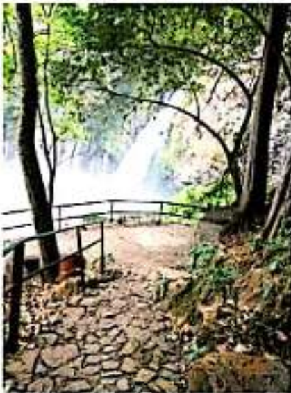
URUAPAN, MICH.- La administración del Centro Eoturístico La Tzaráracua aprovecha estos días de poco turismo para realizar labores de mantenimiento y remodelamiento para la llegada de la próxima "temporada alta", que será la Semana Santa y la Semana de Pascua.