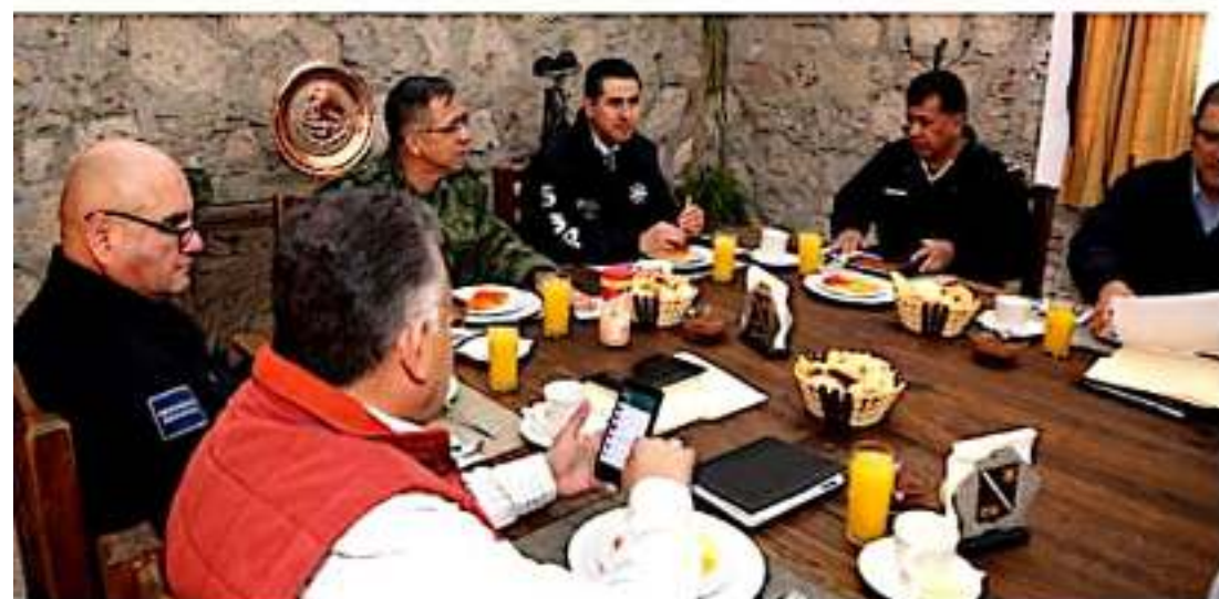
MORELIA, MICH.- La Mesa de Coordinación para la Construcción de la Paz en Michoacán trabajará en un esquema conjunto que contribuya a incentivar al personal.

De este modo, fue como ayer se llevó a cabo la invitación para estudiantes de nivel medio superior a participar en Expo Universitaria 2020, que tendrá verificativo el 20 de febrero en las instalaciones de la Feria Michoacán; "habrá más de 60 stands y actividades culturales", cerró.