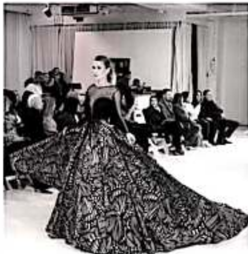
Inicio de su carrera al presentar sus primeros vestidos, sin embargo, hoy demuestra que la opinión de los demás no importa, si tú tienes claro lo que deseas.