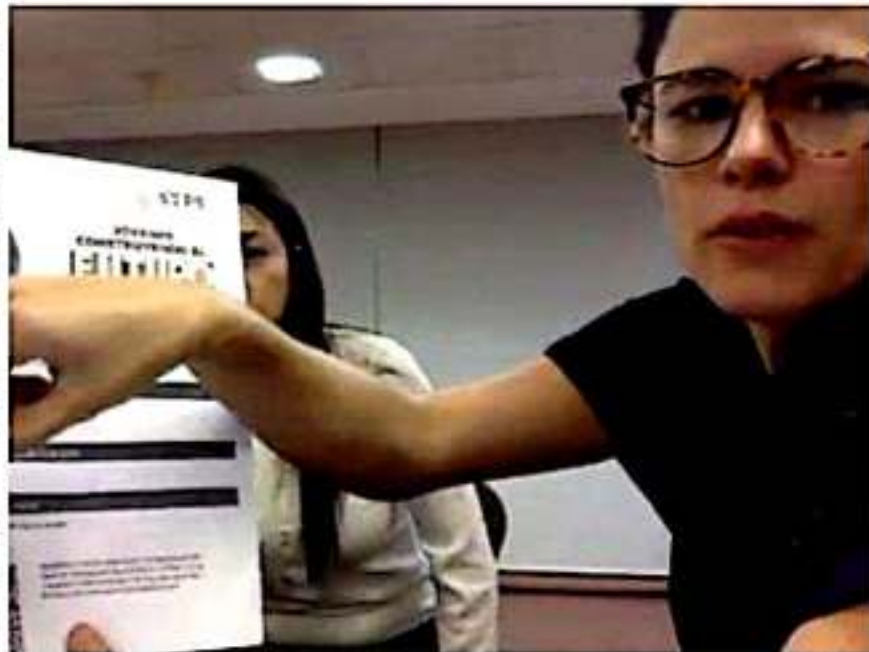
Aumentó la beca a 53 mil 748 pesos hasta por 12 meses, informó el gobierno federal.