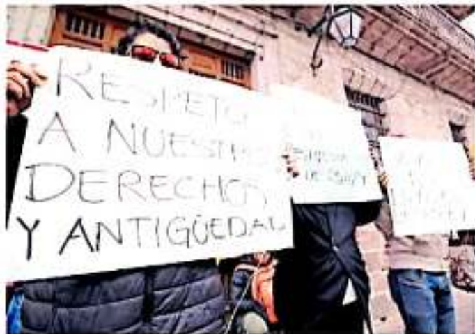
Se tiene contemplada una primera etapa donde se verían beneficiados más de 500 trabajadores.

Preciso que la información que tienen es por las publicaciones de medios de comunicación y no información oficial, sin embargo, señaló buscan acercamiento con la secretaria de Salud en Michoacán, Diana Celia Carpio Irujo, quien aparece en las fotografías junto al mandatario el pa-