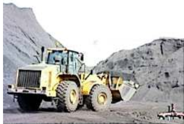
D. LÁZARO CÁRDENAS, MICH.- Durante el 2019, el Puerto Lázaro Cárdenas se consolidó por su operación en el manejo de carga de granel mineral al liderar este sector a nivel nacional.

La ubicación y características estratégicas del Puerto Lázaro Cárdenas, son fundamentales para llevar a cabo el traslado de las mercancías objeto de los intercambios de manera adecuada, ya que con ello brinda un impulso a la economía del país, marcando la diferencia para seguir posicionando a este recinto como la mejor opción en el movimiento de carga.