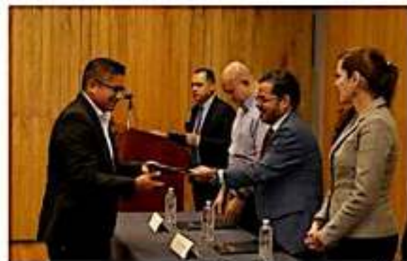
Justicia integral para adolescentes ya cuenta con facilitadoras y facilitadores certificados, es una realidad.

Es importante señalar que las certificaciones tienen una vigen-