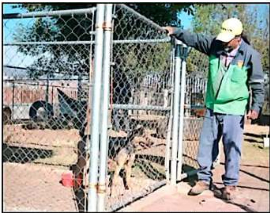
DE 30 A 40 PERROS AL MES RECIBE EL CENTRO DE ATENCIÓN ANIMAL, ALGUNOS LLEGAN EN MALAS CONDICIONES.