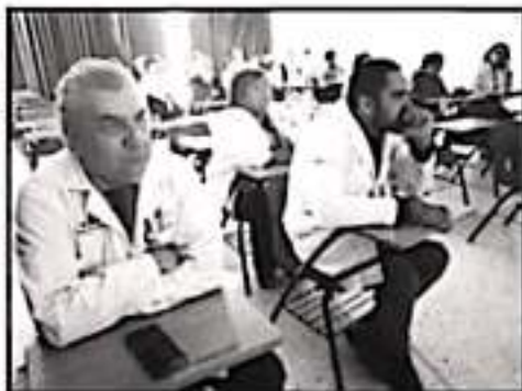
PERSONAL DE SALUD DE URUAPAN RECIBE CAPACITACIONES