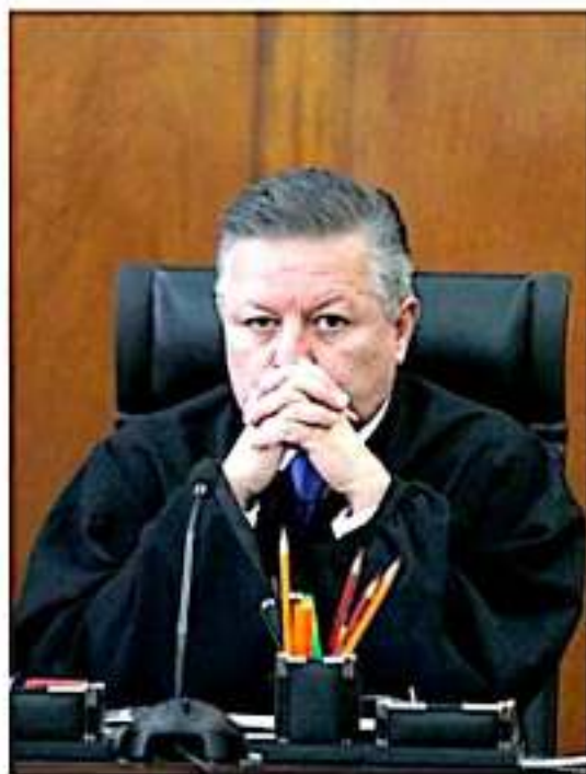
Arturo Zaldívar Lelo de Larrea.

3.- Y el tercer tema nada menor es el papel que en su momento tendrá que asumir el Gobierno del Estado, presidido por Silvano Aureoles Cone-