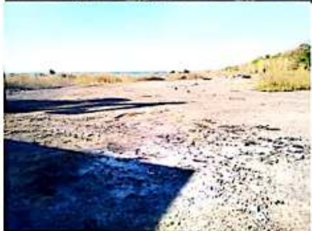
CD. LÁZARO CÁRDENAS, MICH.- El gobierno municipal, de la mano con la jefatura de tenencia de Caleta de Campos, trabaja para atender la presencia de los tiraderos clandestinos localizados en varios tramos de la carretera costera.

Es de señalar que durante este miércoles, fueron encontrados cuatro tiraderos clandestinos localizados en la tenencia de Playa Azul.