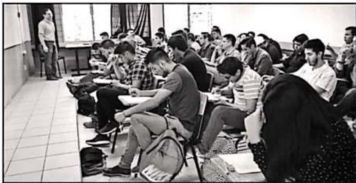
ENTRE PROBLEMAS DE REPROBACIÓN Y FALTA DE COBERTURA EDUCATIVA, BUENA PARTE DE LOS JÓVENES NO CURSA ESTUDIOS EN EL NIVEL SUPERIOR

Explicó que también la reprobación es uno de los competentes que impiden trayectorias educativas exitosas en Michoacán para el