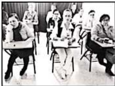
RECONOCEN QUE MALES RESPIRATORIOS SE HAN ELEVADO