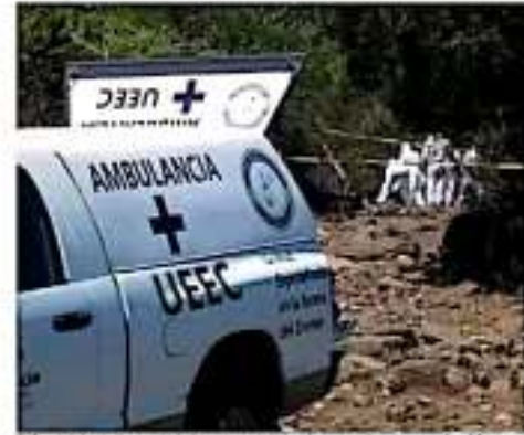
El PSCJ del estado señala la importancia de trabajar coordinado entre las diferentes instancias gubernamentales para combatir los delitos. JOSÉ LUIS

653 fueron delitos. En cuanto a feminicidios, la dependencia federal registró 12 casos, y 172 mujeres víctimas de homicidio doloso, en el mismo año. GUADALUPE MARTÍNEZ