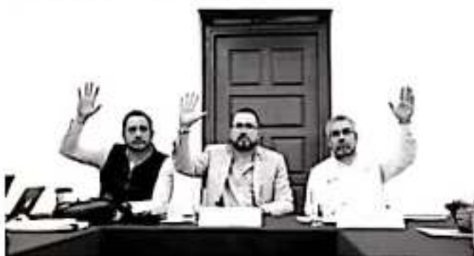
MORELIA, MICH.- La Comisión de Seguridad y Protección Civil del Congreso del Estado, analizó y dictaminó el informe que manifiesta el estado que guarda la Administración Pública Estatal.

En la Comisión de Seguridad Pública y Protección Civil, también se acordó que se agendarán reuniones con los titulares de la Secretaría de Seguridad Pública de Michoacán, del Secretariado Ejecutivo del Sistema Estatal de Seguridad Pública, de Protección Civil del Estado y de la Policía Auxiliar de Michoacán, a fin de resolver algunos dudas que han quedado y trabajar de manera coordinada en pro de las y los michoacanos.