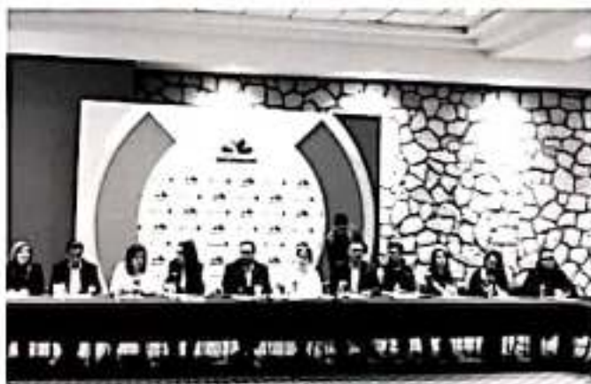
MORELIA, MICH.- La Secretaría de Desarrollo Económico (Sedeco), en coordinación con el Servicio Nacional de Empleo (SNE), llevó a cabo la Primer Reunión de la Red Nacional de Vinculación Laboral.