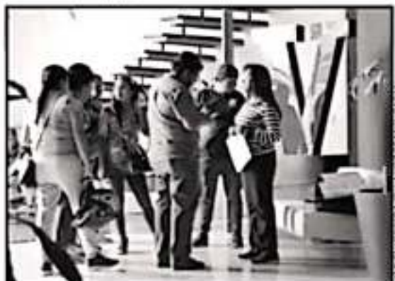
PADRES DE FAMILIA VISITARON ESTA CASA EDITORIAL PARA HACER LA DENUNCIA SOBRE LAS IRREGULARIDADES QUE VEN EN LA ESCUELA PRIMARIA.