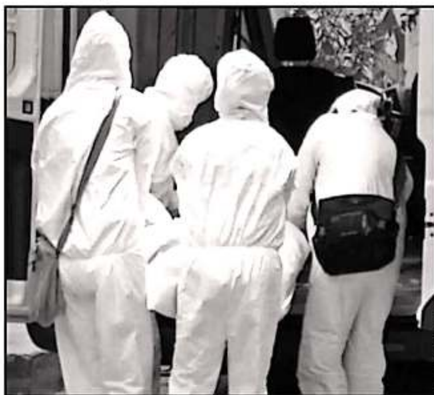
ANTERIORMENTE, ANTE LA FALTA DE CLAVES, LOS PERITOS ERAN CONTRATADOS COMO POLICIAS REGULARES

Por otra parte, los trabajos de investigación en los delitos del fuero común en el actual ses el principal objeto de la actual Fiscalía. Reconocen que, ante el au-