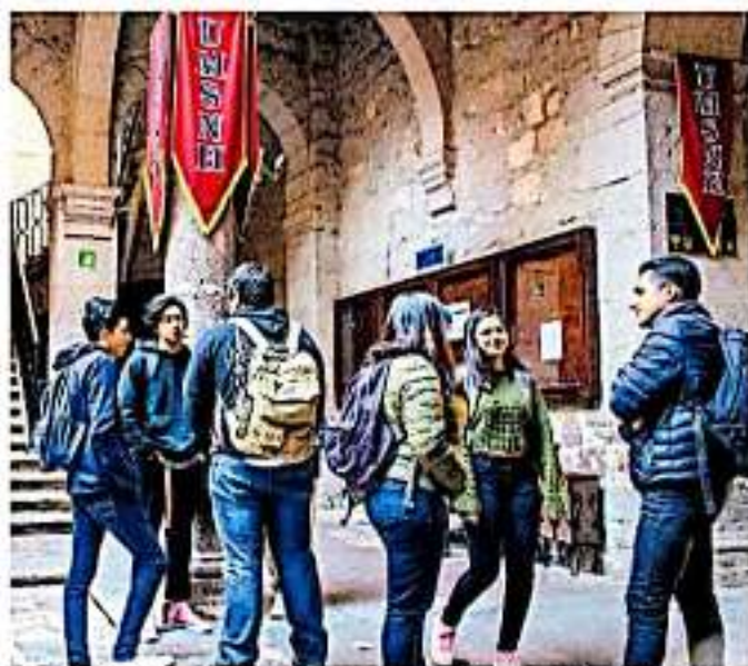
El 26 al 28 de febrero se llevará a cabo la vigésimo octava edición de ExpOrienta

Como ejemplo, el subsecretario expuso el caso de la región Zacapu, donde se ha impulsado la creación de carreras enfocadas a la agromotriz, así como ingenierías encaminadas a los procesos físicos que se necesitan para el campo.