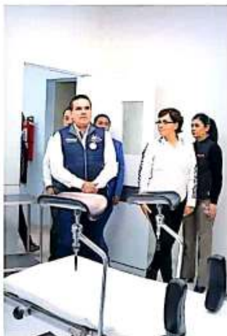
Con este nuevo acuerdo se brinda una mejor atención para que no falte personal de salud en centros de salud, unidades móviles y hospitales regionales. ■■■■■■■■■■

También enumeró la implementación "de esquemas novedosos para mejorar y ampliar la cobertura de atención a la población, mediante el sistema de Salud Digital y los Convojes de la Salud que brindan atención a las comunidades más apartadas". ■■■■■■■■■■