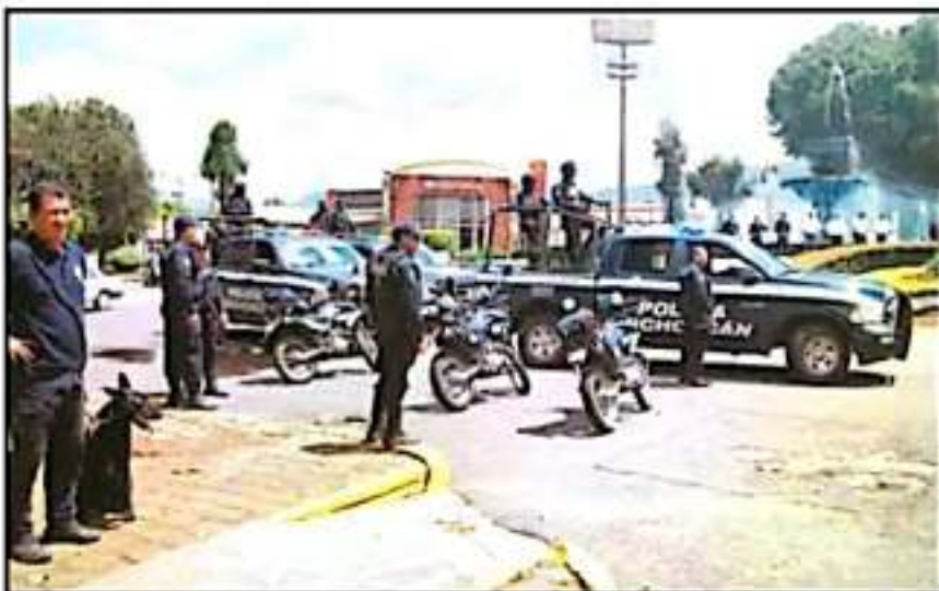
PARA MEJORAR EQUIPOS DE SEGURIDAD LOCAL, ESTE AÑO SE INVERTIRÁN 14 MDP VÍA FORTASEG MUNICIPAL.