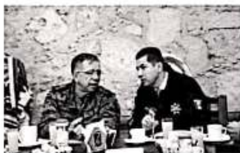
MORELIA, MICH.- La Mesa de Coordinación para la Construcción de la Paz en Michoacán acordó hoy trabajar en un esquema interinstitucional de reconocimientos al personal policial y castrense.