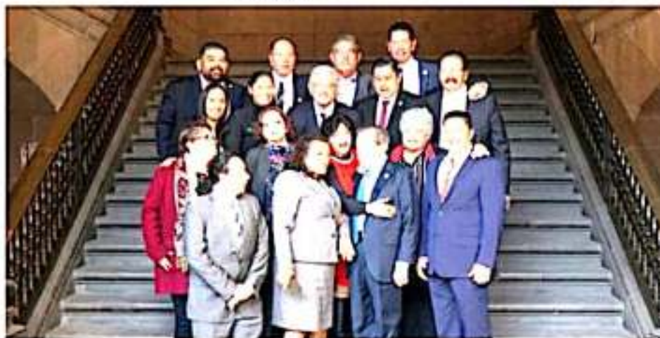
CD. LÁZARO CÁRDENAS, MICH.- El Grupo Parlamentario del Movimiento de Regeneración Nacional (Morena), se reunió este miércoles en Palacio Nacional con el presidente de la República, Andrés Manuel López Obrador.

"En reunión con nuestro presidente de México, Andrés Manuel López Obrador, hablamos sobre las leyes que nuestro país necesita para lograr el bienestar de todas y todos. La cuarta transformación avanza", destacó el también presidente de la Comisión de Recursos Hidráulicos, Agua Potable y Saneamiento del Congreso de la Unión.