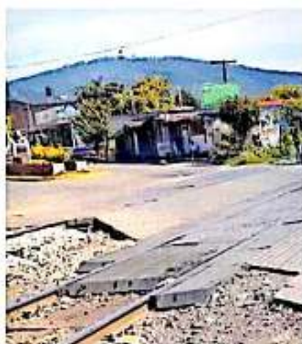
Representa una pérdida de más de 50 millones de pesos al día

MIL alumnos terminan sus estudios curriculares pero no se titulan