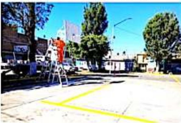
ZAMORA, MICH.- Se efectuaron labores de mejoramiento del espacio deportivo y recreativo del fraccionamiento Valencia, Segunda Sección.