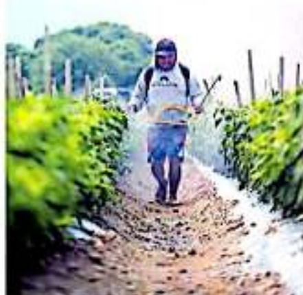
Buscan que amplíe la información en los programas impulsados en el campo