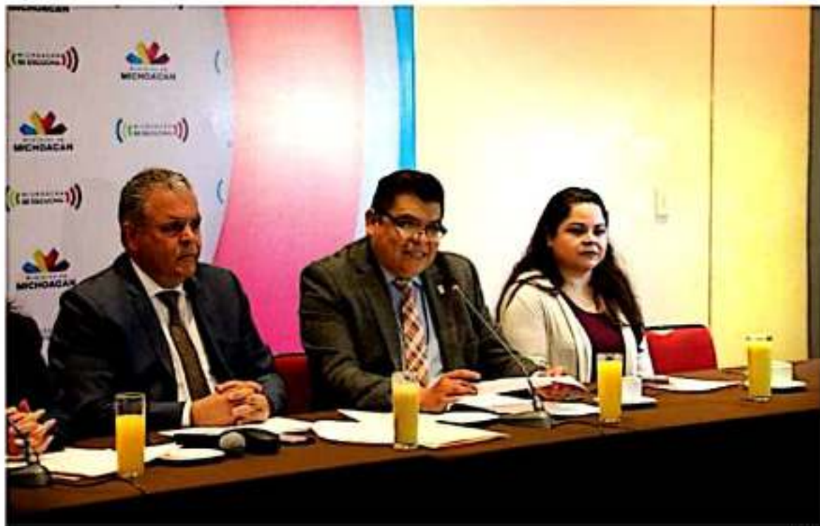
Orientar a las y los jóvenes michoacanos en la elección de su carrera universitaria, es fundamental para su futuro, señaló la SEE.

sus opciones para ingresar a la universidad. Queremos que escuchen sus sueños», subrayó.