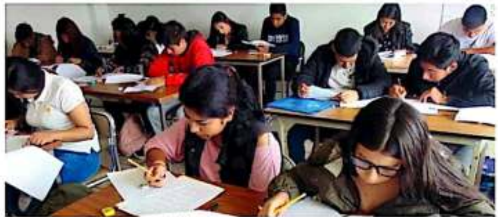
El primer día de febrero se llevó a cabo la segunda edición de la Expo Universitaria.