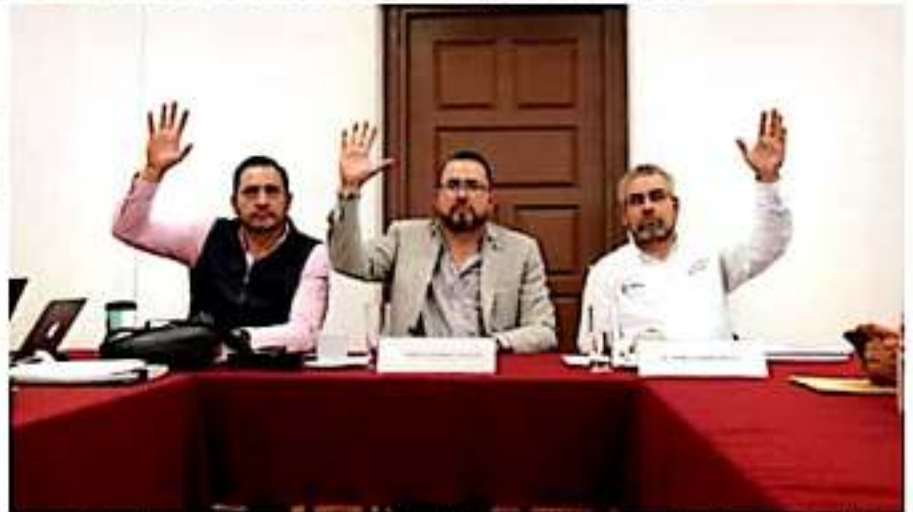
Se reúnen los diputados integrantes de la Comisión de Seguridad Pública y Protección Civil con titulares de diversas áreas de seguridad de Michoacán.

De igual forma se solicitó al titular del Ejecutivo Estatal para que informe y señale las acciones realizadas en materia de Protección Civil y de la misma forma se solicitó dar cuenta a la Auditoría Superior de Michoacán. ➔ 9