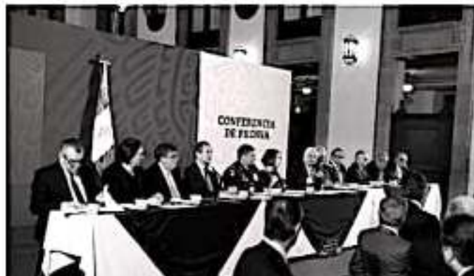
CIUDAD DE MÉXICO.- El presidente de México, Andrés Manuel López Obrador, se reunió con empresarios para acordar los detalles de la venta de boletos para la rifa del avión presidencial.

La intención de sustituir el avión anterior fue debido a que ya se encontraba a pocos años de restarse del servicio gubernamental, puesto que ya había cumplido con más de 28 años de servicio. Además de que la aeronave ya estaba impedida de aterrizar en distintas ciudades de importancia internacional ya que emite enormes cantidades de contaminación sonora, por lo que esto reducía su utilidad para viajes oficiales.