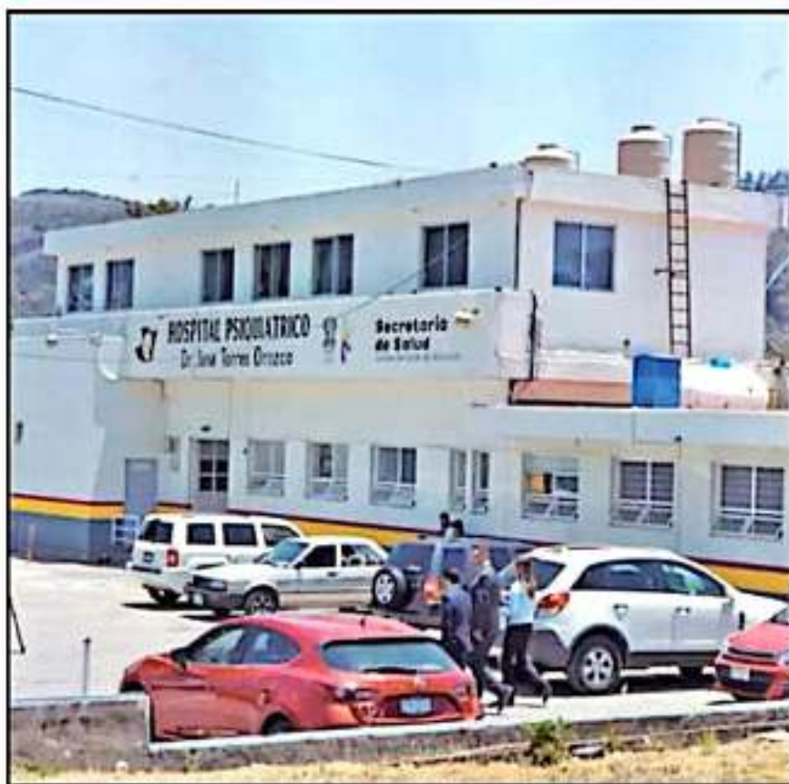
EL HOSPITAL PSIQUIÁTRICO REPORTA UN AUMENTO EN CONSULTAS, PERO UN DESCENSO EN HOSPITALIZACIONES.

400 de psiquiatría. En tanto que, dentro de la atención psicológica, un 40 por ciento corresponden a trastornos afectivos y de ansiedad, 30 por ciento a trastornos psicóticos, 15 por ciento a trastornos secundarios por consumo de sustancias tóxicas y 10 por ciento a trastor-