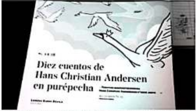
MORELIA, MICH.- Aprender una lengua indígena ayuda a preservar nuestras tradiciones, la cultura, historia e identidad de las y los michoacanos.