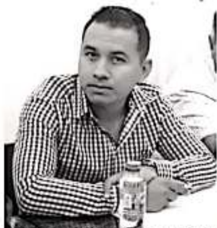
La educación es totalmente gratuita y el gobierno federal les hará llegar una partida presupuestal.

Dirigiéndose a los integrantes de las Sociedades de Padres de Familia de las escuelas, los exhorta a que no entren en conculterio con los maestros y que no se presten a ser ellos los que cobren las inscripciones o las cuotas voluntarias, y que se dediquen a defender a los padres de familia y los apoyen que es a quienes representan.