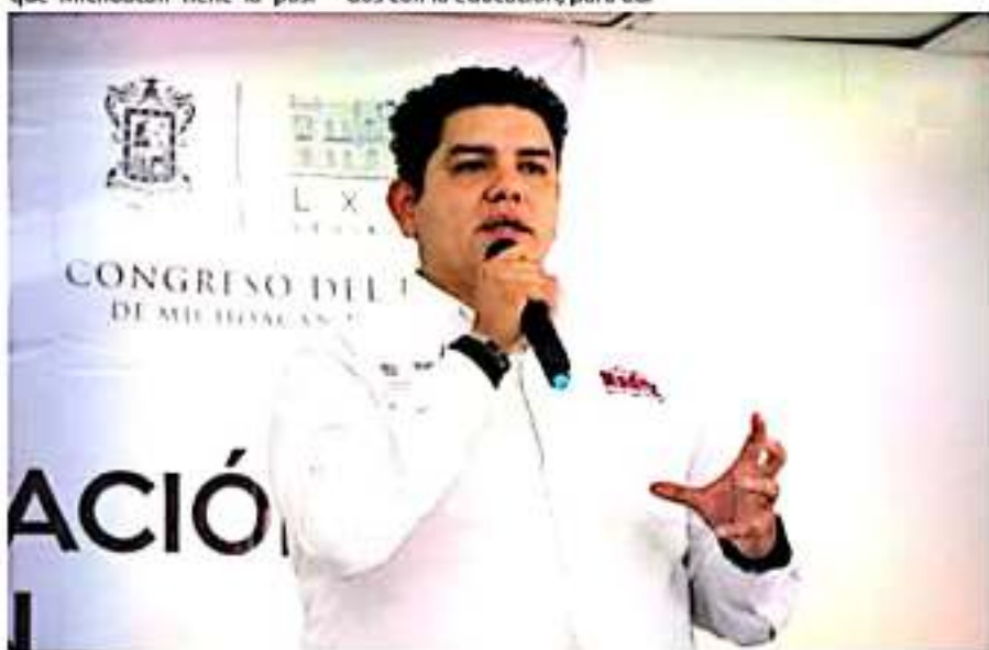
El presidente de la mesa directiva del Congreso estatal así lo reconoció durante la realización del Cuarto Foro de Consulta rumbo a la Ley de Educación en Michoacán.