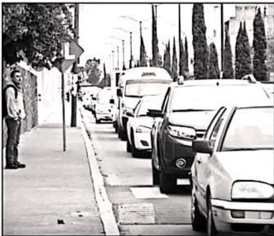
LA OFICINA DE RECAUDACIÓN ESTATAL BUSCA NEGOCIACIONES CON LOS AUTOMOVILISTAS QUE TIENEN ADEUDOS

rrera Tello, tras referir que cuando se ponen al corriente con estos trámites básicos, a los propietarios de las unidades se les pide toda la documentación y se aprovecha para verificar que toda esté en regla.