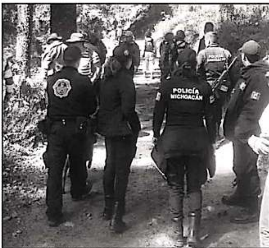
DURANTE LOS DÍAS QUE ESTUVO DESAPARECIDO HUBO DIVERSOS GRUPOS DE BÚSQUEDA EN TODA LA ZONA.