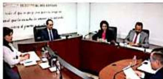
Sesión del máximo órgano jurisdiccional en materia electoral en la entidad.