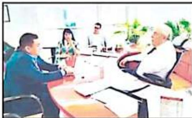
CON EL FORTASEG SERÁN REHABILITADOS EQUIPOS DE SEGURIDAD, DUD EDIL.