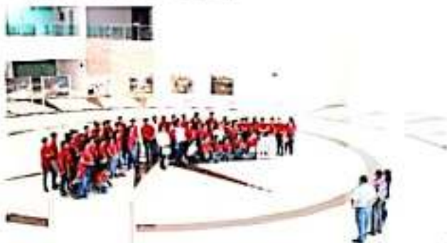
CD. LÁZARO CÁRDENAS, MICH.- La Administración Portuaria Integral de Lázaro Cárdenas destacó el programa permanente de atención a visitas escolares guiadas.

Una vez logrado el trámite, los visitantes conocerán en el interior del recinto la infraestructura más representativa como la Central de Emergencias, el Malecón de la Cultura y las Artes, buques y patios comerciales, la Torre de Control, el puente Albatros y el Edificio Corporativo de la Apilac; esta entidad hace la invitación extensa para que la comunidad estudiantil conozca desde dentro el perfil del recinto portuario.