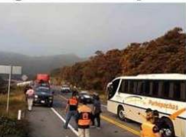
La aseguradora Qualitas puso a disposición de familiares de las personas intoxicadas por el derrame de amoníaco a raíz del accidente de una pipa en la autopista Siglo XXI, un número telefónico o acudir directamente a las oficinas en Lázaro Cárdenas para agilizar trámites de atención médica e indemnizaciones.

La aseguradora Qualitas, con quien la pipa accidentada el pasado viernes por la noche en la autopista Siglo XXI tiene contratado el seguro respectivo, ha solicitado a los familiares de las personas intoxicadas a realizar cuanto antes el trámite ante el Ministerio Público, donde >>> 2