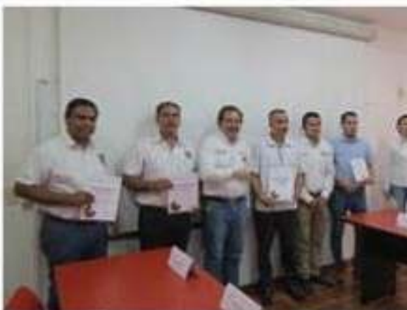
La Autoridad Sanitaria ha certificado ya a 21 inmuebles de la ciudad libres 100% de humo de tabaco.

De acuerdo con la Organización Mundial de la Salud, cada seis >>> 3