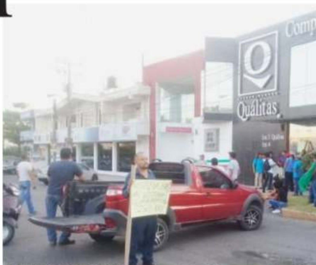
CD. LÁZARO CÁRDENAS, MICH.- Familiares de las víctimas que resultaron intoxicados en un accidente en la autopista Siglo XXI, se manifestaron en las afueras de las oficinas de la aseguradora Qualitas, para exigir un rechazo, debido a la negativa que ha tenido con los afectados para otorgar el pago de la indemnización por la calidad.

Bernardo Zepeda zona por derrame de amoniaco