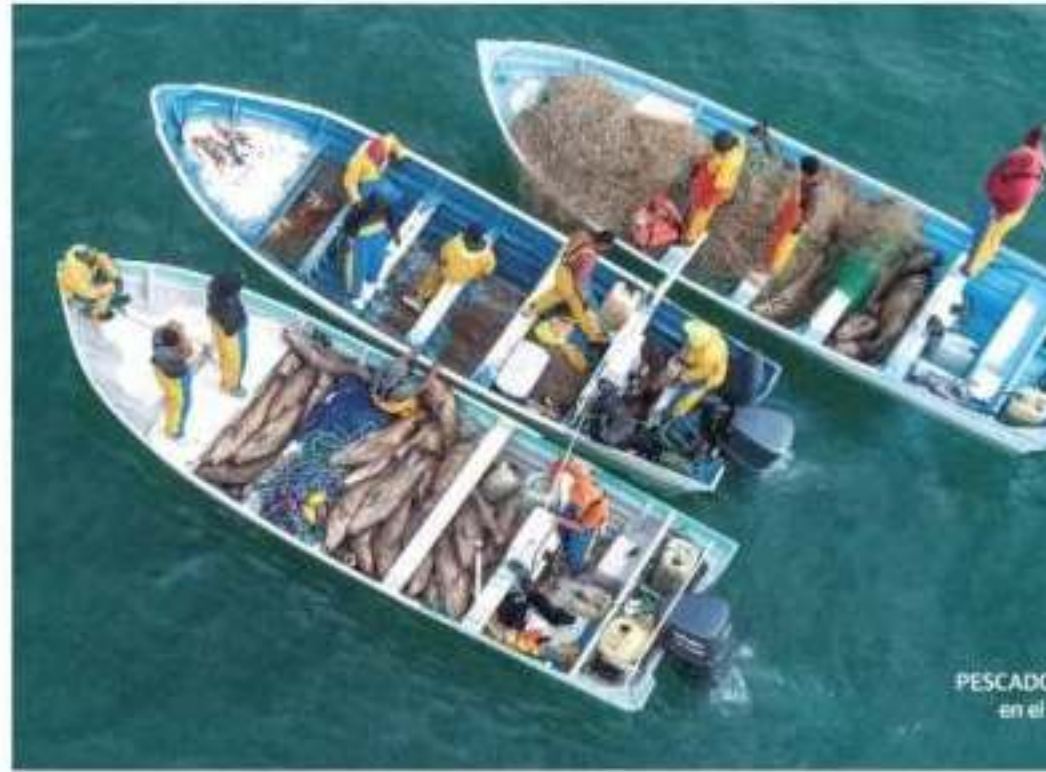
PESCADOS en el

Descubren ambientalistas pangas que pescan ilegalmente y a plena luz del día en San Felipe, Baja refugio de la vaquita marina, en peligro de extinción; capturan y quitan el buche a al menos 500 pes