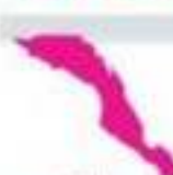
BAJA CALIFORNIA SUR