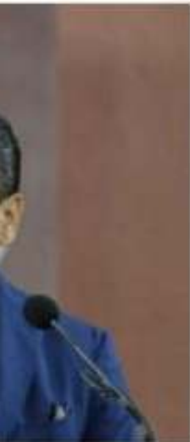
El reflejan una reducción de corrupción en el estado, dijo Aureoles Conejo.

Aureoles apoyo a mecanismos e instituciones que la combaten Jornada del Día Internacional Contra la Corrupción