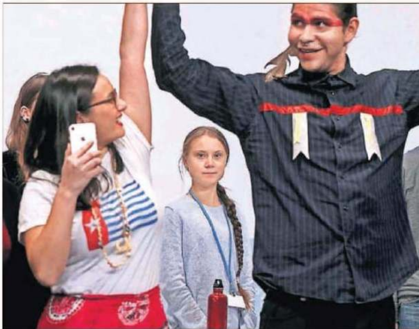
GRETA THUNBERG CEDE PROTAGONISMO EN LA CUMBRE. La activista sueca de 16 años, icono de

de las revueltas de 2001, la dividía para proteger la Casa Rosada. Fernández quiere "terminar con las divisiones y unir a la Argentina". Tomará el bastón de mando de manos de Mauricio Macri, quien ha prometido una "oposición constructiva". Fernández re-