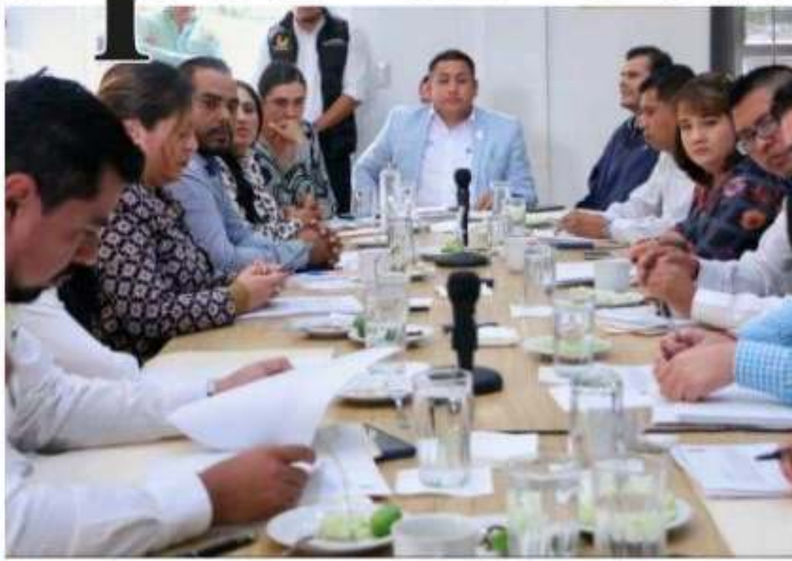
URUAPAN, MICH.- Obras importantes para el desarrollo urbano del municipio, fueron aprobadas por el Cabildo.

Se pide al gobernador a cambiar patrones para acabar con la corrupción