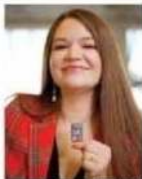
Brittany Kaiser, exdirectora de Cambridge Analytica.

adado proceso México, todos políticos comitación a Camrica para tratar es comicios. rgo, el rezaó en muchas c. unado a la os nacionales, bajo de la emarecida luego por el mal uso obtenidos de a ayudar en la 016 en Estados cual Donald victorioso.