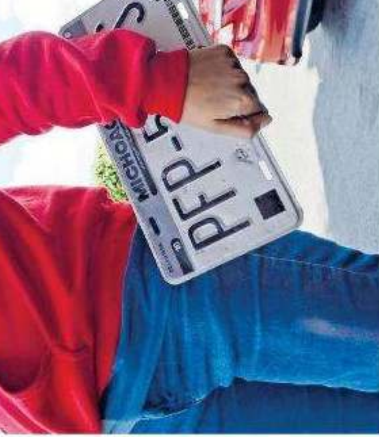
Se contempla un incremento de 2.84 por ciento por calcamán

En lo que respecta a ingresos por productos, el catálogo contempla un incremento de 2.84 por ciento por calcamánias u hologramas y certificados para la verificación vehicular de emisión de contami-