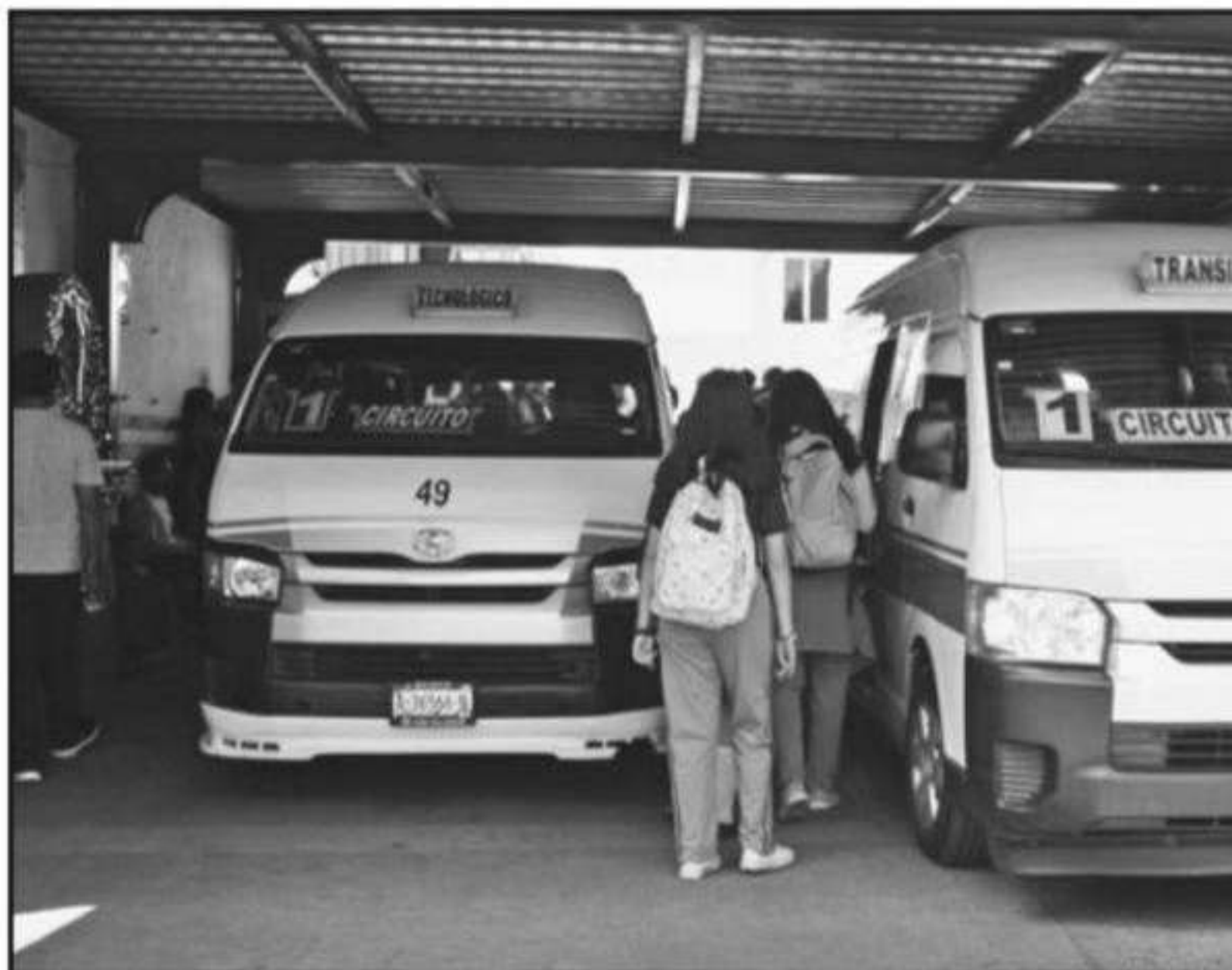
LA RUTA GRIS ES UNO DE LOS GRUPOS DE TRANSPORTE PÚBLICO QUE LLEVAN A VERIFICAR LAS UNIDADES Y SE HA DISTINGUI

siendo únicamente detenciones de apercibimiento. A pesar de que la legislación local establece un tabulador de multas para quienes siguen incumpliendo con esta determinación ambiental, las autoridades de Michoacán aseguran que se mantendrá, de manera indefinida, la prórroga