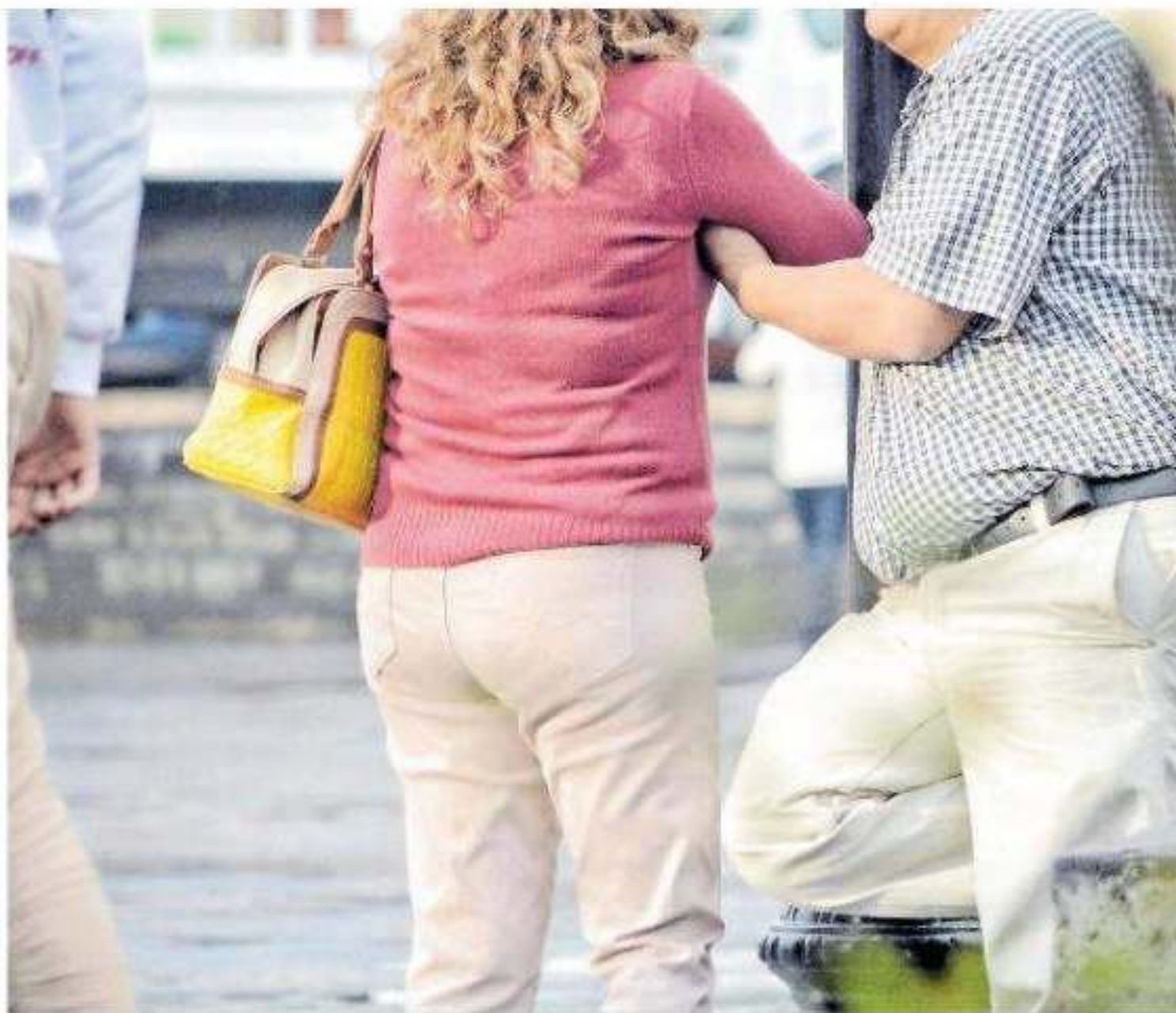
Las mujeres michoacanas se enfrentan a agresiones del esposo o pareja actual

L a tasa de incidencia en delitos relacionados con violencia hacia las mujeres ha ido en aumento en la capital del estado, y es que al corte de octubre de este año el Secretariado Ejecutivo del Sistema Nacional de Seguridad Pública (SESNSP) informó que las investigaciones por el presunto delito de feminicidios eran nueve, cuando durante todo 2018 hubo dos casos. Registrando un alza de 350 por