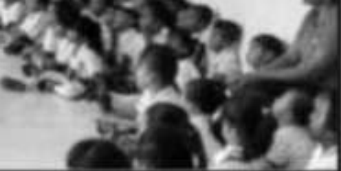
FESTIVAL CUENTA CUENTOS, PARA IN- ENTRE LOS NIÑOS DEL PUERTO.