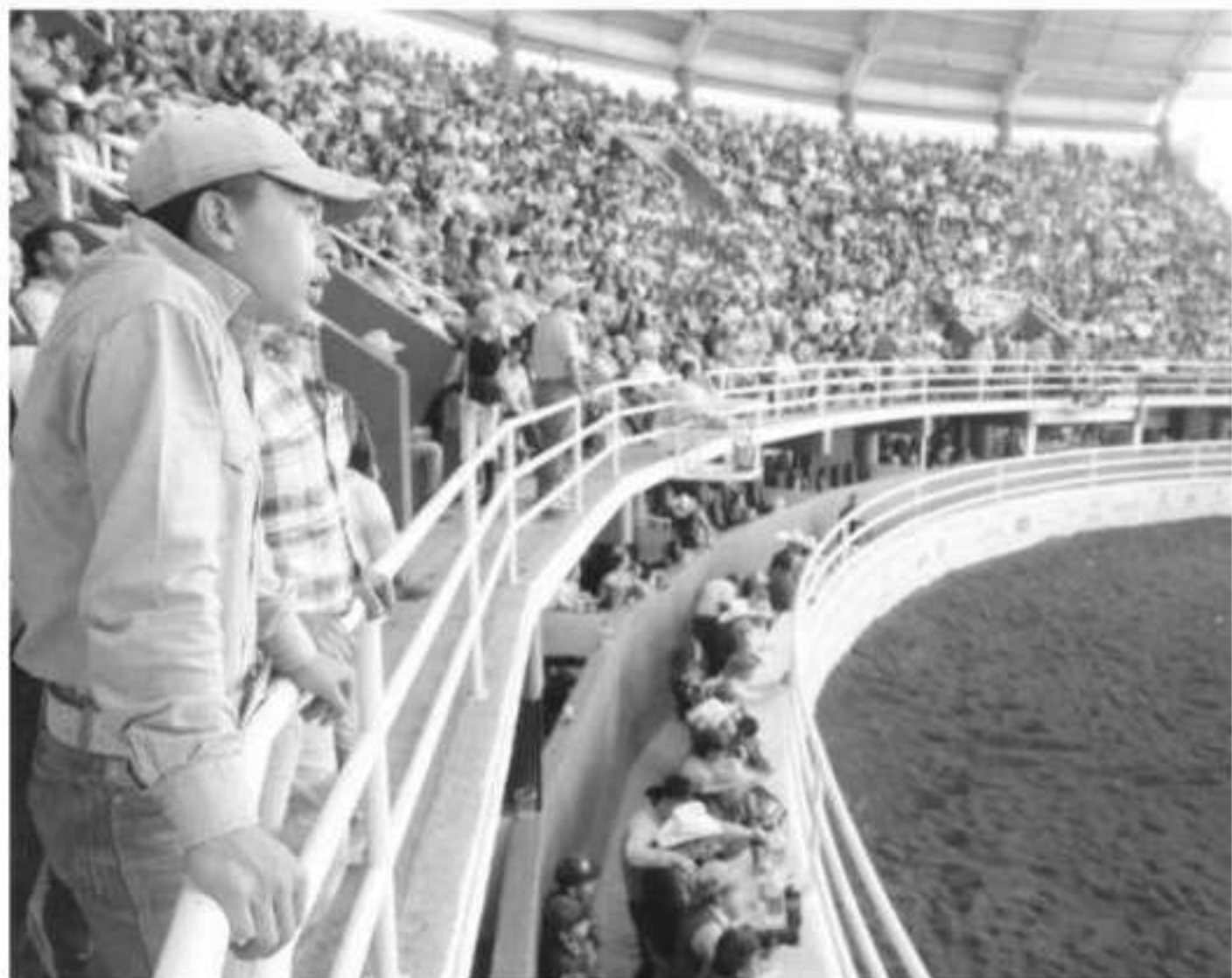
Emoción y fiesta se vivió en las eliminatorias del Campeonato Nacional Charro, a las cuales asistieron cientos de familias al Pabellón Don Vasco en Morelia.

> Emoción y fiesta vivieron los asistentes a las actividades de las categorías