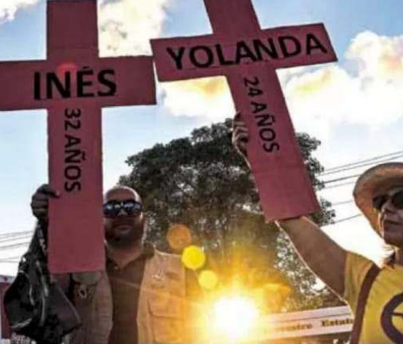
El 25 de cada mes se conmemora el "Día Naranja", para concientizar sobre la violencia de género.

"Las instituciones y la sociedad civil organizada pueden crear campañas que permitan visibilizar y denunciar el fenómeno de la violencia contra las mujeres en general"