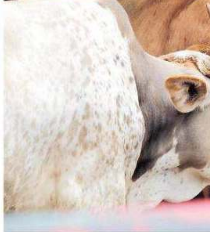
El Centro Estatal de Fomento Ganadero también va a bajar

Para otros rubros como el de la Secretaría de Salud de Michoacán (SSM) hay un incremento de 19 por ciento al pasar de 299.2 millones de pesos en 2019 a 358.2 millones de pesos para el 2020, mientras que en la Unidad Programática Presupuestal (UPP) es de 4 mil 213 millones de