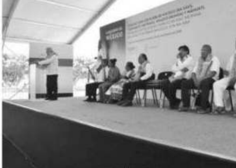
El presidente Andrés Manuel López Obrador dijo que si a información sobre la desaparición de los 43 normalistas y reciente asesinato del activista Arnulfo Cerón, el gobierno

en los límites de Sonora y Chihuahua. En el ataque murieron tres mujeres y nueve niños. Según el Gobierno mexicano, el brutal crimen podría deberse a un choque entre cárteles que se disputan la región