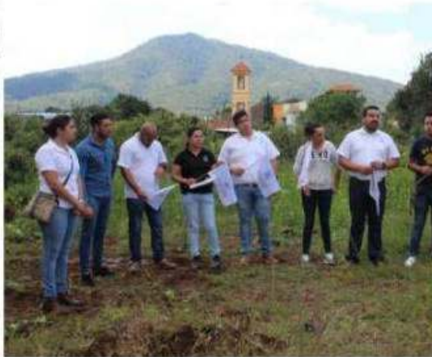
TINGÜINDÍN, MICH.- Inició la construcción de la Casa de Salud de la comunidad de San Juanico.