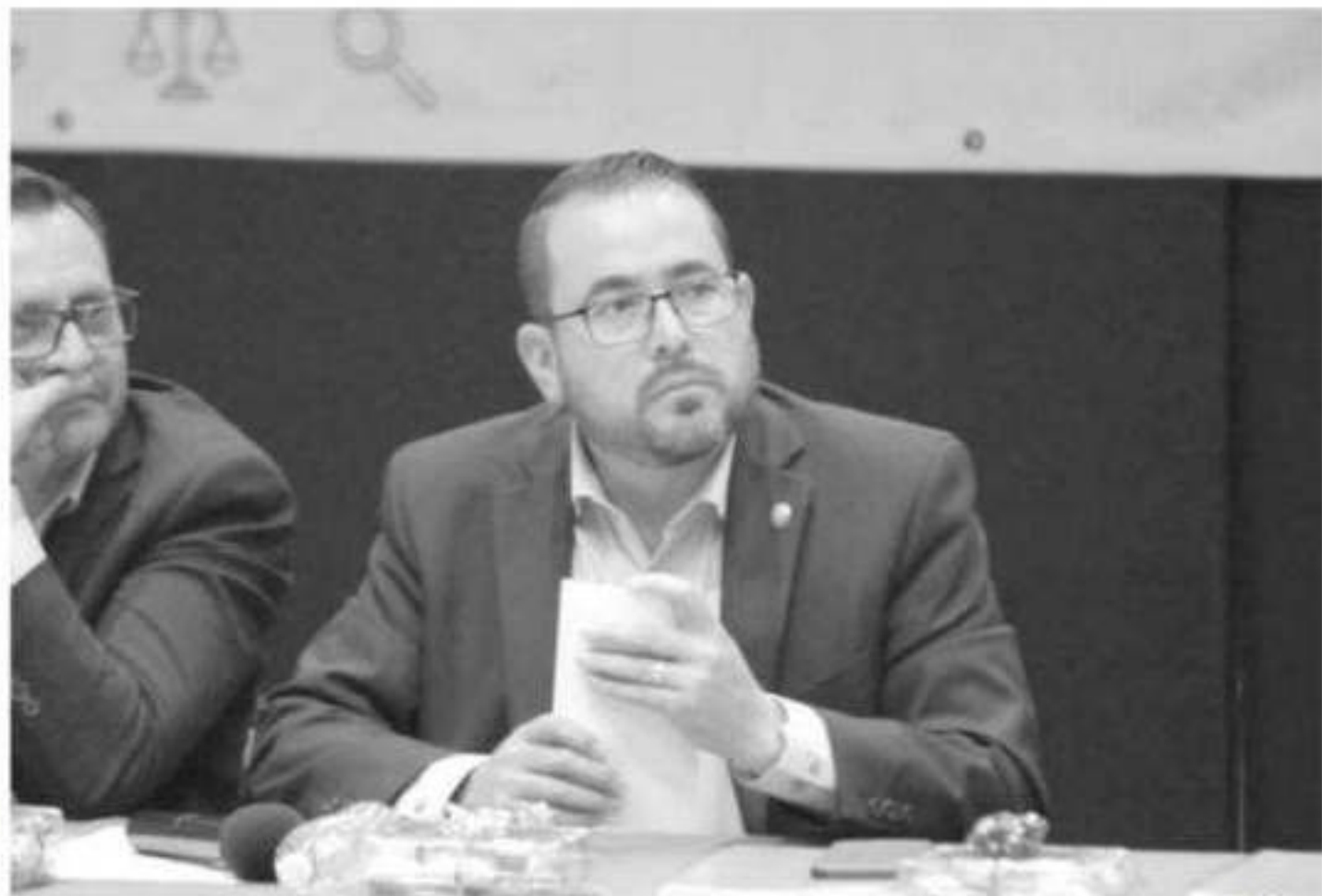
Humberto González Villagómez, diputado integrante de la Comisión de Fortalecimiento Municipal y Límites Territoriales del Congreso del Estado.