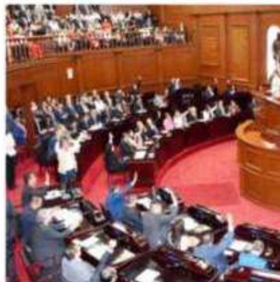
MORELIA, MICH.- De acuerdo a la propuesta del Congreso del Estado, 12 de las 82 unidades presupuestales sufrirán recortes importantes en los recursos a eje

posmoderno del compositor; y el tercer movimiento de la Sinfonía de Cámara de John Adams (1947), obra compleja en interpretación debido a su estructura tonal; fueron parte del repertorio.