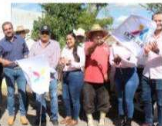
CH.- El alcalde y miembros de su gabinete, de obras para la construcción de la red de la comunidad de El Colongo.

Recordó que hace unas semanas, iniciaron la construcción del módulo de baños de la escuela primaria Miguel Hidalgo y que están en proceso de conseguir el recurso para su comedor escolar, el tema de la educación es una prioridad para mejorar las condiciones de los ixtlianenses.