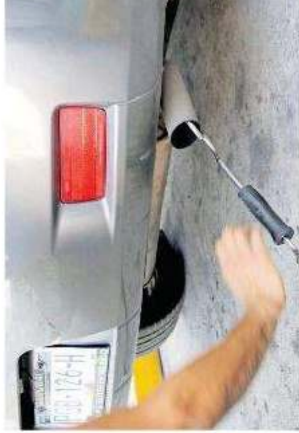
exentar programas de "Hoy no circula" y Contingencias ambientales en la zona metropolitana del Valle de México" y a los autorizados tan un incremento