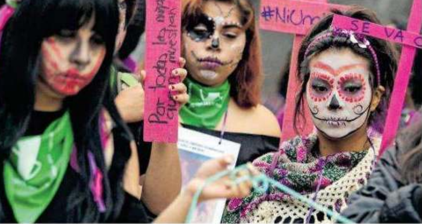
tas más altas del país en violencia contra la mujer

re pasado iban 291. En el acias por violación simple tubre, en tanto que en el n 58. Por lo que toca a los sexual, fueron 339 en el do, y hasta octubre de es- registro de 328.