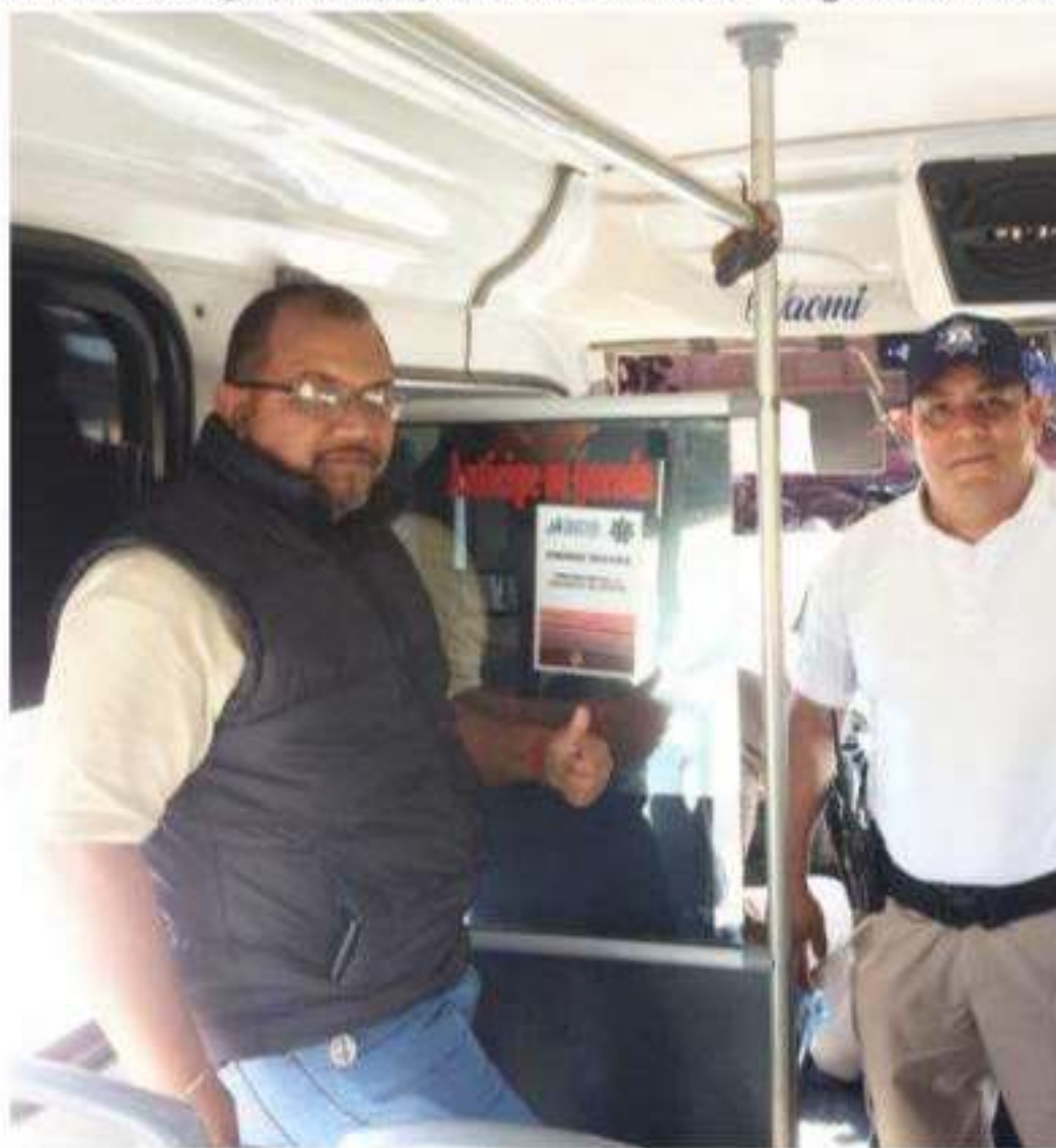
ZAMORA, MICH.- En el marco del Día Internacional de la Eliminación de la Violencia se comprometieron a generar entornos de unidades seguras contra el acoso.

violencia de género, donde se puede a apoyo. En el opres de los líderes de la Coordinadora del personal del Dep Delito, ya tas acco Fortaseg. Todos co violencia de géne denuncia y hacer seguras dentro de