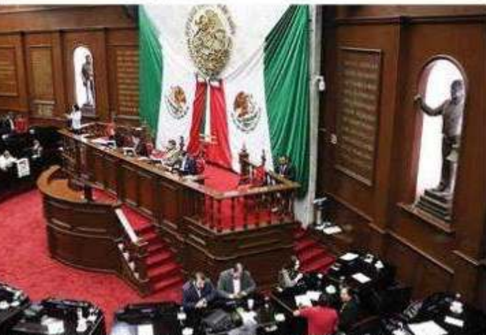
Presidentes locales exhortaron a los ayuntamientos a diseñar planes para el cambio de luminarias.