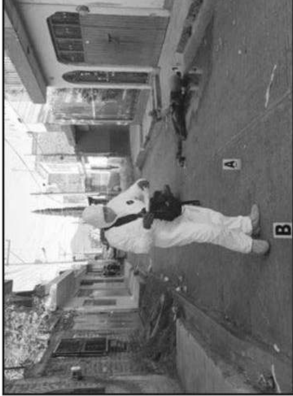
MICHOACÁN PODRÍA CERRAR EL 2019 CON UNA CIFRA DE HOMICIDIOS QUE SUPERARÍA LAS ESTADIS