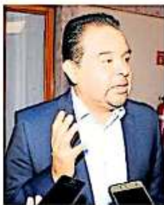
Urgieron a que se realice la medida para pagar quincenas. ANED/VO

"No podemos estar con que unos sí y otros no. Quizá de momento sólo se autoricen esos 10 predios (notificados en el proyecto de decreto) y después el resto de bienes, pero el gobierno debe completar el paquete para su debida análisis". Además, dijo que para ello podría definirse una sesión extraordinaria pronto, a pedido de la Jucopo, la próxima semana.