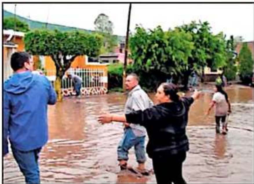
DECENAS DE CASAS SUFRIERON AFECTACIONES ERAS LA TROMBA QUE AZOTO AL MUNICIPIO DE JIQUILPAN.