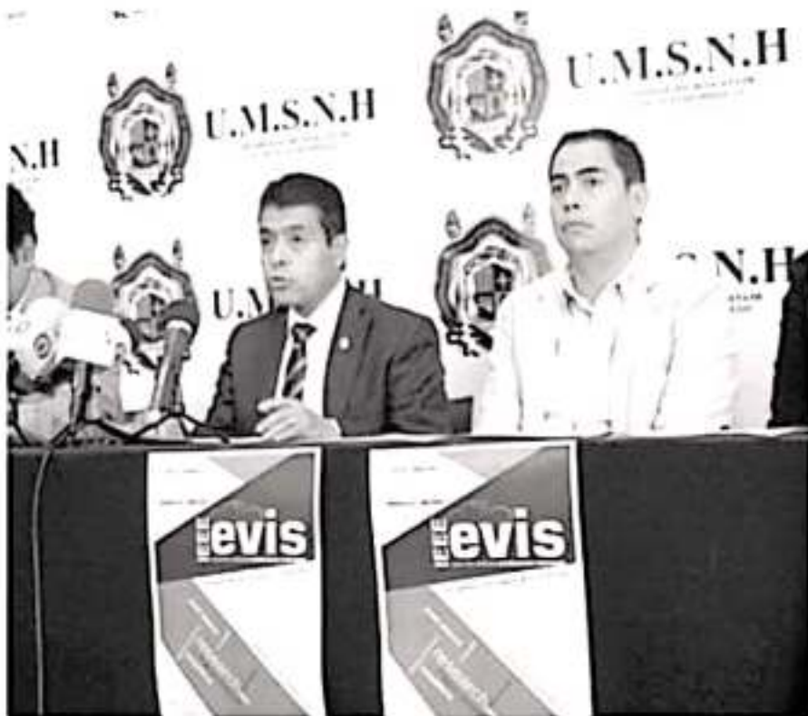
Ayer se anunció el 4º Simposio Internacional de Vehículos Eléctricos en la UMSN; evento único en su tipo que se realiza a nivel nacional.