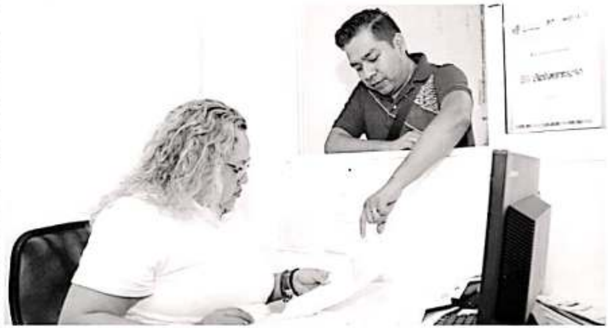
La ciudadanía puede realizar los reportes en los perfiles de redes sociales de la SFA, 070 opción 2 o directamente en las oficinas de Rentas.

La SSP aceptó pero no cumplió las recomendaciones.