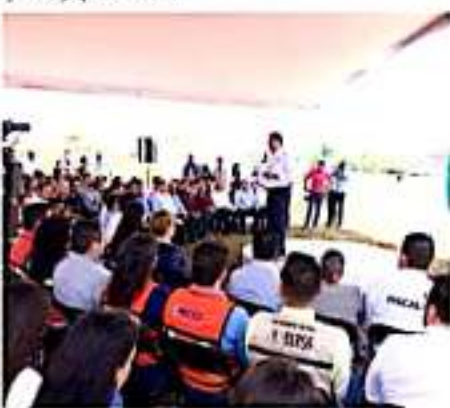
ZAMORA, MICH.- Con el apoyo del gobierno estatal, el panorama es favorable en materia de mejorar la red carretera regional.

Aseguró que las carreteras son un acceso indispensable para el desarrollo de la región, se mueven la economía, se generan empleos; además de anunciar que se construirá también el tramo Ecuandureo-La Piedad, y con ello conectar todo el Bajío, conectarse con Guanajuato y Querétaro.