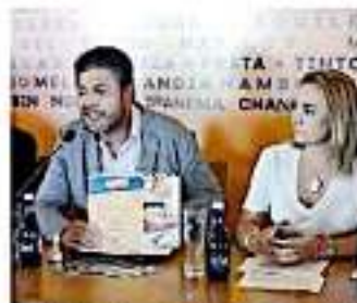
Será el 10 de septiembre cuando se defina el sitio. —CAROL HERNÁNDEZ

De manera particular, la plantilla laboral de empresas podrá tener acceso a los siete cursos de certificación en materia de desarrollo comunitario o asistencia técnica, además de profesionalizarse en herramientas digitales.