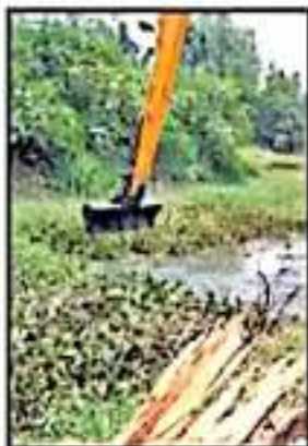
ALCALDIA DE LA PIEDAD MANTIENE PROGRAMA EN CANALES.

Finalmente, las autoridades locales de Jiquilpan han anunciado que se trabajará en la zona afectada y se mantendrá también una alerta permanente para responder de manera inmediata en caso de nuevas lluvias que pudieran poner en riesgo la integridad de los habitantes de estas comunidades; se trabaja de momento, señalaron, en las labores de limpieza y revisión para evitar brotes epidémicos.