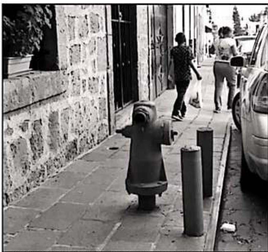
CASI LA MITAD DE LOS HIDRANTES DE LA CIUDAD NO FUNCIONA, ADEMÁS DE QUE SON INSUFICIENTES AUNQUE SINTIERAN.

ban ni habilitados porque no tenían presión y se hicieron trabajos de manera interinstitucional para hacer mejor el servicio. En el hidrante de la secundaria 2 tenemos tiempos desde a las 04:00 de la tarde, por los cambios de válvula, ya no intentan presión y ahora está habilitado las 24 horas del día, tenemos habilitado el de Bartolomé de las Casas en el Centro Histórico, que no hay ni tanta presión y ahorita tiene mayor número de galonaje en agua", manifestó el funcionario municipal.