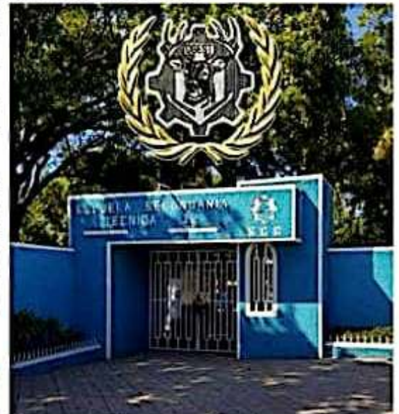
Miles de estudiantes de instituciones de nivel básico, como la secundaria técnica 12 de esta ciudad, corren el riesgo de quedarse sin clases a partir del próximo lunes, si entra en un paro indefinido de labores por parte del magisterio democrático en todo el estado.