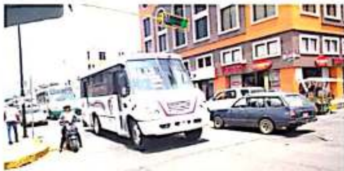
ZAMORA, MICH.- Concretar el proyecto para reubicar la red de paraderos del transporte público urbano, es una responsabilidad del municipio, señalaron funcionarios de la Cocotra.

Este es el caso de la parada que se localiza en el cruce de las calles 5 de Mayo y Colón, donde las unidades de transporte concesionado se agolpan en horas pico y cortan la circulación rumbo a Colón y la misma 5 de Mayo, ya que se atraviesan con miras a pasar el semáforo cuando está en luz ámbar y obstruyen el paso a otras unidades, así como a los peatones que tienen que sortear entre el microbús y otras unidades para cruzar la avenida.