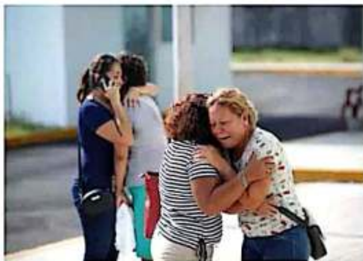
La Fiscalía General de la República (FGR) inició la investigación a solicitud del presidente López Obrador.

No obstante, la Fiscalía General de Veracruz precisó que, tras su detención, el hombre fue puesto a disposición de la Delegación Estatal de la República General de la República (DGER), donde el día 18 de julio del año en curso se inició la carpeta