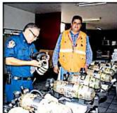
La estación de Camelinas se encuentra actualmente en proceso de licitación.

Así, instrucción del alcalde, se llevarán a cabo inspecciones de rutina y quienes no cuenten con las medidas correspondientes serán acreedores a una sanción.