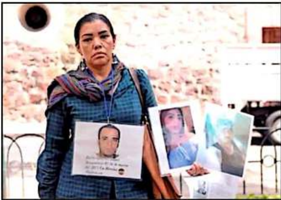
ACTIVISTAS BUSCAN A SUS FAMILIARES POR TODO EL ESTADO Y EL PAÍS. DENUNCIAN QUE DATOS NO SON ACTUALES

ciéndoles mal a nadie", expresó la activista, en conferencia de prensa.