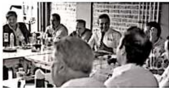
ZAMORA, MICH.- El Gobernador de Michoacán, Silvano Aureoles Conejo, encabezó una reunión con empresas productoras de la región Bajío.

nuevo fiscal regional que está debidamente preparado con toda la experiencia para trabajar de manera coordinada y reforzar el tema", señaló. Luego de escuchar las necesidades de los hombres de negocio, el mandatario aseguró que dará continuidad al proyecto de rehabilitación de la Casa de la Cultura, reforzar las acciones a favor del cuidado al medio ambiente, así como la inversión en infraestructura carretera y obras públicas.