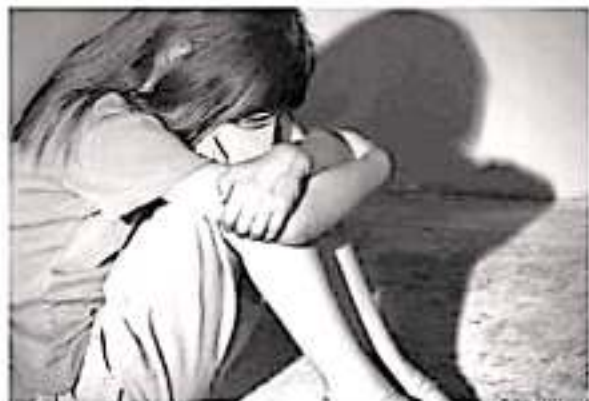
Ante el aumento de las víctimas de delitos, la violencia contra niños y la carencia de atención en adicciones, se requieren que los diputados ejerzan sus funciones para las que fueron elegidos.

Cabe señalar que la Unicef considera a la Crianza Positiva como una alternativa que genera en los infantes una mayor seguridad, una alta autoestima, así como la apropiación de límites, necesarios para una sana convivencia