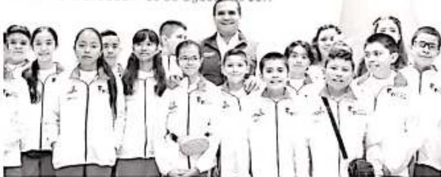
El gobernador Silvano Aureoles, reiteró que si habrá pago este viernes a los profesores; sin embargo la CNTE anunció movilizaciones para reclamar su salario.

Morelia, Michoacán - 28 de agosto de 2019