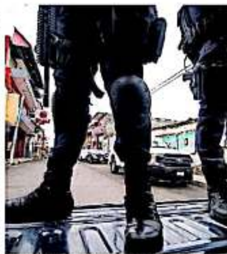
La comisión advirtió 8 recomendaciones por violaciones a la legalidad y seguridad jurídica

En otra queja, ZAR/160/17 dos personas del sexo masculino detenidas en la comunidad de Tres Mezquites, acusadas de robo, fueron golpeadas para que aceptaran la culpabilidad del delito y trasladados a la ciudad, entre otros casos.