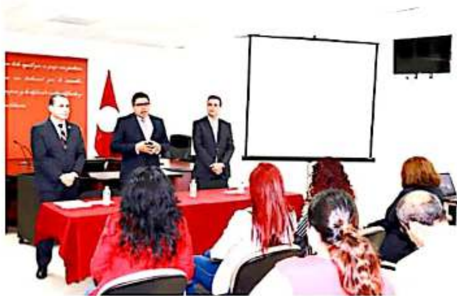
CD. LÁZARO CÁRDENAS, MICH.- Se realizó la capacitación del sistema de Juicio en Línea a personal de la Secretaría de Seguridad Pública y del Centro Estatal de Control y Confianza.

Cabe señalar que el Tribunal de Justicia Administrativa del Estado de Michoacán continuará con talleres de capacitación tanto para dependencias estatales, municipales y público en general, para así garantizar el acceso a la justicia en materia administrativa en la entidad.