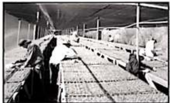
ESTÁ LA PROPUESTA PARA DAR INCENTIVOS FISCALES A LAS COMUNIDADES QUE TENGAN CULTIVOS SUSTENTABLES Y MEDIDAS A FAVOR DEL AMBIENTE.

Durante el encuentro con el director de la Conafor, se agradeció a los gobiernos federales recientes el apoyo en asesoría técnica que fue fundamental para el crecimiento de la empresa comunal hasta lograr certificaciones máximas que garantizan una explotación con garantía de conservación de los recursos naturales para dar paso al ser el principal soporte de la economía en este municipio.