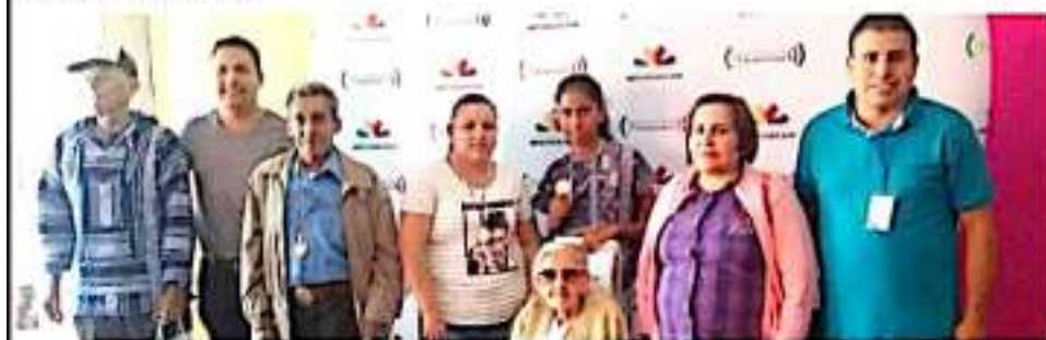
LOS REYES, MICH.- Siete reyeses recibieron aparatos auditivos en la capital del estado.