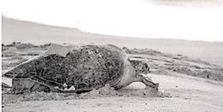
Esta se realizará la segunda Reunión Internacional sobre Tortugas Marinas del Pacífico Oriental Tropical: reto de la conservación.