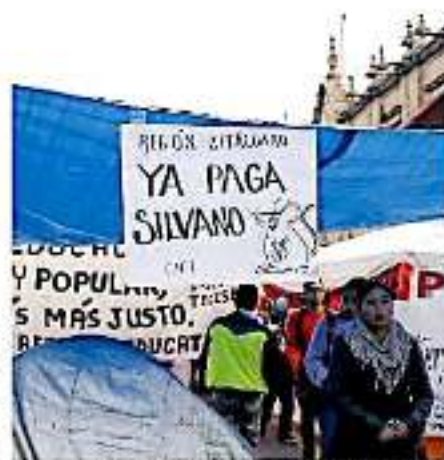
Las confrontaciones con el gremio docente han sido por la irregularidad en pagos / archivo

El mandatario estatal afirmó que tras casi 10 meses de arduo trabajo para la federalización de la nómina finalmente podrían terminarse las confrontaciones con el gremio