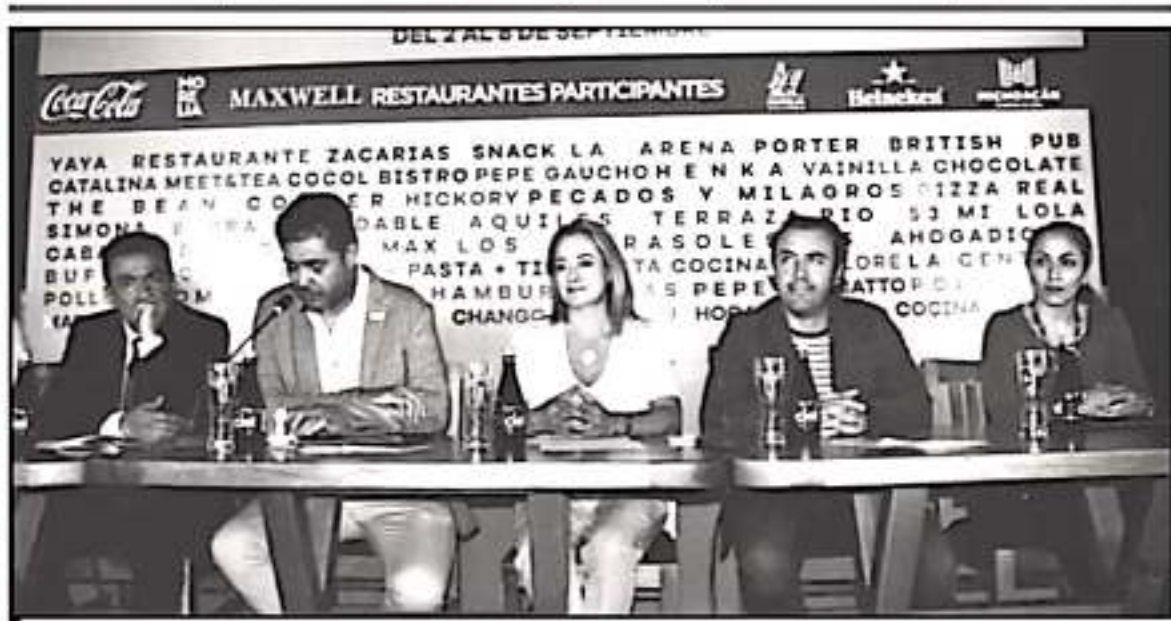
FUNCIONARIOS Y LÍDERES DEL SECTOR RESTAURANTERO DEBEN A CONOCER LOS PORVENIDORES DE FESTIVAL DE ALIMENTOS Y BEBIDAS EN LA CAPITAL.