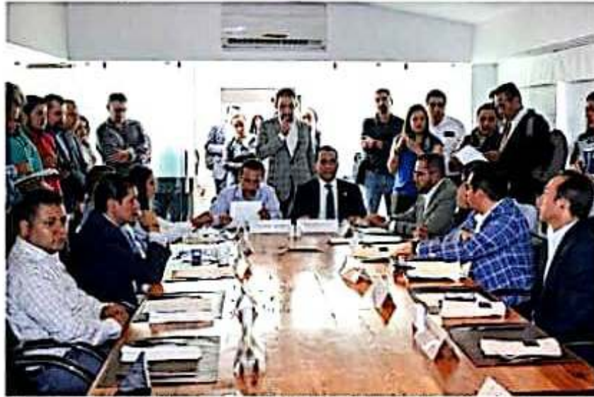
Integrantes de Comisiones Unidas de Justicia, Seguridad y Protección Civil, recibieron al Fiscal General del Estado.