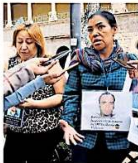
Madres de desaparecidos acudirán a Semefo este viernes de 9:00 a 14:00 horas.

Así pues, invitó a quienes buscan a sus familiares, a acudir el próximo viernes a las instalaciones de la Semefo para agilizar los procesos de búsqueda, en un horario de 9:00 a 14:00 horas.