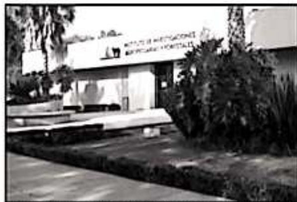
EL INSTITUTO DE INVESTIGACIONES AGROPECUARIAS DE LA UMSNH PREPARA SU SEPTIMO SEMINARIO PARA ESTUDIANTES E INTERESADOS EN LA MAESTRIA