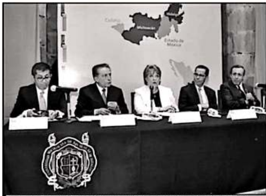
EL TRIBUNAL ELECTORAL DEL ESTADO DE MICHOACÁN REALIZÓ UNA POSESIÓN EN LA FACULTAD DE DERECHO

jueces menores en Michoacán que resolvían conflictos sin formalidades, en procesos orales, lo más rápido posible y a satisfacción de las partes, saliendo éstas del juzgado y seguitando siendo los mismos amigos y vecinos. Esa justicia no lotrada, pero no ignorante, resolvía con apego a verdaderos principios de justicia, encomió el magis-