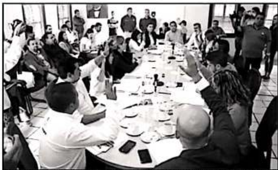
EL CABILDO DE URUAPAN DECIDIÓ CANCELAR LA CONCESIÓN A LA EMPRESA RESPONSABLE DEL TIRADERO MUNICIPAL.