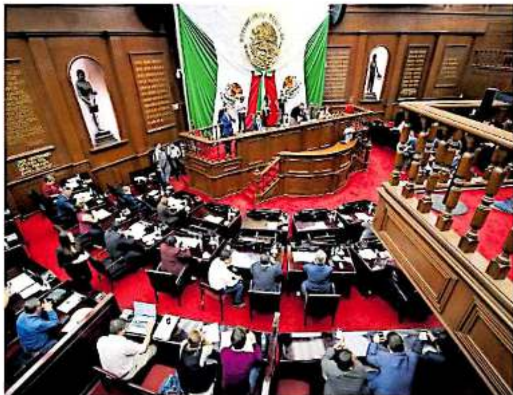
Diputados de la Legislatura local explicaron que, de aprobarse la desincorporación, la autoridad tendrá que cuidar la dispersión de los recursos. ANED/VO

Sin embargo, aclaró que "por los tiempos, se debe tener una consideración por-