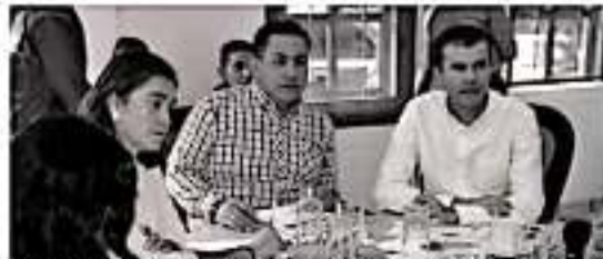
URUAPAN, MICH.- El acuerdo fue cancelado por mutuo acuerdo entre el alcalde y la compañía señalada, que desde el 11 de diciembre de 2014 tenía a su cargo el manejo de los residuos sólidos en este municipio.

Reñó que el siguiente paso es buscar alternativas de inversión y trazar una ruta de trabajo para dar un tratamiento adecuado a los desechos sólidos y lograr que el depósito de basura deje de ser fuente de contaminación ambiental.