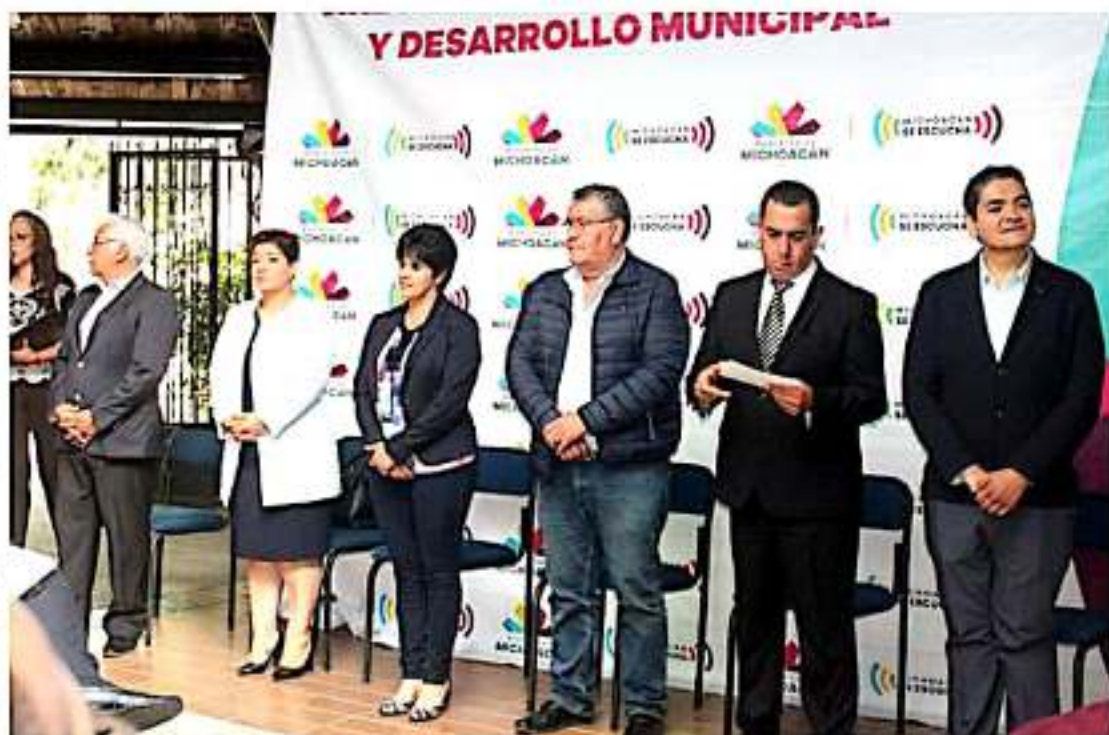
Un total de 243 funcionarios municipales y de organismos operadores de agua potable de 95 ayuntamientos, participaron en el taller de actualización para la elaboración de las iniciativas de leyes de ingresos municipales para el ejercicio fiscal 2020.

Capacitan a tesoreros y controladores municipales para elaborar las propuestas de leyes de ingresos del ejercicio fiscal 2020