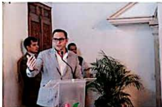
Diputado Hugo Anaya Ávila, presidente de la Comisión de Fortalecimiento Municipal y Límites Territoriales del Congreso del estado.

El presidente de la Comisión de Fortalecimiento Municipal y Límites Territoriales señaló que se pretende construir entre todos una visión integral y en conjunto para llegar a una nueva Ley Orgánica Municipal que fortalezca y promueva el desarrollo de todos y cada uno de los municipios michoacanos.