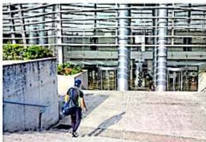
Se podrá acceder a los más de 50 cursos en el Polifórum.

de las empresas con sus trabajadores. Por ello, en lo que va del año se han firmado alrededor de 6 convenios con instituciones y empresas consultoras, a través de los cuales se han beneficiado un aproximado de más de mil personas.