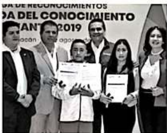
MORELIA, MICH.- El gobernador de Michoacán, Silvano Aureoles Conejo, sostuvo un encuentro con 27 niñas y niños que resultaron ganadores de la competencia educativa.

Cabe hacer mención que los ganadores son niñas y niños de los municipios de Aguila, Ana de Rosales, Artega, Carácuaro, Cherán, Cutcio, Hidalgo, Huastamo, Lázaro Cárdenas, Maravatón, Morelia, Queréndaro y Uruapan.