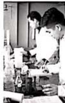
La biotecnología es una de las especialidades que se ofrecen en la Universidad Tecnológica de Morelia.

Así, a los interesados de esta carrera -hasta 300 estudiantes-, se les informa que el próximo examen de admisión se llevará a cabo el sábado 31 de agosto en las instalaciones de la UTM, ubicadas en la Avenida Vicepresidente Pino Suárez número 750, de la colonia Ciudad Industria o al teléfono 443 113 5900.