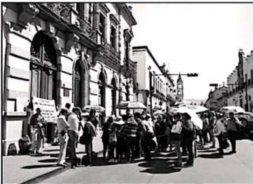
CONTINÚAN LOS AMAGOS DE PROTESTAS Y PAROS POR PARTE LOS DOCENTES SI NO SE PAGAN LAS QUINCENAS COMPLETAS

de que se "roba" el dinero y reiteró que jamás tomaría recursos públicos, mucho menos de educación, al recordar que el origen del déficit educativo corresponde a la falta de financiamiento, como lo marcó el convenio con la Federación sobre los servicios educativos.