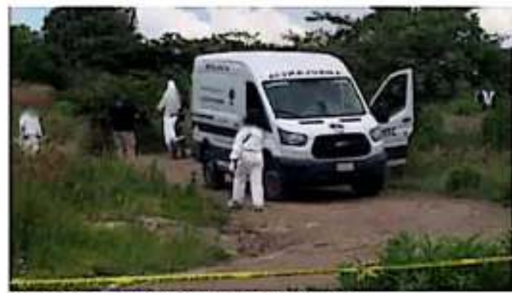
Activación por a familiares de desaparecidos acudir más vermes a la fiscalía. (PRO) 118

En entrevista, Iberta Corona Banderas, quien desde hace diez años está en busca de su hijo Patricio Banderas Corona, desaparecido en el municipio de Jurucaco en un tren de policías municipales, pidió a los familiares dejar a un lado el miedo y acercarse a la fiscalía con la información necesaria para que las autoridades agilicen