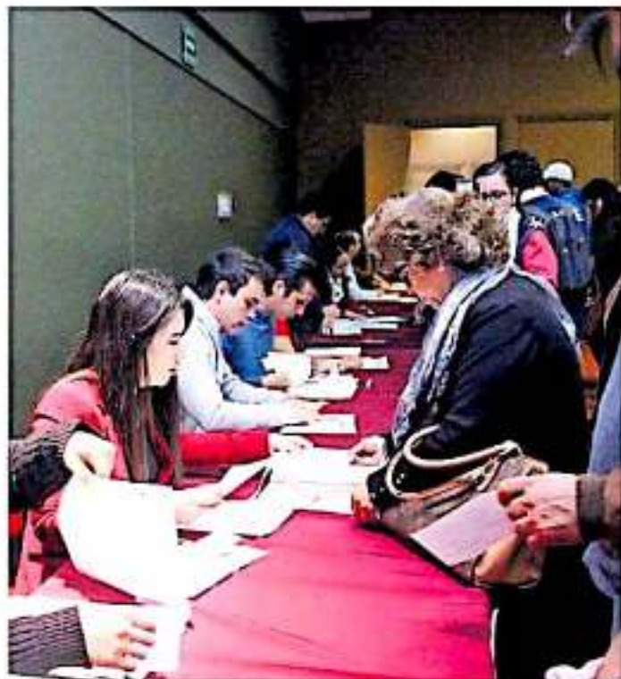
Se tuvo el consenso de todas las entidades federativas del país.

Manifiesta que la propuesta de aglutinar a todas las personas focalizadas desde lo local hasta lo federal con un programa social, también se planteó dicha iniciativa al Consejo Nacional de Evaluación de la Política de Desarrollo Social (Coneval) para el mejor manejo de los recursos, sobre todo, cuando el principal parámetro de de-