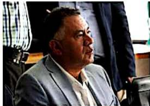
Fermín Bernabé Bahena, coordinador del grupo parlamentario de Morena en el Congreso local.

tes de la Cuarta Transformación, no le fallaremos a las y los michoacanos que demandan una mayor protección al ser víctimas de actos delincuenciales", concluyó.