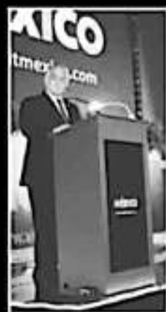
ANUNCIAN VISIT MÉXICO