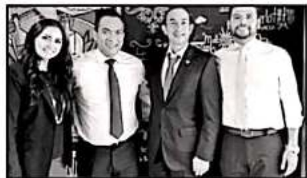
AYER, EL FISCAL GENERAL DE LA ENTIDAD, ADRIÁN LÓPEZ SOLÍS, DESMENUZÓ ANTE LOS DIPUTADOS EL PLAN ESTRATÉGICO DE PERSECUCCIÓN DEL DELITO

Es de destacar que la Ley Orgánica mandata incrementar 30 por ciento los puestos de mando de la Fiscalía.