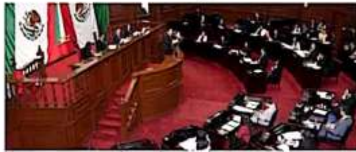
Se busca crear un espacio para que los jóvenes realicen un ejercicio de participación ciudadana. COMUNICA

En ese sentido, informó que el 7º Parlamento Juvenil dará inicio este jueves, con el registro de participantes en el