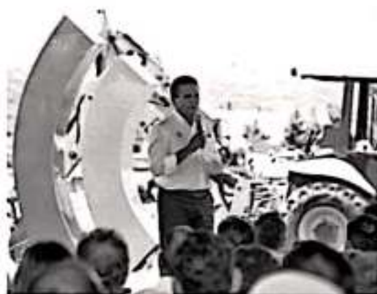
ZAMORA, MICH.- El gobernador del estado, Silvano Aureoles Conejo, dio el banderazo de arranque a la construcción del tramo carretero Zamora-Ecuandureo, en su primera etapa, obra que beneficiará a miles de michoacanos

Por su parte Marisela Herrera Sepúlveda, encargada del Orden de Tierras Blancas, agradeció el interés mostrado por el Gobernador del Estado, para reactivar esta obra y ponerla en marcha nuevamente beneficiando a miles de ciudadanos y productores de la región.