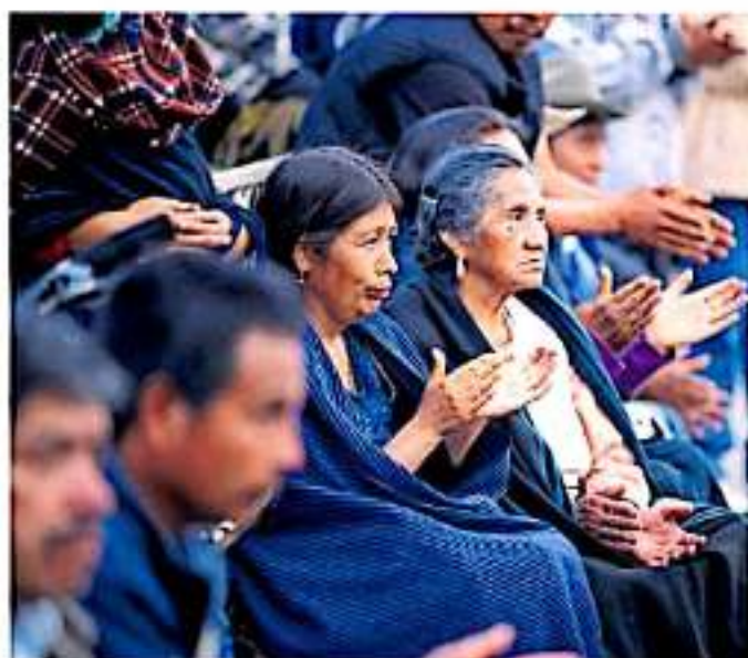
En la Miseta Purenché se tiene proyectado instalar una oficina de abogados en Paracho (ANED/ANED)

Dentro de este último están algunas poblaciones indígenas del territorio michoacano en las que incluso, el registro a julio fue de apenas 30 personas originarias de las comunidades de Santa Fe de la Laguna y San Jerónimo Purenchécuaro que fueron